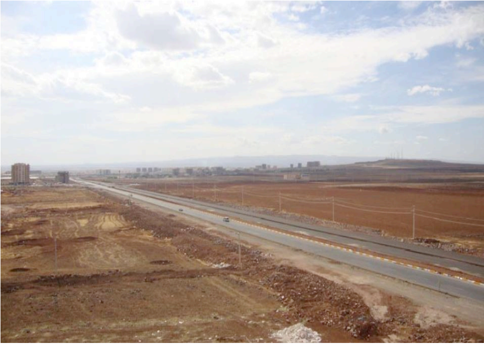
Resim 10: 75 Metre 2010 Yılında Boş Bir Araziyken.

Genelde bu mahalle denince Diclekent, durumu iyi olanlar geçiyordu. Yani hali vakti yerinde olan insanlar, durumu müsait olan insanlar gelip buraya yerleşiyordu. Şimdi hemen hemen orta hale dönüştü. Çünkü 75'in üzeri daha iyi. Oraya taşınıyorlar (Erkek, 39, Kapıcı).