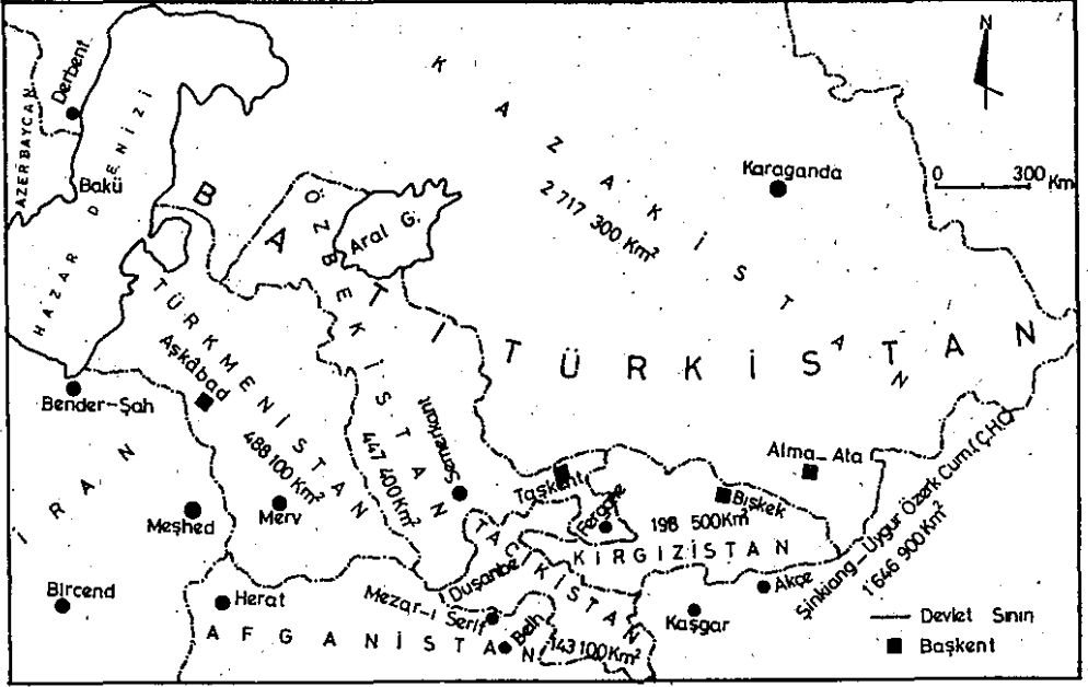
Harita 1- Batı Türkistan ve 21 Aralık 1991 tarihinde burada oluşan bağımsız beş Türk cumhuriyeti: Kazakistan, Özbekistan, Türkmenistan, Kirgizistan ve Tacikistan.