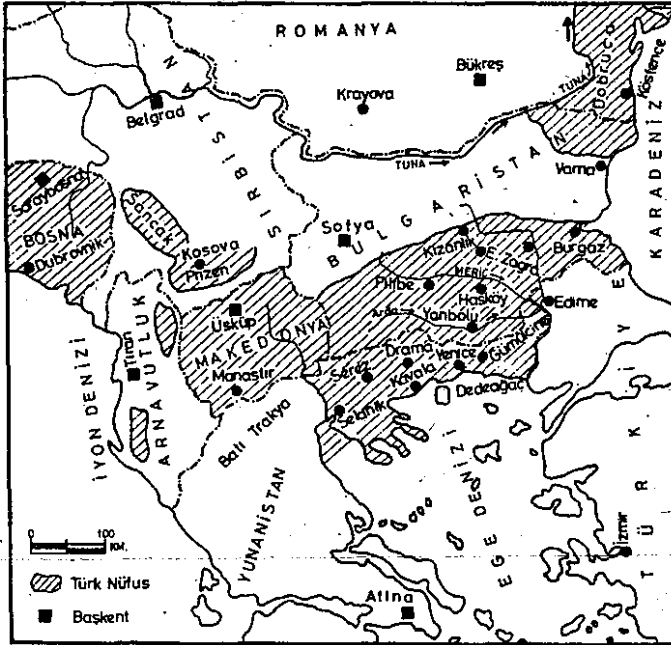
Harita 7- Balkan ülkelerinde Türk nüfus yoğunluk bölgelerinin coğrafi dağılışı.

Balkan ülkelerindeki Türk nüfusun coğrafi dağılışını burada tamamlarken; Romanya-Moldavyası Türk nüfusun yaşama bölgesinin (Gagavuz Türkleri) devamı olması dolayısıyla, Moldavya Türk nüfusunun da, hatırlamak gerekir. Daha önce de değinildiği üzere, 1991 yılında resmen tarihteki yerini alan eski S.S.C.B'nin toprakları üzerinde, şimdilik kaydıyla, 15 bağımsız devlet kurulmuştur (Gelecekte bu sayı, daha da artabilir). Oluşan bu yeni devletlerden biri de, alanı 33 700 km 2 . kadar olan Moldavya'dır. Romanya'ya komşu ve zaten topraklarının 20 bin km 2 . kadarını bu ülkenin işgalinde olup, gerçi Prut ırmağı, Romanya-Moldavya arasında sınır çizirse de, bu ırmağı aslında siyasi bir sınırdır ve Moldavya ülkesinin birliğini parçalamıştır. Tıpkı Meriç gibi. Nüfusu 4.8 milyon (1992) kadar olan bu ülke nüfusunun, % 3.6'sı Türk nüfustan oluşur. Bu da, 172 bini aşar (Gagavuz Türkleri).