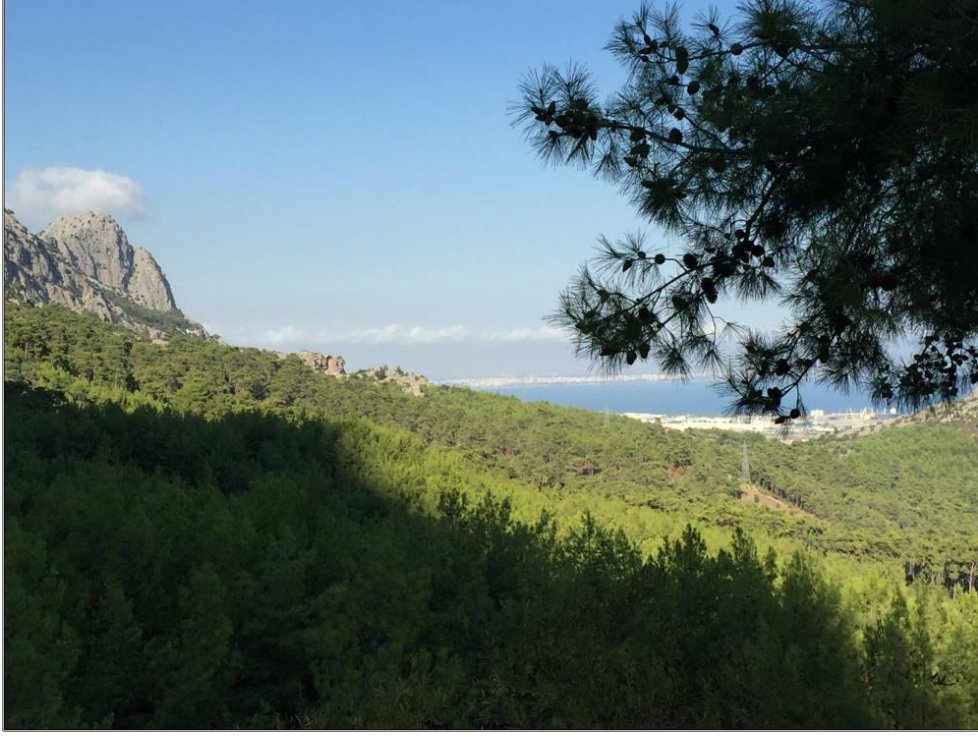
Foto 1- Rekreasyon alanından bir görüntü, Hisarçandır

AYRA'nın başka bir özelliği, sahanın kısa mesafede yükseltisinin 700 m ye kadar ulaşmasıdır. Altinyaka Yolu'nun her iki yanında neredeyse kızılçam ağaçlarının kesintisiz devam ettiği ormanlık sahada ilerleyen bir yolla yaklaşık 15 dakikalık bir otomobil yolculuğu, yaz mevsiminde, kıyının, yüksek sıcak ve neminden uzaklaşıp rahat bir gün geçirmek isteyenlerin tercihini etkileyebilmektedir.