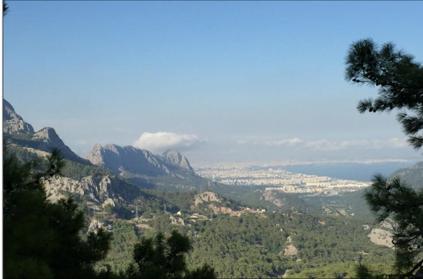
Foto 3- Rekreasyon alanı ve Antalya şehrinin görüntüsü, Karakuz Mevkii.