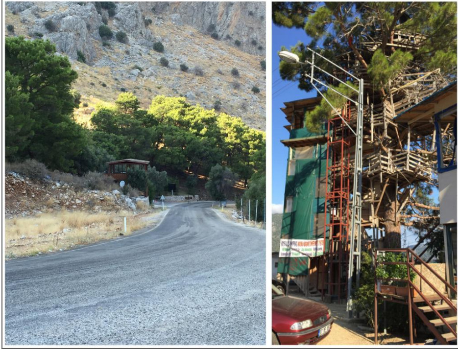
Foto 4- Rekreasyon alanında restoran ve kahvaltı evi, Altinyaka Yolu.

Rekreasyon Alanı'nda, yol boyunca 4 mevkide, yöre halkı tarafından işletilen geleneksel kültürel kimliğin muhafaza edildiği piknik, büfe restoran, kahvaltı evi, mini market, kasap şeklinde isimlendirilen tesisler bulunmaktadır. Alanda, rekreasyon aktiviteleri için henüz kamu kurum ve kuruluşlarına ait herhangi bir alt ve üst donatı yoktur (Foto 4 bkz).