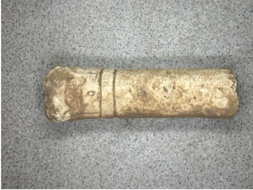
Resim 21- Çelenk ya da girlandlı sütunçe parçası. (Çekim tarihi: 20.01.2004)