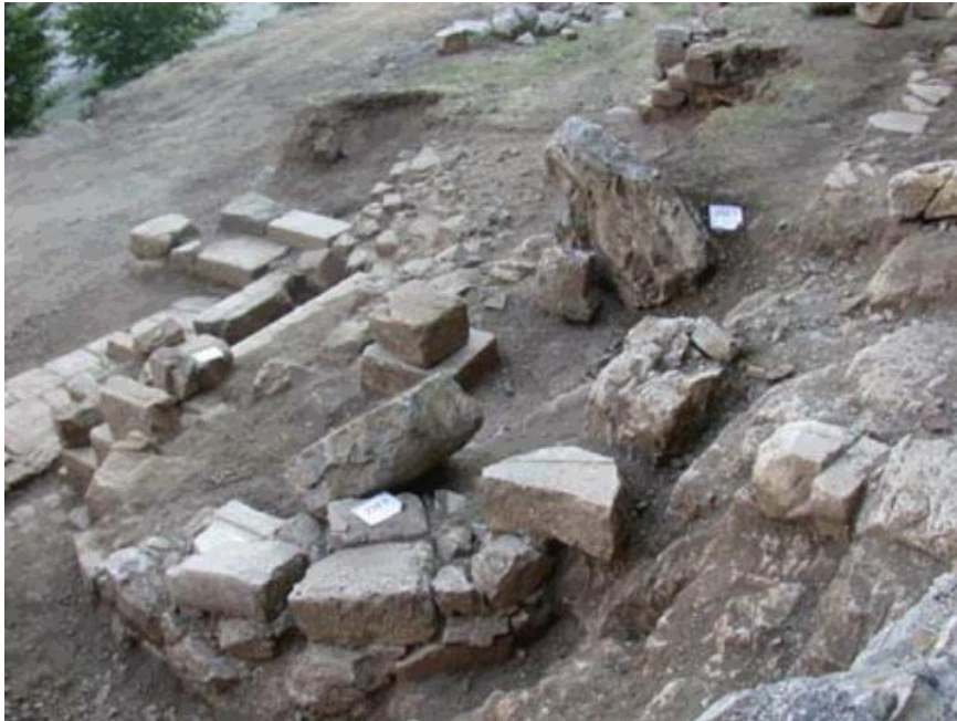
Resim 3- Mağara önündeki şapel kalıntısı (2004 Yılı Zindan Mağarası Kazı Raporundan)