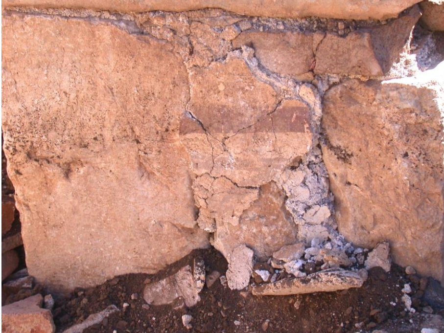
Resim 15- Kırmızı ya da koyu kahverenginde silmeli bezeme. (Çekim tarihi: 18.10.2003)