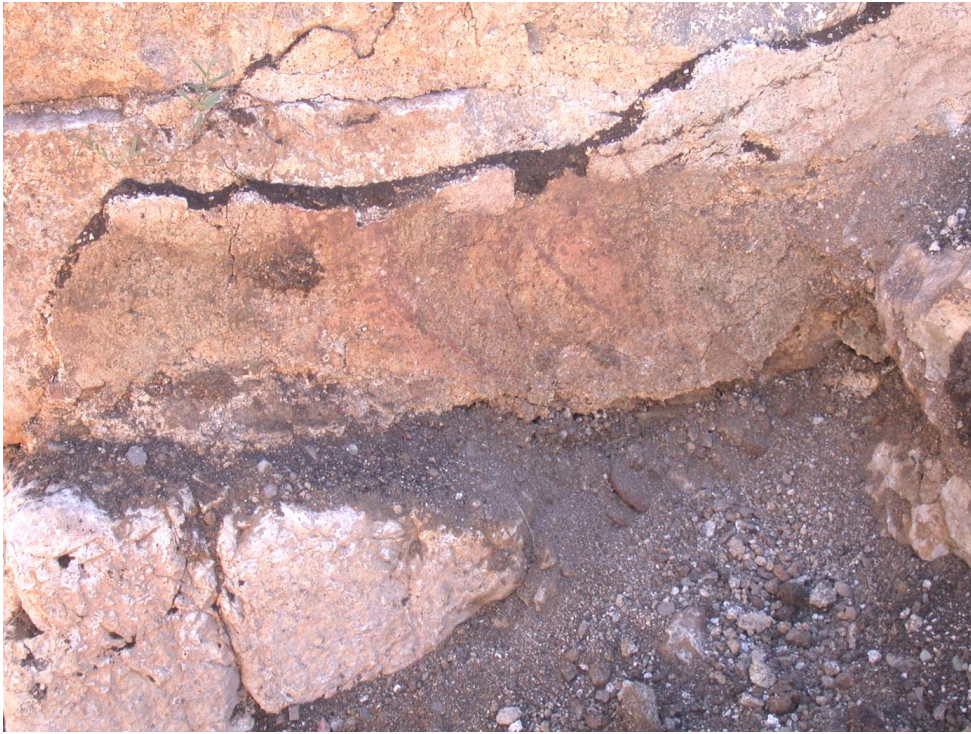
Resim 20- Sıva üzerinde içeriği anlaşılamayan bezemeler. (Çekim tarihi: 18.10.2003)