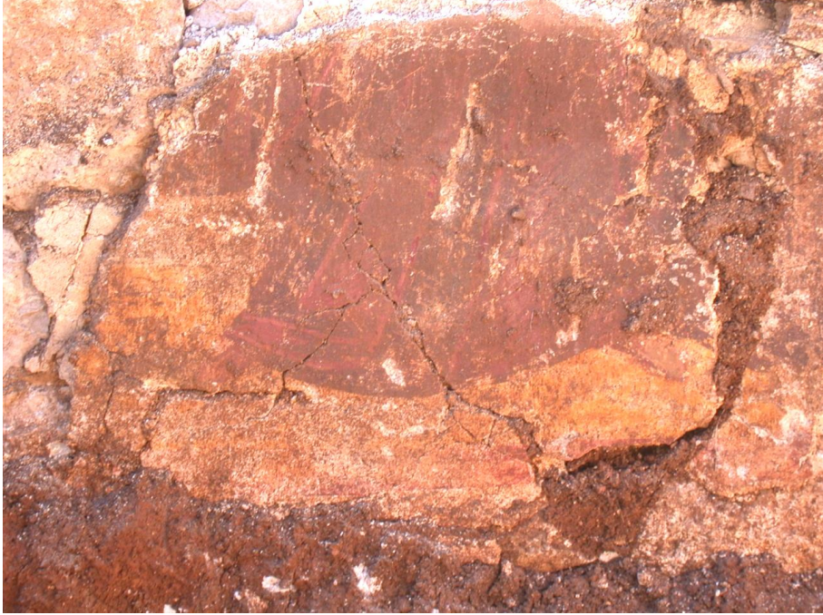
Resim 14- Kilise içerisinde, duvardaki etek kısmı betimlenen figür. (Çekim tarihi: 18.10.2003)