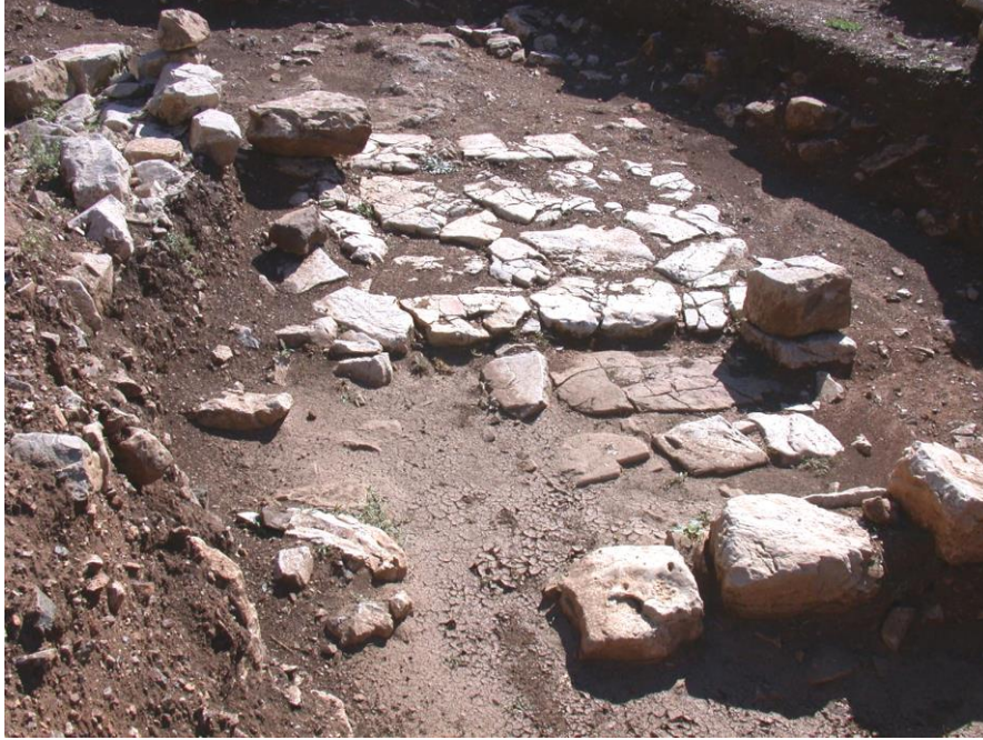
Resim 6- Tepeden aşağıya doğru inen taş döşeli yol. (Çekim tarihi: 23.11.2003)