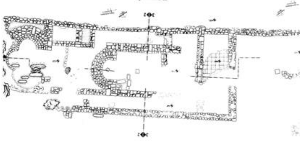
Çizim 3- Bazilikal planlı kilise ve şapelin planı. (Dedeoğlu, “Aksu Zindan Mağarası Kutsal Alanı”, s. 61)