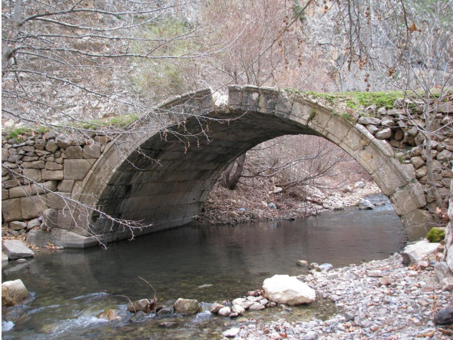
Resim 2- Roma Köprüsü'nün güney yönden görünümü (Çekim tarihi: 03.05.2001).