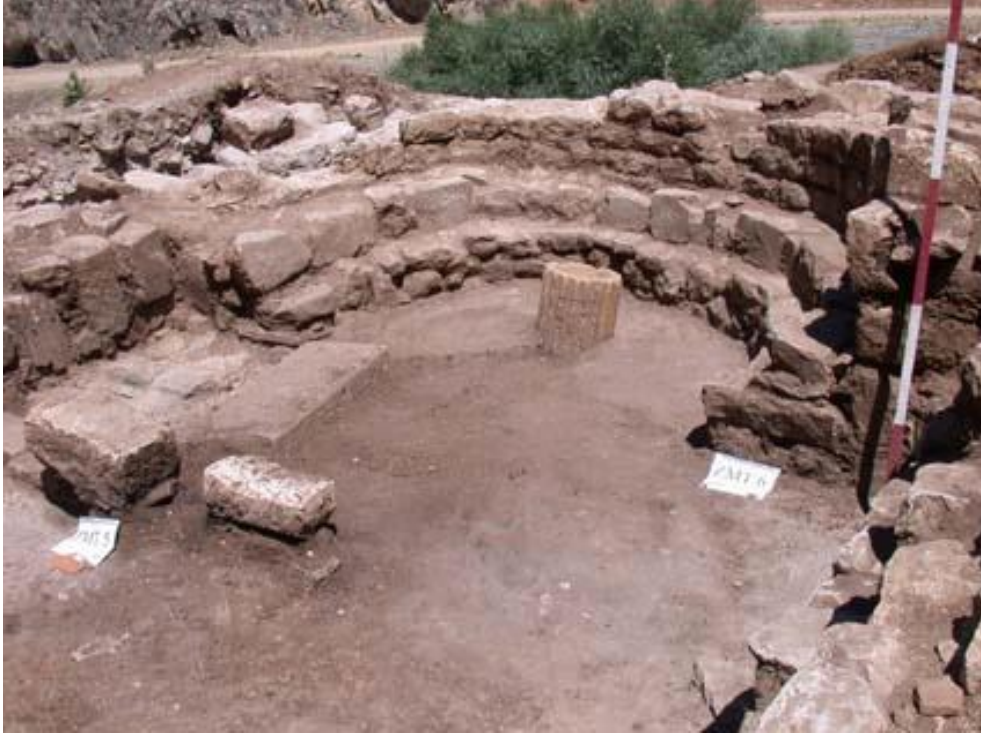
Resim 12- Şapelin sintrononlu apsisi ve ortasındaki vaftiz kabı. (Çekim tarihi: 15.09.2003)