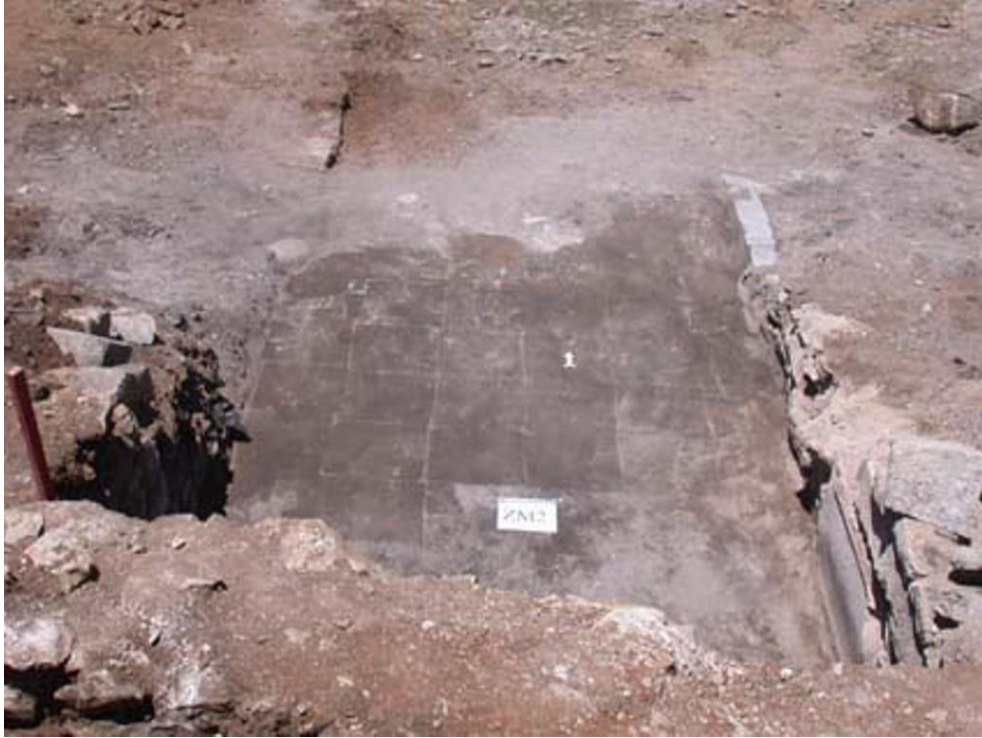
Resim 9- Nartheksin görünümü. (Çekim tarihi: 08.06.2003)