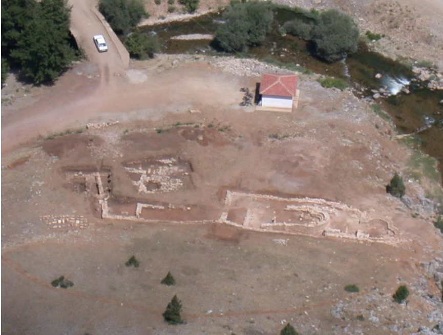
Resim 8- Karşı tepede bulunan bazilikal planlı kilise'nin yukarıdan görünümü.