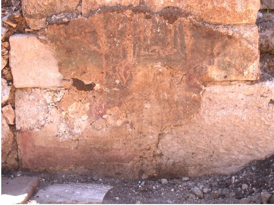
Resim 16- Kilise içerisinde figürlü ve bitkisel bezemeli duvar resmi. (Çekim tarihi: 18.10.2003)