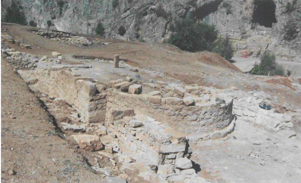
Resim 13- Şapel apsisinin dıştan görünümü (Çekim tarihi: 06.06.2005)