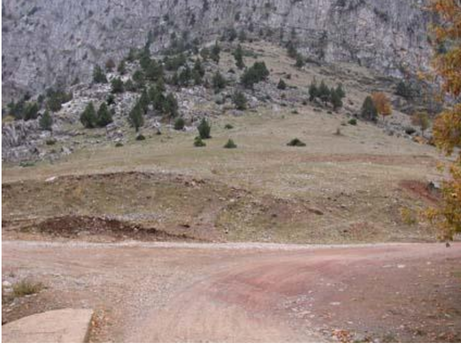
Resim 4- Zindan Mağarası karşı tepenin önceki görünümü. (Çekim tarihi: 12.05.2003)