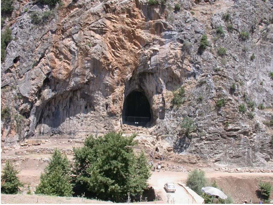
Resim 1- Zindan Mağarası önünün genel görünümü (Çekim tarihi: 03.05.2011).