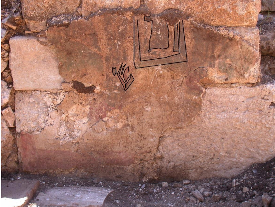
Resim 17- Figürlü ve bitkisel bezemeli duvar resminin konturlarının siyah renkle tahmini olarak gösterilmesi.