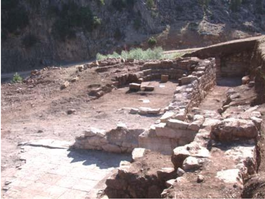
Resim 11- Şapel yapısının genel görünümü (2004 yılı Zindan Mağarası kazı raporundan)