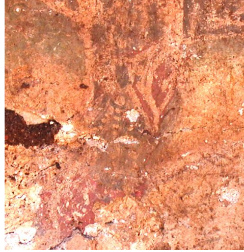
Resim 19- Bitkisel olabilecek bezeme detayı Çekim tarihi: 18.10.2003)