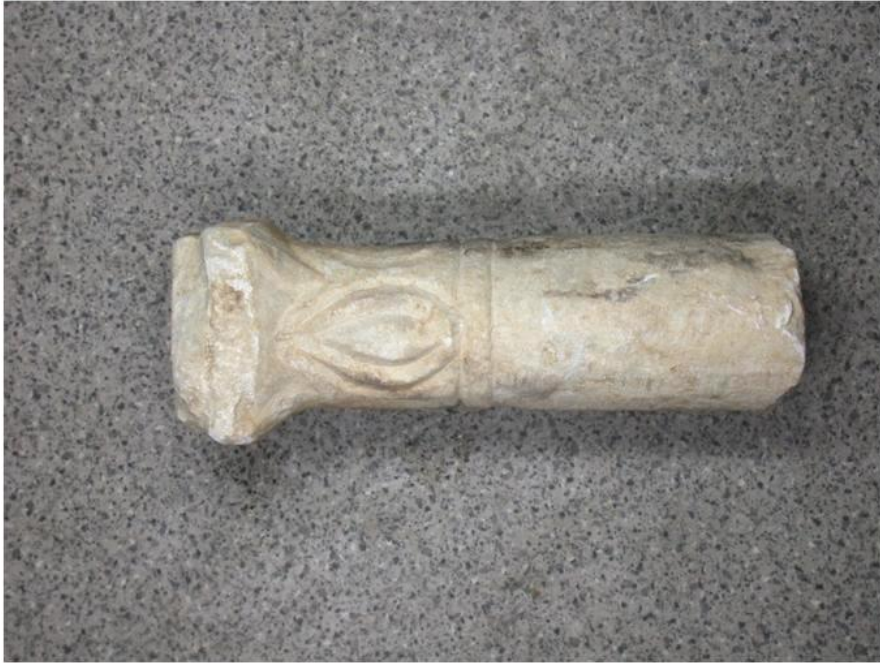
Resim 22- Stilize yaprak kıvrımları içerisinde gözyaşı damlasını andıran motifli sütunçe parçası. (Çekim tarihi: 19.01.2004)