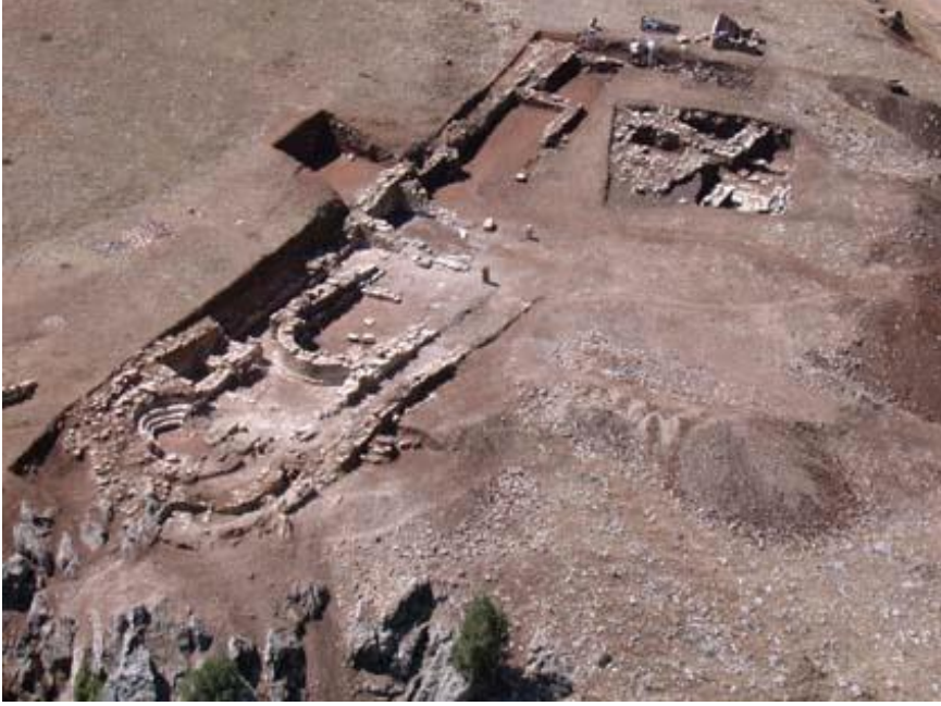
Resim 7- Bazilikal planlı kilisenin yukarıdan görünümü. (Dedeođlu, “Aksu Zindan Mađarası Kutsal Alanı”, s. 162)