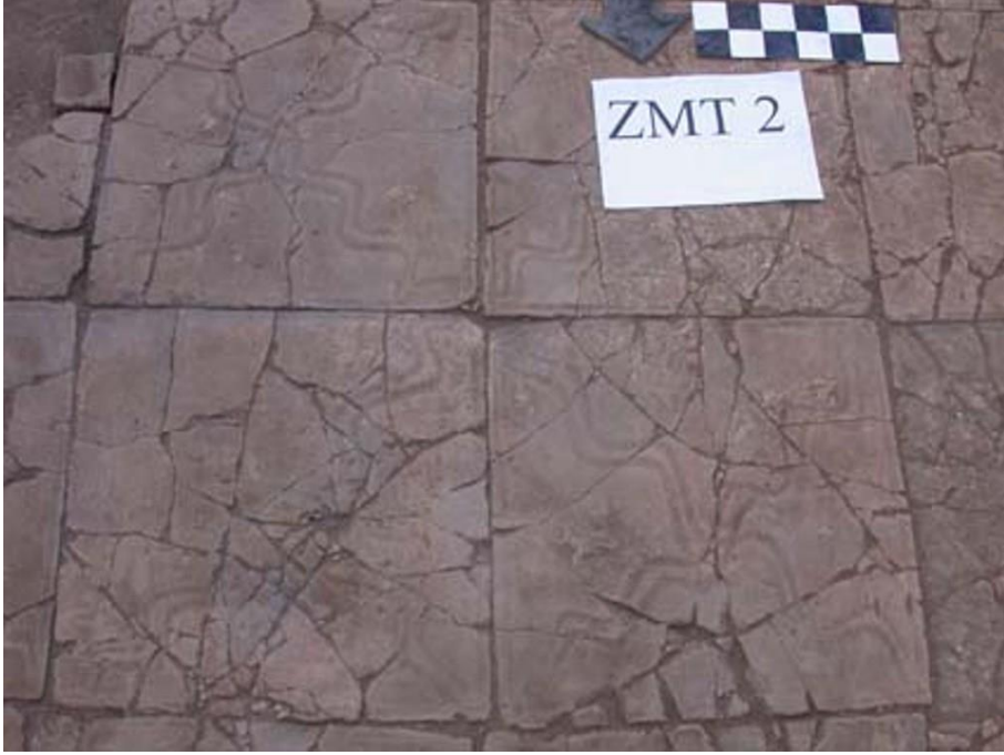
Resim 10- Nartheksin tuğla döşemesinden detay görünüm. (Çekim tarihi: 08.06.2003)