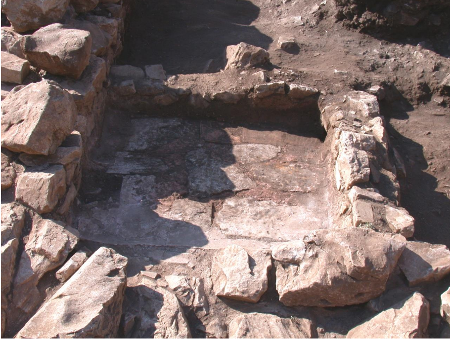
Resim 5- Atriumda ortaya çıkartılan kare planlı işlik. (Çekim tarihi: 23.11.2003)