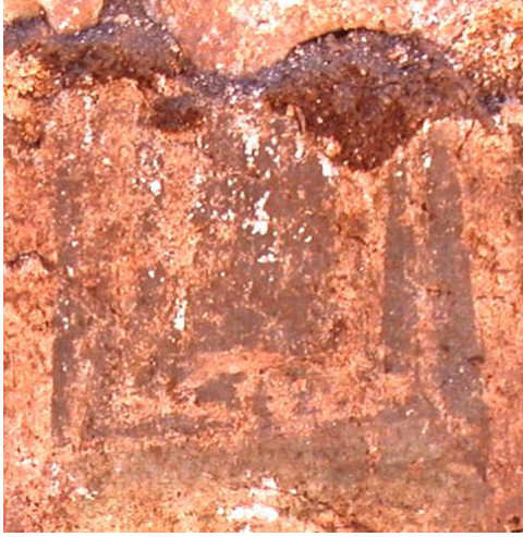
Resim 18- Kalın silme içerisinde figürlü bezeme detayı. (Çekim tarihi: 18.10.2003)