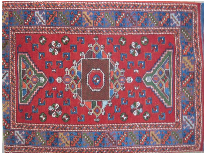
Görsel 5. Ayvacık Yöresi, Turnalı Halı , 21. yy., 99x 2,27 cm.

“Turnalı halı” adını; zemininde bulunan madalyona paralel gelecek şekilde, peş peşe uçan ve dokuyucular tarafından turna katarı olduğu söylenen motif grubundan almıştır (Aksoy, 2008:312; Anderson, 1998:45; Bayraktaroğlu, 1985:244). Zeminin başlangıç ve bitiş yerinde “Turnalı’nın yarımı” adı verilen birer yarım madalyon bulunur. Halının zemini genellikle Türkmen gülü ve yıldız motifleri ile dolgulanmaktadır (Görsel 5).