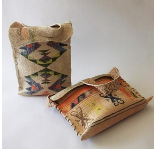
Görsel 10. Fatma Doğan, Ağıtlar II , 2017 .

Hiperrealistik seramik çalışmalar yapan seramik sanatçısı, 2019 tarihinde yayımladığı yüksek lisans tez çalışmasında halı motiflerini kullanarak çalışmalar yapmıştır. Tezinde yer verdiği 'Ağıtlar II' adlı çalışması, bu konuya örnek teşkil etmiştir. Halı motifini kullandığı seramik eserlerinde kağıt katkılı çamur kullanmıştır (Görsel 10). Serbest el ile şekillendirme ile oluşturduğu heybe formu üzerine kumaş dokusu çalışmıştır. Oluşan üç boyutlu form üzerine Anadolu kilim motiflerinden seçilerek yerleştirilen desenler, sıraltı boyalar ile renklendirilerek 1180 °C'de fırın pişirimi yapılmıştır (Doğan, 2019:66).