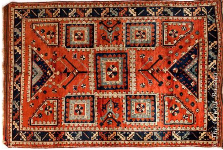
Görsel 1. Ayvacık Yöresi, Altın Tabak Halı , 20.yy, 1,67x 2,56 cm.