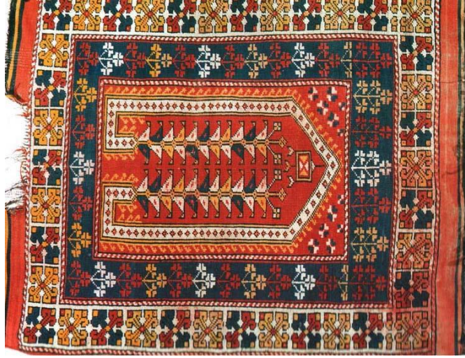
Görsel 4. Ayvacık Yöresi, Sıranılı Halı Seccade , 20.yy, 105x119 cm.