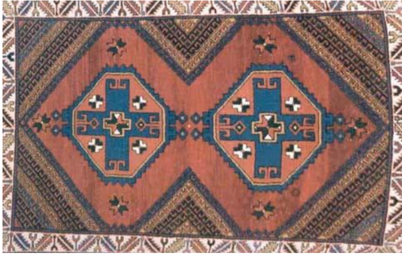
Görsel 3. Ayvack Yöresi, Elekli Halı , 21.yy, 110x180 cm.

İsmi; zeminde görülen ve içinde, uç kısımları içe kıvrık haç biçiminde motifler bulunan basamaklı sekizgen formların, Ayvack'ın Yörük köylerinde eleğe benzetilmesinden almıştır (Anderson, 1998:35,49; Aksoy, 2008:311). Zeminde, köşelerde içleri noktalarla doldurulmuş üçgen ejder formları yer alır. “Elek” motifi, yüksek düğüm sıklığına sahip Bergama halı örneğinden, daha düşük kalitedeki Ayvack halılarına deforme olarak geçen bir “Lezgi yıldızı” motifidir (Anderson, 1998: 49;Aksoy, 2008:311).