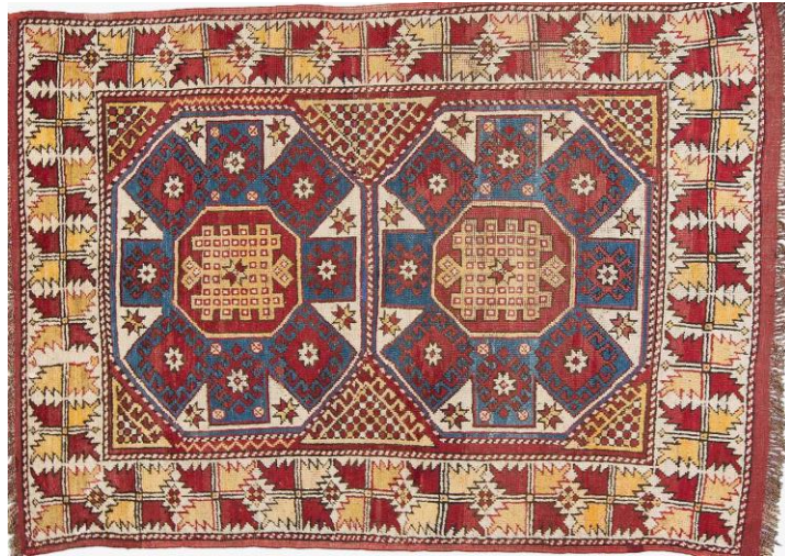
Görsel 2. Ayvacık Yöresi, Çarklı Elek Halı , 19. yy. başı, 146,210 cm.

Kompozisyonu, ikiye bölünmüş zemin tasarımı üzerinde görülen sekiz kollu iki yıldız motifinden oluşur. Yıldız motifinin kolları sekizgen bir madalyondan çıkar. Madalyonun içinde kıvrılarak düğüm şeklini almış bir yılan motifi yer alır (Görsel 2). Bu yılan motifinin Ayvacık halkı tarafından eleğe ve yıldız madalyonun kollarının ise çarka benzetilmesi nedeniyle halı yörede “Çarklı Elek” olarak isimlendirilmiştir (Aksoy, 2008:311).