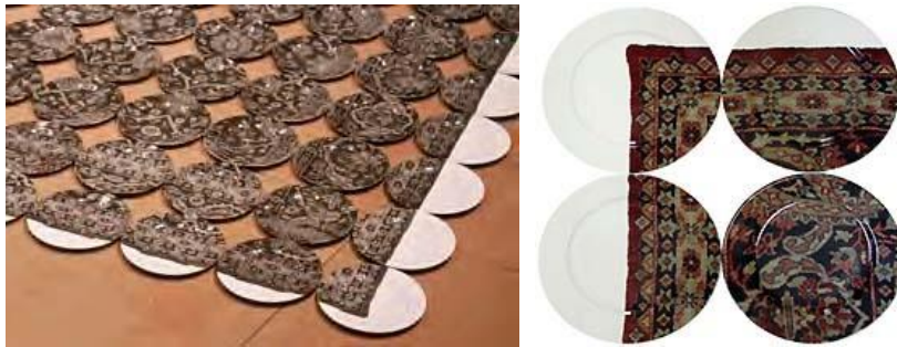
Görsel 6. Marek Cecula, The Porcelain Carpet , 2002, Tabak Üzerine Dekal Baskı, 576 adet.

Yurt içi ve yurt dışında, sanatsal ve endüstriyel yönden birçok çalışması bulunan sanatçı, çalışmalarında geleneksel halı desenlerini çağdaş seramik formlarına aktararak, başarılı eserler üretmiştir. Sanatçının geleneksel halı desenlerini yorumladığı en önemli eserlerinden birisi, 2002 yılında Grand Arts tarafından özel bir enstalasyon olarak yaptırılan 'Porselen Halı Projesi' dir. Sanatçı çalışmada atılan ve istenmeyen bir şeye yeniden değer kazandırarak, onu yeni ve değerli bir sanat eseri üretiminde kullanmaya çalışmıştır (http 1). Porselen Halı Projesinde düzenleme için porselen fabrikasından 576 adet porselen tabak temin etmiştir. Her bir tabakta, bir İran halısının kesitlerinden kopyalar bulunmaktadır. Bu enstalasyon çalışmasında, yemek yenilebilen tabaklar yan yana getirilerek, üzerinde yürünmesi mümkün olmayan bir halıya dönüştürülmüştür (Görsel 6). Tabaklar üzerindeki desenler, yüzeye dekal çıkartma ile transfer edilmiştir (http 2). Endüstri deneyimlerini sanatına aktaran sanatçı, seramik eserlerini porselenden yaparak, şeffaf sırla sırlamıştır. Çalışmaların üzerine yerleştirdiği logolar, izleyicisinin bu nesnelere hangi amaçlarla kullanacağını düşündürmesini sağlamaktadır (Aslan, 2011:53).