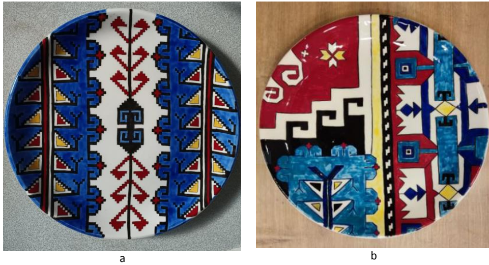
Görsel 12., a. Tasarım 1, Turnalı Tabak, Sıraltı Tekniği, 25x25 cm, fotoğraf arşivi, 2022. b. Tasarım 2, Sıranılı Tabak, Sıraltı Tekniği, 25x25 cm, fotoğraf arşivi, 2022.