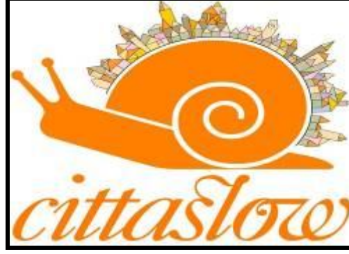
Foto 1. Cittaslow logosu