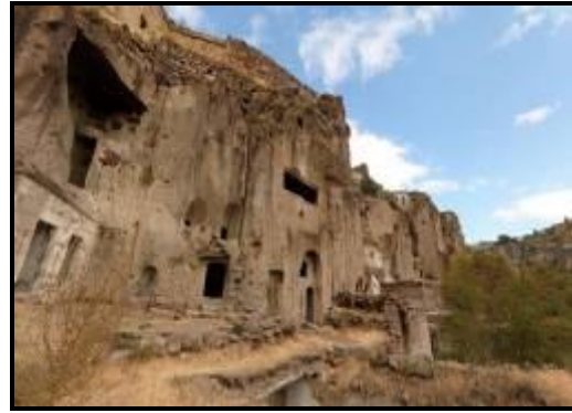
Foto 3 ve 4: Güzelyurt yeraltı şehri ve yeraltı şehrinin giriş kısmından bir görünüm

Güzelyurt ve yakın çevresinde İç Anadolu'nun belirgin iklimi olan karasal iklim özellikleri geçerlidir. Yörede hakim bitki örtüsü bozkır bitkileridir. Vadi tabanlarında özellikle Ihlara Vadisinde çok çeşitli bitki formasyon ve türleri yayılış göstermektedir. Özellikle dere kenarlarında ak söğüt ( Salix Alba ) ve kavak ( Populus Nigra ) gibi bazı ağaç türleri yaygındır.