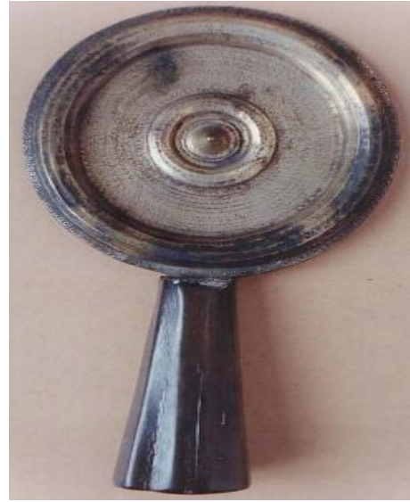
Resim 4: Pazırık Kurganında bulunan ayna 133