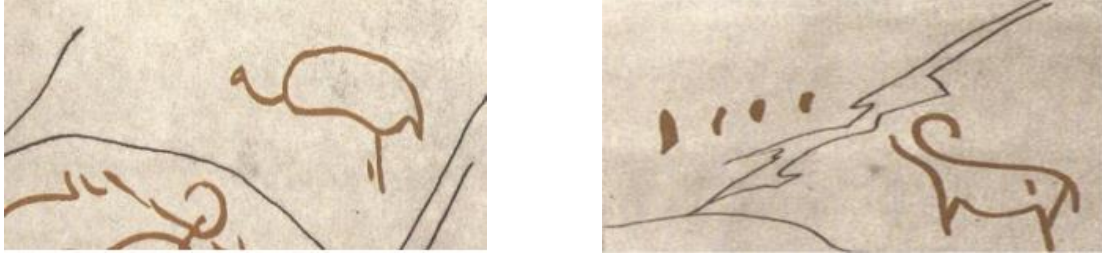
Resim 1: Khoid Tsenker Mağarasında tasvir edilen hayvanlar 81

geçirmek amacıyla sihirli-büyüsel işlemler doğrultusunda yapıldığını düşündürmüştür 80 .