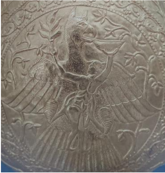
Resim 3: Nagyszentmiklos hazinesi 7 numaralı sürahi üzerindeki kartal figürü 132

Büyü Türk sanatına da yansımıştır. Kartalın hızla göğün en yükseklerine çıkabilme özelliği ona semavî bir anlam yüklenmesine neden olmuş, Gök-Tanrı dini etrafında şekillenerek Türk mitolojisinde kendine geniş bir yer bulmuş ve millî bir kutsal haline gelmiştir 128 . Örneğin Türk kağanlık sisteminde hâkimiyet sembolü olarak görülen çift başlı kartalın yapılış sebebi, kartalın büyüsel fonksiyonlarının iki katına çıkmasının istenmesinden kaynaklanmıştır 129 . Büyünün Türk sanatındaki bir diğer örneği ise Nagyszentmiklos hazinesine ait 7 numaralı sürahi üzerindeki kartal motifinde bulunan kabartma noktalar ya da hilal şekillerinden oluşan beneklerdir. Bu beneklerin büyüsel bir nitelik taşıdığı düşünülmektedir çünkü Türk sanatında at gibi hayvanların beneklerle kaplanmış olarak tasviri yaygındır ve bu tasvirin üzerinde yer alan beneklerin uğurlu, büyü ve tılsımlı olduğu düşünülür 130 . Aynı şekilde Pazırık kurganında bulunan aynaların da büyü anımlar taşıdığı bilinmektedir 131 . Zira kamların ritüelleri sırasında kullandıkları en önemli öğelerden birisi aynalardır. Kamlar bu aynaları bazen büyü için bazen de kehanet için kullanmışlardır.