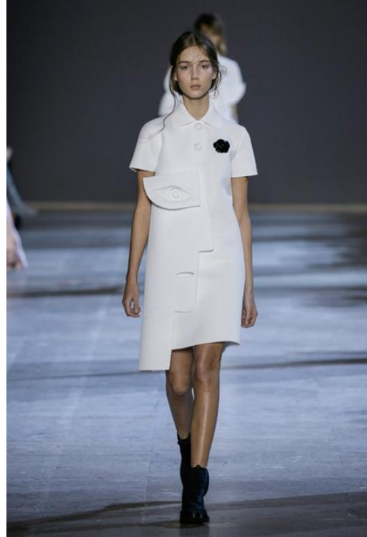
Şekil 7. Mini boy elbise (URL-7).

Picasso'nun 1932 yılında tamamladığı "Ayna Karşısındaki Kız" adlı eserine (Şekil 6.) baktığımızda aynaya bakan bir kadın görülmektedir. Sol tarafta kendisi, sağ tarafta ayna ve kadının yansıması olarak resmedilmiştir. Solda duran genç kadının yüzünün yarısı tıpkı maske takmış gibi makyajlı ve süslü olarak çizilmiştir; diğer yarısı ise açık ten rengiyle hüznü bir bakışla aynaya bakmakta olan bir görüntü vermiştir. Kadının aynadaki yansımasına bakıldığında ise gerçeğine oranla daha koyu ten rengi, gözleri yerinde siyah büyük delikler ve orantısız bir vücudun görünmesi, genç bir kadının yaşlılığa gidişi, yaşlılıktan korkusu, yaşlanmaya bakışı olarak nitelendirilmiştir (Altaş, 2014).