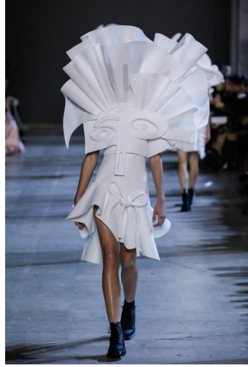
Şekil 9. Etek uçları verev kesimli elbise (URL-9).

Pablo Picasso'nun "Sandalyede Oturan Kadın" (Şekil 8.) adlı yağlı boya tablosu, sarı ahşap çitalı bir sandalyenin önüne yerleştirilmiş (veya üst üste binen) bir kadın figürünün çarpık, geometrikleştirilmiş formunu betimlemektedir. Kadının ağız kısmı dikilmiş bir görüntüyle resmedilmiştir. Ayrıca tablo şapka kıvrımlarının yukarıya doğru bakması ve ince süsleme detayları ile oldukça dikkat çekmektedir (Sundstrom, 2020).