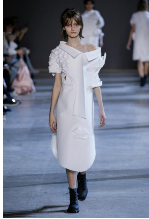
Şekil 5. Gömlek yakası genişletilmiş elbise (URL-5).

Görkemli formatı nedeniyle teknik bir başarı olarak nitelendirilen Françoise Gilot (Şekil 4.) tablosundaki model, hiyerarşik bir tavırla resmedilmiş ve izleyiciye meydan okurcasına bakıyormuş gibi bir görüntü vermiştir. Tek renkli bir çizgide çizilen, hafif ama dolgun, neredeyse Matissian olan saçlara özellikle dikkat edilmiştir. Sirkumfleks vurgulu asimetrik kaşı ve sol gözün altındaki ben, ağız çevresindeki varyasyonlarla birlikte estetiğini tamamlamıştır (Başdoğan, 2016).