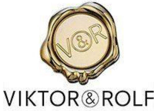
Şekil 1. Viktor & Rolf Mühürü (URL -1).

Viktor Horsting ve Rolf Snoeren ikilisinin haute couture koleksiyonlarında işlenen sanatsal izlenimler “giyilebilir sanat” olarak tasvir edilmiştir. Özellikle markanın 2016 ilkbahar- yaz kreasyonu için Paris Moda Haftası’ndan sergilenen tasarımları kübizmin moda ile nasıl iç içe geçebileceğinin birer örneği niteliğinde olmuştur. İlham kaynağı olarak kübist sanatçı Picasso’nun çalışmalarından izler bulunan tasarımlar, izleyicide sanat ve modanın birlikteliğine deneysel bir bakış sunmuştur.