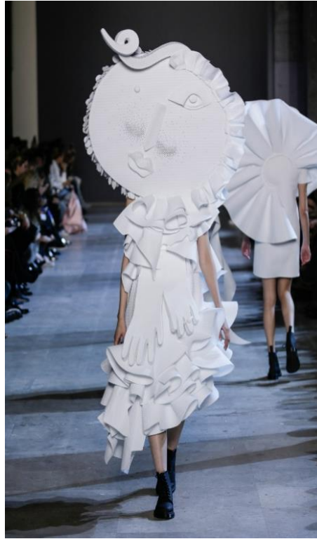
Şekil 11. Volanlı elbise (URL-11).

Picasso'nun Guernica isimli tablosunda dışavurumcu tarzın etkisinde olan el figürleri sıklıkla kullanılarak çalışmaya bütünlük sağlanmıştır. Tablonun en can alıcı figürü olarak sağ kısımda elleri havaya kaldıran kişi olduğunu öne süren (Babacan, 2020) “Acımın, ne denli görünmez olduğunu, kalabalığın içinde dahi olsanız, yardımın bazen mümkün olmadığını, açık bir kapının, her zaman özgürlüğe eşdeğer olmadığını, feryadınızın ne kadar büyük olursa olsun bir anlam ifade etmediğini, belki de bir kuytu köşede tek başına ölümün, ne denli zor olduğunu, savaşın ortasında; bir enkazın, bir yangının arasında kalıp can verirken, çığlıkların nasıl da beyhude olduğunu; göz bebeklerimizden, zihnimize çiviler”.