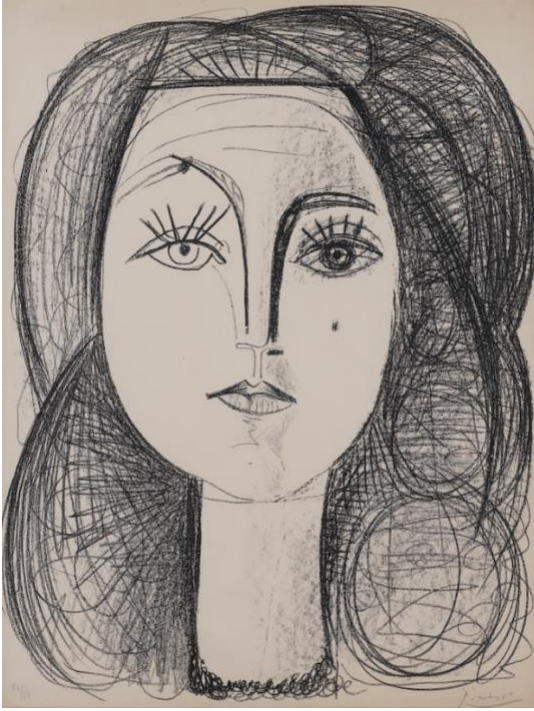
Şekil 4. Françoise Gilot, Pablo Picasso, 1946 (URL-4).