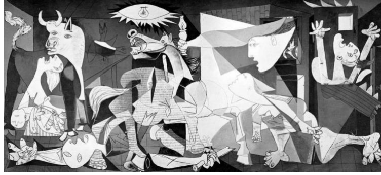
Şekil 10. Guernica , Pablo Picasso, 1937 (URL -10).