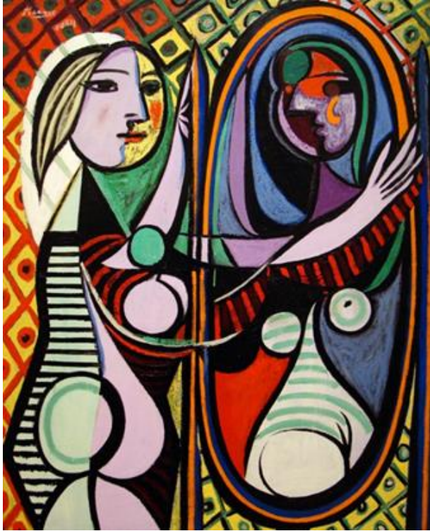
Şekil 6. Ayna Karşısındaki Kız, Pablo Picasso, 1932 (URL-6).