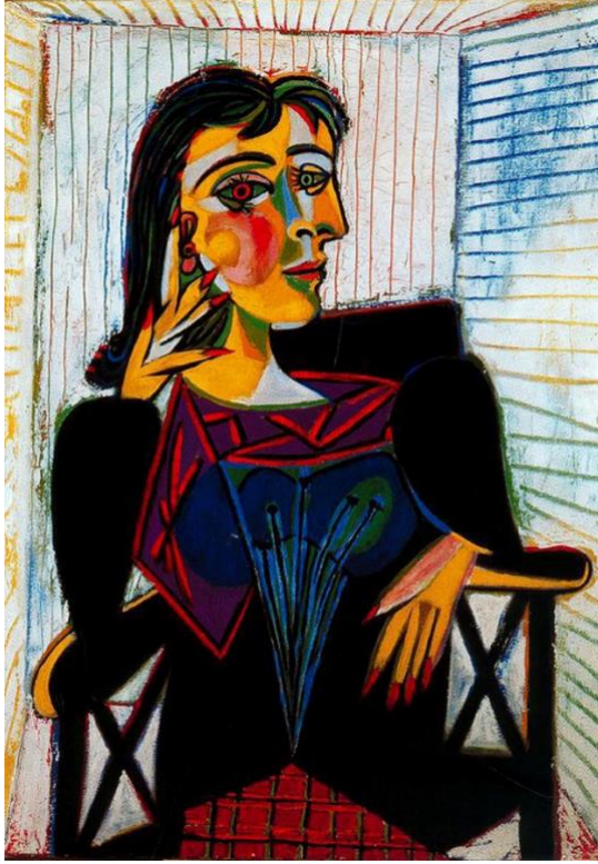
Şekil 2. Dora Maar'ın Portresi, Pablo Picasso, 1937 (URL-2).