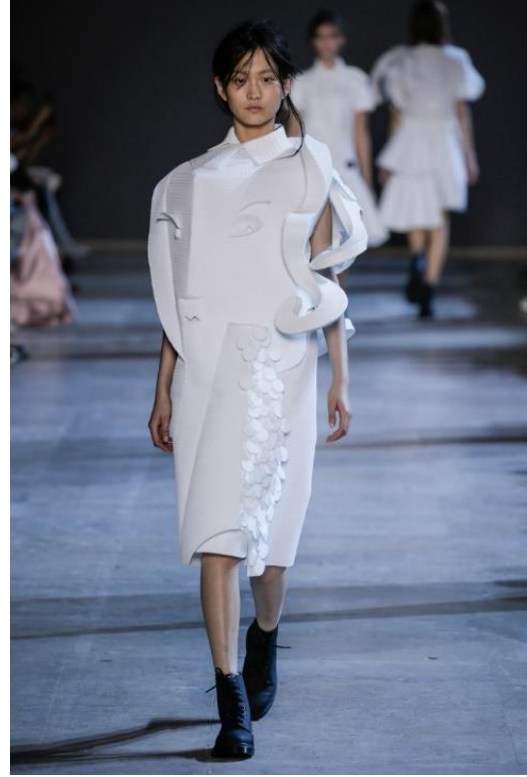
Şekil 3. Bedeni kaplayan yüz ifadesi (URL-3).