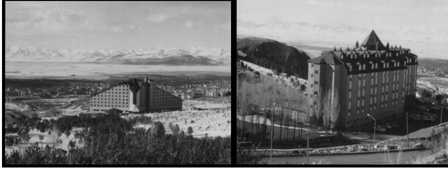
Fotoğraf 1: Palandöken kış turizm merkezi turistik tesislerinden görünüm

faaliyetlerinin gerçekleştirildiği zaman dilimi ile konaklama tesislerinin atıl kalma devresi örtüşmektedir. Bu yönüyle araştırmaya konu olan spor-kamp turizmi faaliyeti için gerekli olan konaklama ihtiyacı Erzurum kenti ve Palandöken kış turizm merkezinden kolaylıkla karşılanabilecektir. Kış turizmi sahasındaki bazı konaklama tesislerinin yetkilileri ile gerçekleştirdiğimiz görüşmelerde, tesislerin kayak sezonu dışındaki dönemde doluluk oranlarını artırmak için bazı girişimlerinin olduğu anlaşılmıştır. Toplantılar, kongreler ve hizmet içi eğitim seminerleri gibi etkinliklerin, doluluk oranlarını artırmada çok ciddi çözümler getirmediği, alternatif turizm çeşitlerinin uygulanmasıyla turistik aktivitelerin yıl geneline yayılmasının başlıca çözüm olacağı, sektör yetkililerinin hemfikir oldukları bir konudur.