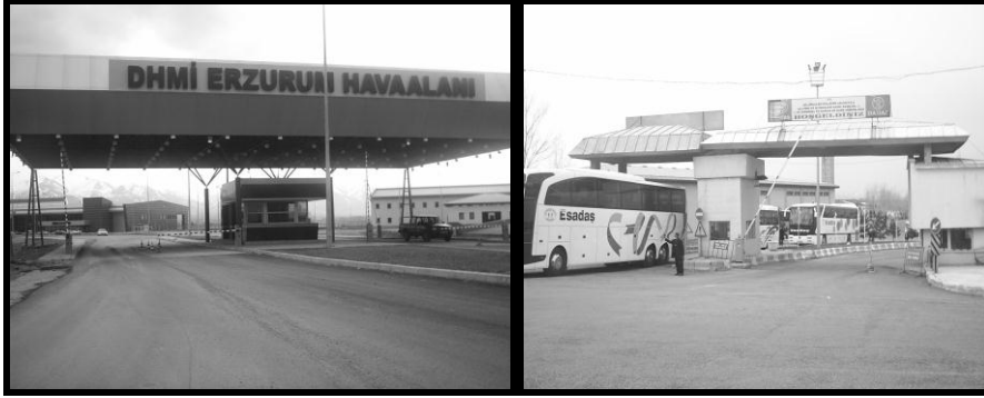
Fotoğraf 2: Erzurum havaalanının girişi ve şehirlerarası otobüs terminali

Yurt içi uçuşlar İstanbul, Ankara, İzmir, Adana ve Antalya'ya gerçekleştirilmektedir. Tarifersiz uluslar arası uçuşlar ise tahmin edilebileceği gibi, kış aylarında Palandöken kış turizm merkezine yönelik gerçekleştirilmektedir. Sahada, havaalanı ile kamp yapılacak otellere ulaşımın çok kolay olması ve turizm faaliyeti açısından ölü sezonda yapılacak kamplarda konaklama ücretlerinin uygunluğu gibi ekonomik avantajlar da söz konusudur.