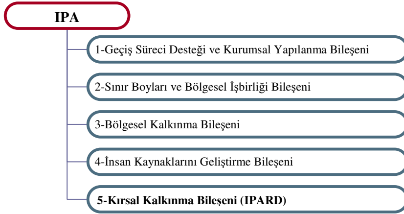
Grafik 2: IPA bileşenleri

IPA Fonunun kesinleşen 2007-2011 dönemi mali destek boyutuna ve bunun ülkelere göre dağılımına baktığımızda; en fazla payın Türkiye'ye ayrıldığını görmekteyiz (Tablo 1). Belirtilen dönem toplam mali desteklerin %46'sını ifade eden ve yıllık ortalama 600 milyon euro tutarındaki bu destek, ilk etapta olumlu bir izlenim verse de, gerek Türkiye'nin mevcut koşulları ve büyüklüğü, gerekse AB ile ilişkilerinin tarihsel boyutu bakımından çok büyük bir miktar değildir.