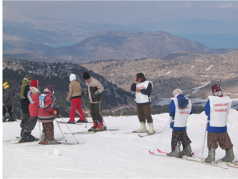
Fotoğraf 5 Çobanisa Köyü Kayak İhtisas Kulübü kayakçıları Davraz Dağı'ndaki bir çalışmada yerel giysilerle görülmektedir.