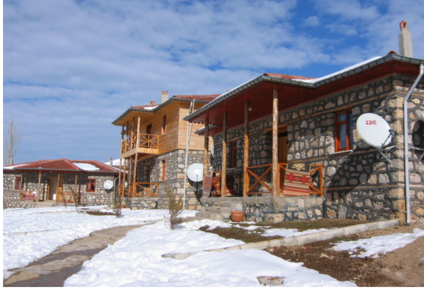
Fotoğraf 2. Restore edilerek turizme açılan Davraz dağ evlerinden bir görünüm. Dört eski köy evinden oluşan dağ evleri yörenin doğal ve mimarî özellikleri dikkate alınarak inşa edilmiştir.

Çobanisa köyünde turizm amaçlı ev pansiyonculuğunu geliştirmek amacıyla Kültür ve Turizm Bakanlığı ödeneği ve Isparta Valiliği öncülüğünde "Çobanisa Örnek Turizm Köyü Projesi" kapsamında dört eski köy evi restore edilerek 2006 yılı başında turizme açılmıştır(Fotoğraf 2).