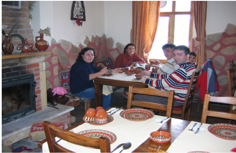
Fotoğraf 3. Davraz dağ evlerinden biri de restaurant olarak hazırlanmış olup iç düzenlemede yöresel özellikler dikkate alınmıştır.

Davraz dağ evleri, Isparta Valiliği Özel İdare Müdürlüğü ve köy muhtarlığının önerileri doğrultusunda yörenin mimari özellikleri dikkate alınarak inşa edilmiştir. İnşaatı 2005 yılı sonunda bitirilmiş olan dağ evleri 2006 yılı başında da turizme hizmet vermeye başlamıştır. Özel bir şirkete 10 yıllığına kiralanmış dağ evleri 12 oda ve 35 kişi kapasitesine sahiptir. Ayrıca köy muhtarının kişisel girişimleri sayesinde kendisine ait 7 odalı bir köy evi de (Davraz pansiyon) turizm amaçlı düzenlenmiştir.