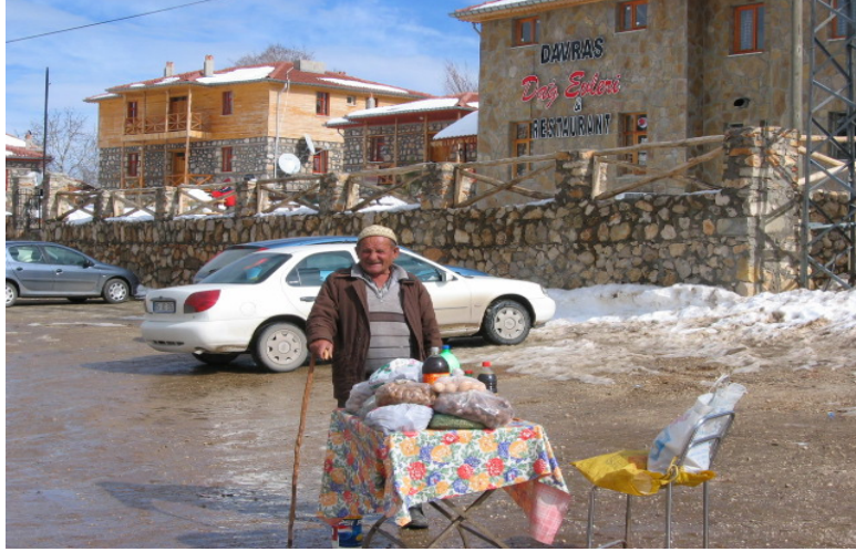
Fotoğraf 4 Köy halkı ceviz, yumurta, peynir, pekmez, süt, badem vb. köyde üretilen gıdaları, köy meydanında ve karayolu boyunca satışa sunmaktadır.

kurulmuş ve kulüp tümü köy çocuklarından oluşan 14 lisanslı sporcuya ulaşmıştır. Yerel ve bölgesel düzeydeki yarışmalarda dereceye giren sporcuları bulunan kulüp, çalışmalarını ve yarışmalara olan hazırlıklarını Davraz dağındaki kayak pistlerinde yapmaktadır(Fotoğraf 5).