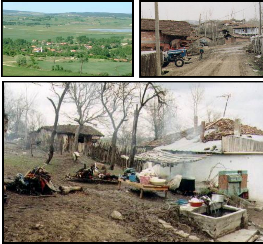
Foto 1. a ve b) Samsun'un Lâdik ilçesi Gölyazı köyü yaz ve kış manzarası, c) Köydeki genç kızların ilânihaye yaşamak istemedikleri gündelik işlerden bir örnek; kışın taşıma su ile dışarıda ve soğukta çamaşır yıkama faaliyeti.

Samsun'un Lâdik ilçesi Gölyazı köyünde ( Foto 1 ) yaşlı bir bayanın ifadelerinden tespit ettiğimiz ve “göç sarmalı” olarak adlandırdığımız süreç özet olarak şu şekilde gerçekleşmektedir.