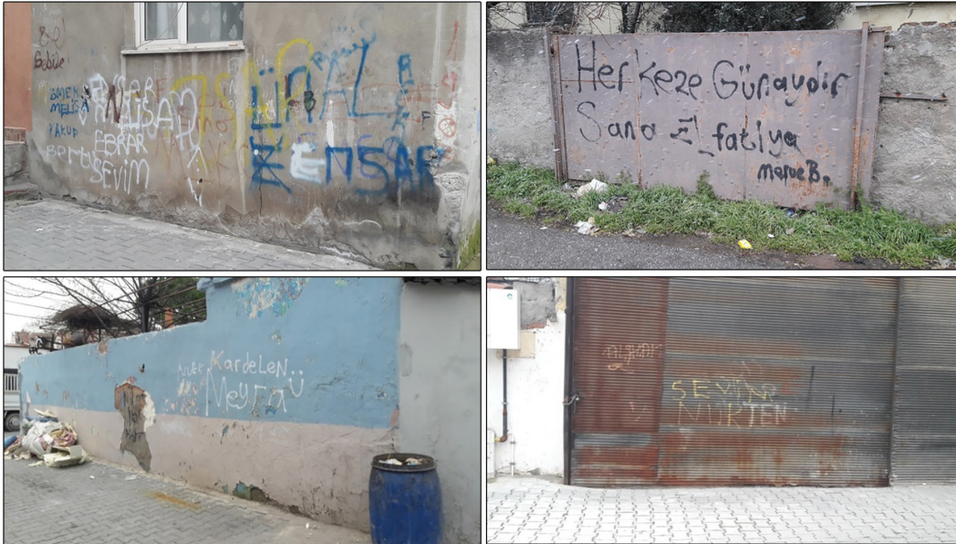
Fotoğraf 18. Gümüşçeşme mahallesinde duvar yazılarının yer aldığı çeşitli yüzeyler Photograph 18. Various surfaces with graffiti in Gümüşçeşme neighborhood

İki mahalle arasındaki bir diğer önemli fark her iki mahalle de