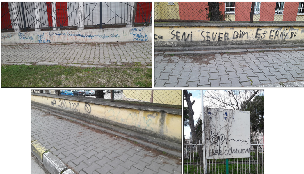
Fotoğraf 19. Bahçelievler mahallesinde duvar yazılarının yer aldığı çeşitli yüzeyler Photograph 19. Various surfaces with graffiti in Bahçelievler neighborhood