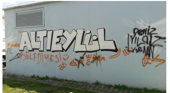
Fotoğraf 5. Bir grafitinin altına sıradan kent özneleri tarafından eklenen yazı Photograph 5. Text added by ordinary people under a graffiti

Bu pratikler yeniden graffitilerin iletişim ve varoluş biçimleri olduğunu göstermektedir. Bunlara verilebilecek birkaç örnek "Buse çok güzelsin" yazısının altına bir başkası tarafından eklenmiş "Biliyorum" cevabı (Fotoğraf 2), "Nike" yazısının altına başkası tarafından eklenmiş "GUCCI" marka adı (Fotoğraf 3), "B10" yazısının "ANTİBIOTİK" şeklinde dönüştürülmesi ve aynı duvarda yer alan "vermidon" yazısı (Fotoğraf 4), ALTIEYLÜL yazısının altına eklenen BELEDİYESİ yazısı (Fotoğraf 5) ile bir trafo yüzeyinde alt alta yazılan A.S. ve S.A. ifadeleri şeklinde sıralanabilir.