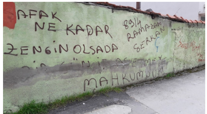
Fotoğraf 13. Askerlik söylemleri Photograph 13. Military discourses

Hegemonik erkeklik temsilleri "Hassas Olduğum Yerden Vurursanız Sağlam Olduğunuz Yerden S*****", "EY HAYAT SÖYLE NerDe Kalmıştık", "Gülüşümü Kaybettiğim Gün Zafer Sizindir", "Delikanlılar sizin VARYA" "Bışey DerdimDe Gece gece OLMU-