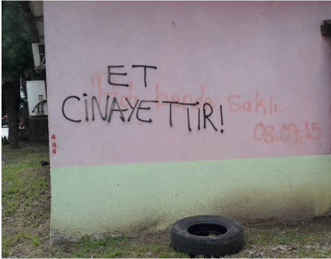
Fotoğraf 10. Bahçelievler mahallesi'nde bir slogan Photograph 10. A catchword in Bahçelievler neighborhood