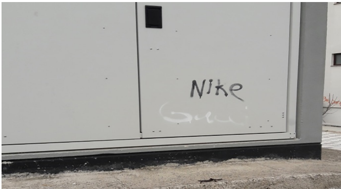
Fotoğraf 3. Bir marka ifadesinin altına başkası tarafından eklenmiş başka bir marka adı Photograph 3. A brand name that added by someone else under another brand name

Bahçelievler mahallesinde karşılıklı iletişim aracı olarak graffitiler, bazı yazılara başkaları tarafından verilen cevaplar (Fotoğraf 2), bazı markaların yanına başkaları tarafından başka marka adı eklenmesi (Fotoğraf 3), bazı graffitilerin anlamı değişecek şekilde, başkaları tarafından önüne ve sonuna eklemeler yaparak değiştirilmesi (Fotoğraf 4) ve bazılarının da tamamen karalanarak yok edilmesi şeklindedir.