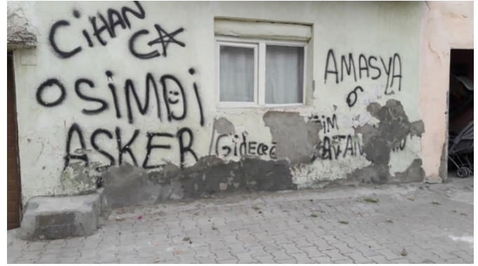
Fotoğraf 11. Askerlik söylemleri Photograph 11. Military discourses

Bu temsili oluşturan söylemler içerisinde en yaygın olanı askerlik kavramı ile ilgili söylemlerdir.