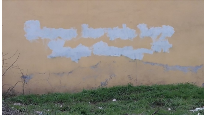
Fotoğraf 7. Üzeri tamamen karalanmış sözler Photograph 7. Words that have been completely scribbled on