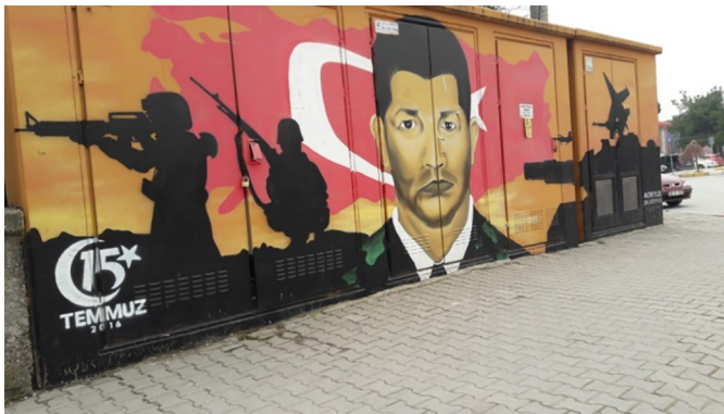
Fotoğraf 22. Bahçelievler mahallesinin girişindeki bir trafo yüzeyi Photograph 22. A transformer surface at the entrance of Bahçelievler neighborhood

Bahçelievler mahallesinde hiç karşımıza çıkmayıp Gümüşçeşme mahallesinde çok yaygın bir tema olarak ayırt ettiğimiz askerlik olgusu, askerliğin yoksul insanlar için önemli olduğunu göstermektedir. Ülkede yaşayan herkes için vatani bir görev iken orta üst sınıftan bireyler çeşitli ekonomik bedeller karşılı-