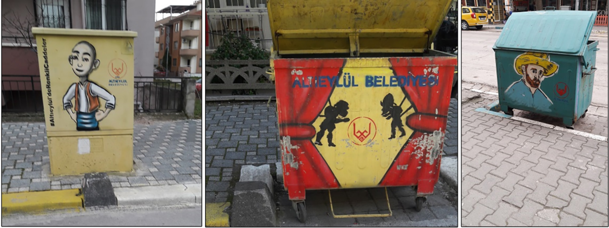
Fotoğraf 21 a,b ve c. Bahçelievler mahallesinde yer alan bazı çöp kutuları ve trafo Photograph 21 a, b and c. Some trash cans and a transformer in Bahçelievler neighborhood

aynı ilçe belediyesinin (Alteylül) sınırlarında olmasına rağmen Bahçelievler mahallesinde sokak sanatı olarak tanımlayabileceğimiz çeşitli renkli sprej boyalar ile resmedilen yüzeyler oldukça yaygın iken (toplam 23 yüzey, ör: Fotoğraf 20 ve 21) Gümüşçeşme mahallesinde böyle bir yüzeye yalnızca iki yerde 7 rastlanmıştır. Bu bağlamda Bahçelievler, sokakların çeşitli şekillerde renklendirildiği bir mahalle olurken Gümüşçeşme Mahallesi renksiz kalmıştır. İki mahalle arasındaki bu fark eşitsizliğe dair başka bir işarettir. Böylece Bahçelievler mahallesinde sokaklar renklendirilirken bazı yerlerde çeşitli duvar yazılarını yok etmekte (Fotoğraf 8), kimi zaman da ideolojik bir araca dönüşmektedir.