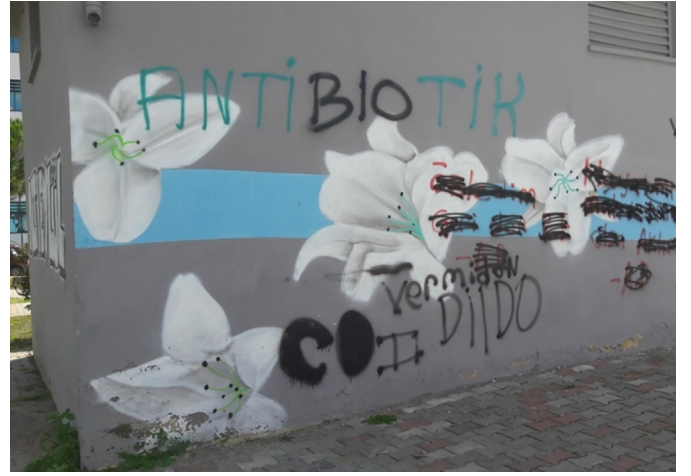
Fotoğraf 4. Dönüştürülen grafiti örnekleri Photograph 4. Graffiti as way of communication

Bu pratikler yeniden graffitilerin iletişim ve varoluş biçimleri olduğunu göstermektedir. Bunlara verilebilecek birkaç örnek "Buse çok güzelsin" yazısının altına bir başkası tarafından eklenmiş "Biliyorum" cevabı (Fotoğraf 2), "Nike" yazısının altına başkası tarafından eklenmiş "GUCCI" marka adı (Fotoğraf 3), "B10" yazısının "ANTİBIOTİK" şeklinde dönüştürülmesi ve aynı duvarda yer alan "vermidon" yazısı (Fotoğraf 4), ALTIEYLÜL yazısının altına eklenen BELEDİYESİ yazısı (Fotoğraf 5) ile bir trafo yüzeyinde alt alta yazılan A.S. ve S.A. ifadeleri şeklinde sıralanabilir.