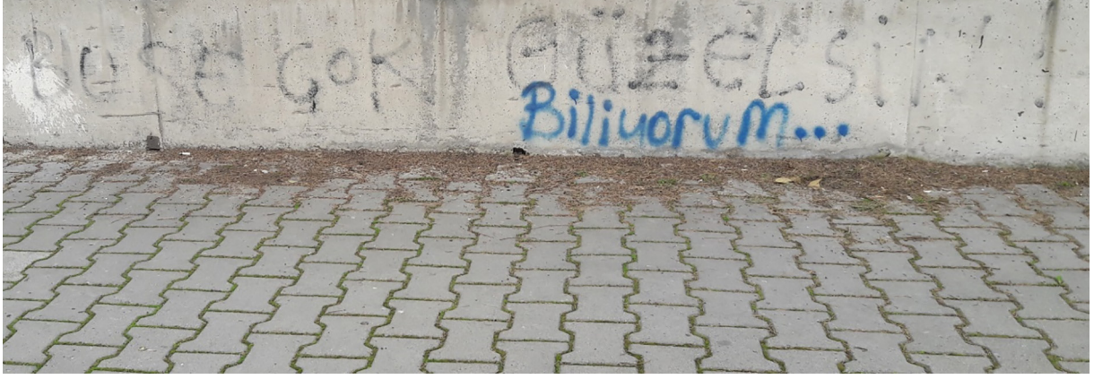
Fotoğraf 2. İletişim biçimi olarak graffitiler Photograph 2. Graffiti as way of communication