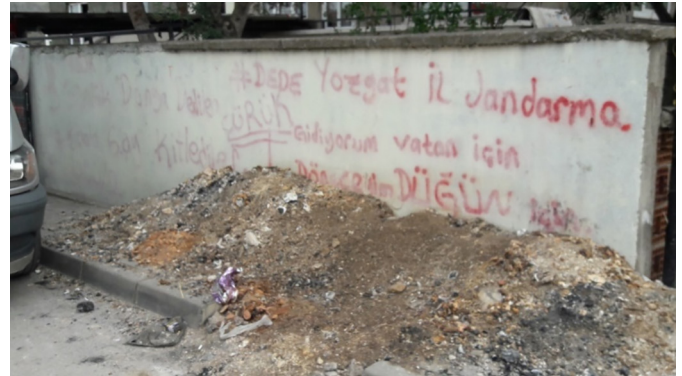
Fotoğraf 12. Askerlik söylemleri Photograph 12. Military discourses

Askerlik ile ilgili gösterimlerden biri olan sayı/sayı gösterimi (86/1, 91/1 gibi) 5 çalışma sahasında çok yaygındır. Buna ek olarak 5 yerde karşımıza çıkan "O şimdi asker" ifadesi, "Hayata 12 ay mola 95/2", "Cihan (ay yıldız) O şimdi asker" "Gideceğim vatan için" "Amasya", "99/4 Kütahya, ay-yıldız gösterimi ile "Yozgat il Jandarma, Hayata 1 sene mola 365" ve yanında ay yıldız gösterimi gibi askerlik ile ilişkili temsiller ; "O şimdi", "KIZLAR ASKER OLSA Mini Etek Moda Olsa Eller Tüfek Tutsa", "Gidiyorum vatan için döncem düğün için", "#dede Yozgat il jandarma", "Şafak ne kadar zengin olsa da bir gün iflas etmeye mahkûmdur!.. 89/4 Ramazan Serkan", "Peder" ve yanında tüfek işareti ve "Çürük" gibi temsiller bu gruptadır.