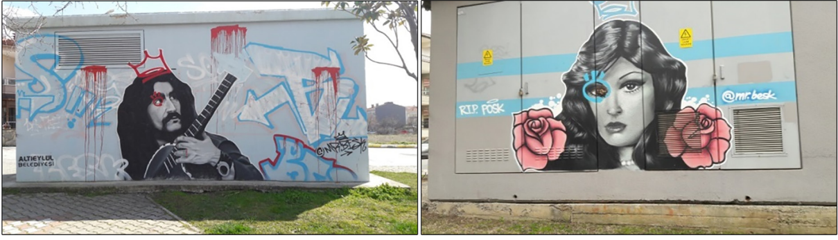
Fotoğraf 20 a ve b. Bahçelievler mahallesinde yer alan bazı trafo yüzeyleri Photograph 20 a and b. Some transformers in Bahçelievler neighborhood