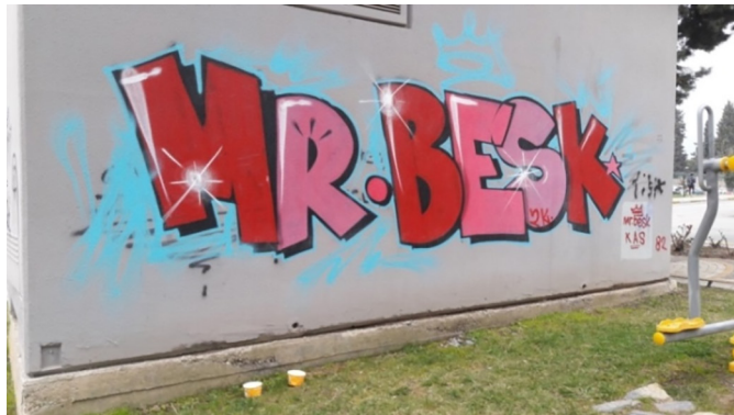
Fotoğraf 8. Altında kalan çizgileri yok eden bir graffiti Photograph 8. A graffiti that be in the clear the lines underneath