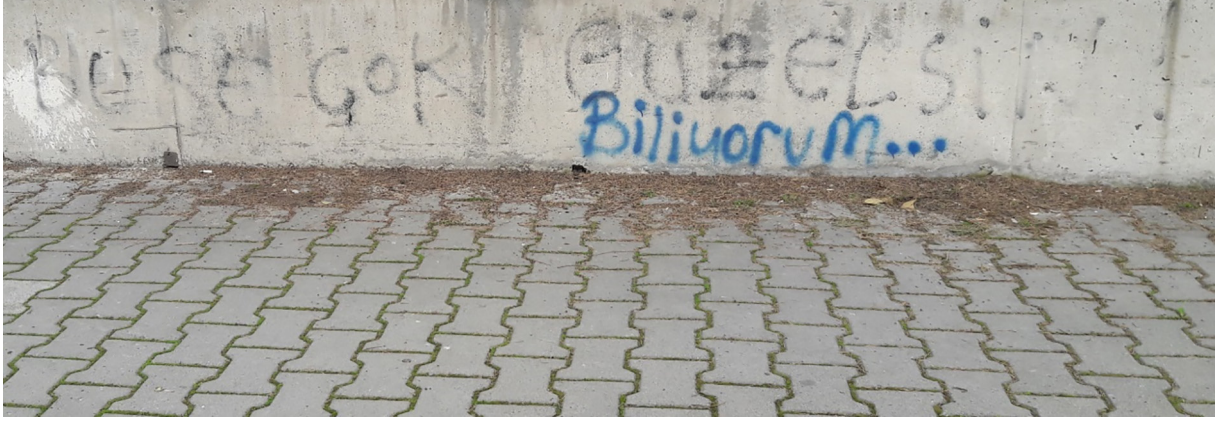
Fotoğraf 6. Üzeri karalanmış sözler Photograph 6. Words scribbled on

biçimi olduğunu göstermektedir. Mevcut bir ifadenin kentsel mekândaki varoluşunu istemeyen başkaları, mevcut graffitileri anlamını yok edecek şekilde, üzerine başka çizgiler çizerek değiştirmekte-yok etmektedirler. Söz konusu mekânsal pratik özellikle ideolojik ifadelerde karşımıza çıkmıştır. Bunun yanı sıra duvar yazılarının tamamen yok olacak şekilde üstünün karalanması da bir diğer yok etme biçimidir (Bunlardan bazıları Fotoğraf 6, 7 ve 8).