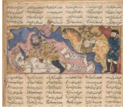
Resim 3: Rüstem'in Ak Devi Öldürmesi, Firdevsî Şehnâme , 1300-30, Bağdat, New York Metropolitan Art Museum, No. 69.74.7.