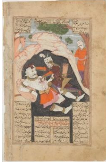
Resim 11: Rüstem'in Akdev'i Öldürmesi, Şehnâme Tercümesi , 1666-67, İsfahan, New York Metropolitan Art Museum, No. 1975.192.25, y. 131b

Kaynak:( https://www.metmuseum.org/art/collection/search/452766?sortBy=Relevance&mp:ft=Abu%271+Qasim+Firdausi&offset )