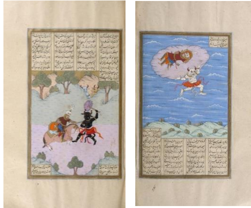
Resim 18-19: Rüstem'in Ekvan Dev ile Mücadelesi, Şehnâme Tercümesi, Şerif Amidi, 1616-20, İstanbul, The New York Public Library, Sepencer Coll. Turk. MS. 1, y. 61a–62b