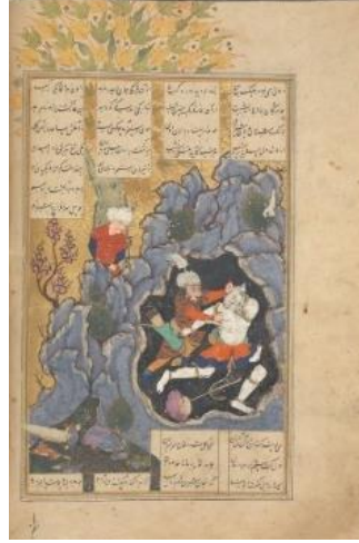
Resim 12: Rüstem'in Akdev'i Öldürmesi, Şehnâme Tercümesi , 17.yy, Isfahan, New York Metropolitan Art Museum, No. 1974.290.43, y. 77b

Kaynak:( https://www.metmuseum.org/art/collection/search/446546?sortBy=Relevance&mp:ft=Abu%271+Qasim+Firdausi&offset )