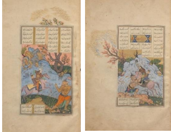
Resim 16-17: Rüstem'in Ekvan Dev ile Mücadelesi, Firdevsî Şehnâme , 1606-07, The Metropolitan Art Museum No. 13.228.16 y. 76a – 78a

Kaynak: ( https://www.metmuseum.org/art/collection/search/446550 )