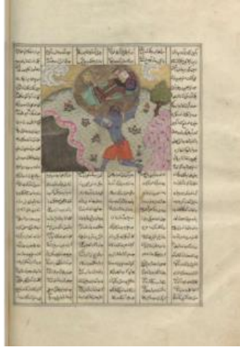
Resim 13: Rüstem'in Dev Ekvan'ı Mücadelesi, Firdevsî Şehnâme , 14.yy Deutsche Staatsbibliothek, Ms. Orient Fol. 4255, y. 109b.