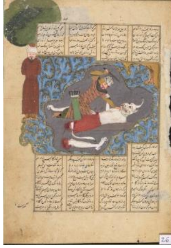
Resim 6: Rüstem'in Ak Devi Öldürmesi, Firdevsî Şehnâmesi , 1420-40, Bodleian Library MS. Ouseley Add. 176, y. 71a.