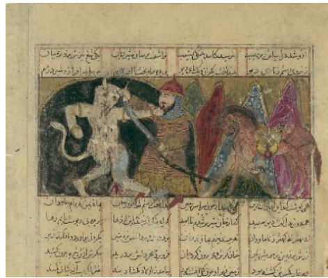
Resim 4: Rüstem'in Ak Devi Öldürmesi, Firdevsî Şehnâme , 1330-40, İsfahan, New York Metropolitan Art Museum, No. 1974.290.7, y. 51b

New York Metropolitan Müzesi No. 1974.290.7'de yer alan ve İsfahan'da 1330-1340 tarihleri arasında üretilmiş olan tasvir ise (Resim 4), üstte dört sütun ve iki satır ile altta dört sütun ve on altı satırdan oluşan metnin altına uygulanmıştır. Altın yıldız gökyüzü altında, renkli dağların yanında, Rüstem ile Akdev'in mücadeleye yeni başladığı, henüz devin kolu ve bacağı kesilmediği sahne canlandırılmıştır. Ayrıca Ulat tasvirine burada yer verilmemiştir. Olayın geçtiği mağaranın rengi de diğer örnekten farklı olarak siyah betimlenmiştir.