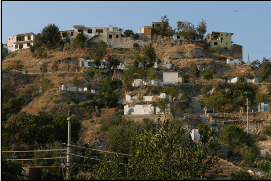
Foto 2. Bağırsak Deresi Civarında Yıkım İçin Boşaltılan Gecekondular.

Denizli'nin kuzeydoğusunda Ankara karayolu üzerinde bulunan Sevindik (Foto 1), Dokuzkavaklar, Karşıyaka mahalleleri ile Fatih, Esentepe, Bakırlı mahalleleri ve Eskihisar çevresinde yapılan konutlar, genellikle tek ya da birkaç katlıdır. Bu kesimlerde konut yapanların çoğunluğu alt gelir gruplarına mensup insanlardan oluştuğundan konutların bir kısmı kaçak ve plansız yapılmıştır. Görüntü kirliliğine yol açan ve modern şehirlere hiç yakışmayan bu gecekondular (Foto 2 ve 3) Denizli şehrinin en önemli sorunlarının başında gelmektedir.