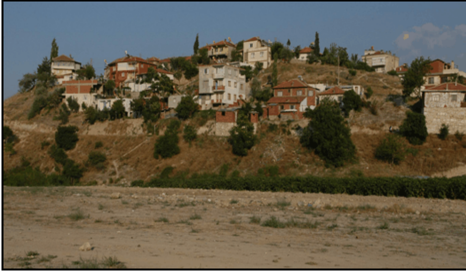
Foto 1. Sevindik Senti Kuzeyinde Dere Yatağı Kenarında Tepelerdeki Gecekondu.

Gecekondu, adının ifade ettiği gibi genellikle kaçak ve izinsiz, yerel yönetimlere haber verilmeden gizlice ve hızlı şekilde inşa edilen basit ve düzensiz yapıları ifade ederler. Ancak günümüzde ruhsatı, tapusu olmadan yapılmış ve inşaatı aylarca devam etmiş çok katlı kaçak yapılar bile bulunmaktadır. Şehre yeni göç eden aileler genellikle önceden tanıdıkları hemşerilerinin buldukları mahallelere gelmekte ve onların da yardımları ile o bölgede yerleşmeye ve kira ödemeden başlarını sokabilecekleri basit bir konut yaparak oturmaya başlamaktadır. Böylece şehrin kenar mahallelerinde kent kültüründen kopuk, kente tamamen yabancı insanlar yaşamaya başlamaktadır. Zaman içerisinde ne köye ne de şehre ayak uyduramayan insanların yaşadığı bu bölgelerde sosyal çatışmalar çıkabilmekte ve çeşitli suçların oranlarında artışlar meydana gelebilmektedir.