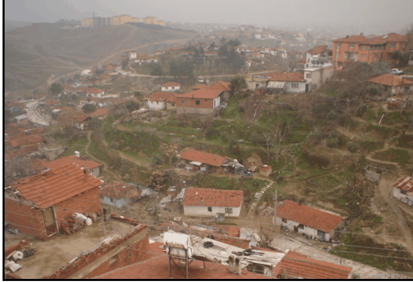
Foto 3. Denizli’de Aktepe ve Bağırsak Deresi Civarındaki Gecekondulardan Bir Görünüm.