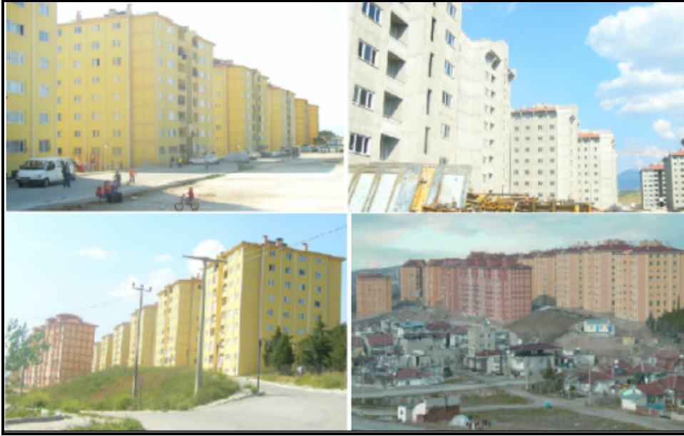
Foto 5. Aktepe Bölgesinde Gecekondü Dönüşüm Projesi Kapsamında Toki Tarafından Tamamlanan ve İnşaatı Devam Eden Toplu Konutlar.

Aynı bölgede Kurudere’de 1.500 konutluk Akevler ve Bağırsak deresi bölgesinde 1.500 konutluk Karşıyaka evleri olmak üzere 3.000 konutluk yeni bir gecekondü dönüşüm projesine başlanmıştır. Kısa sürede tamamlanması düşünülen bu proje bitirilebildiği zaman, bölgede 5.000’e yakın konut yapılmış ve gecekonduların büyük bölümü kentsel dönüşüm kapsamında yıkılmış olacaktır. Böylece hane halkı ortalaması 3,9 kişi olan Denizli’de yeni toplu konutların yapılması 20 bin kişiden fazla bir nüfusun gecekondulardan kurtulması anlamına gelmektedir. Hatta bu semtlerimizde Doğu ve Güneydoğu Anadolu bölgelerindeki illerden göç edenlerin yoğun olduğu ve hane halkı ortalamasının da 3,9 kişiden çok daha fazla olduğu düşünülürse 30 bin kişinin üzerinde bir nüfusun gecekondü ortamından kurtulacağı söylenebilir.