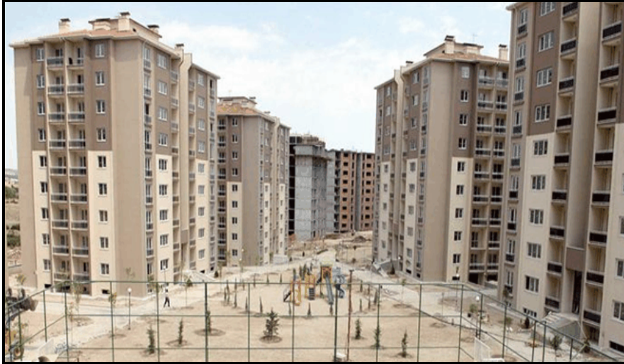
Foto 4. Denizli Belediyesi Tarafından Yapıtılan 800.Yıl Konutları.

Kuzeydoğuda Karşıyaka ve Dokuzkavaklar mahallelerinin dış kenar bölgeleri genellikle gecekonduardan oluşmaktadır. Bu bölge Toplu Konut İdaresi Başkanlığı (Toki) nın toplu konut yaptığı bir uygulama sahasıdır. Toki, son yıllarda Türkiye’de konut açığının giderilmesi ve planlı toplu konut alanlarının ortaya çıkmasına büyük katkı yapmıştır. Türkiye’nin her bölgesinde alt, orta ve üst gelir guruplarına göre konutlar inşa etmektedir. Bu konutlar etaplar şeklinde ve içerisinde okul, sağlık ocağı, cami, alışveriş merkezleri gibi sosyal donatılarıyla birlikte her türlü ihtiyaca cevap verecek şekilde inşa edilmektedir. Yeşil alan ve parklara da ayrıca önem verilmektedir. Denizli şehrinde de benzer faaliyetlere girişilmiştir. Denizli’de kentsel dönüşüm projesi kapsamında düşünülen konutların tamamı Toplu Konut İdaresi Başkanlığı tarafından inşa edilmektedir.