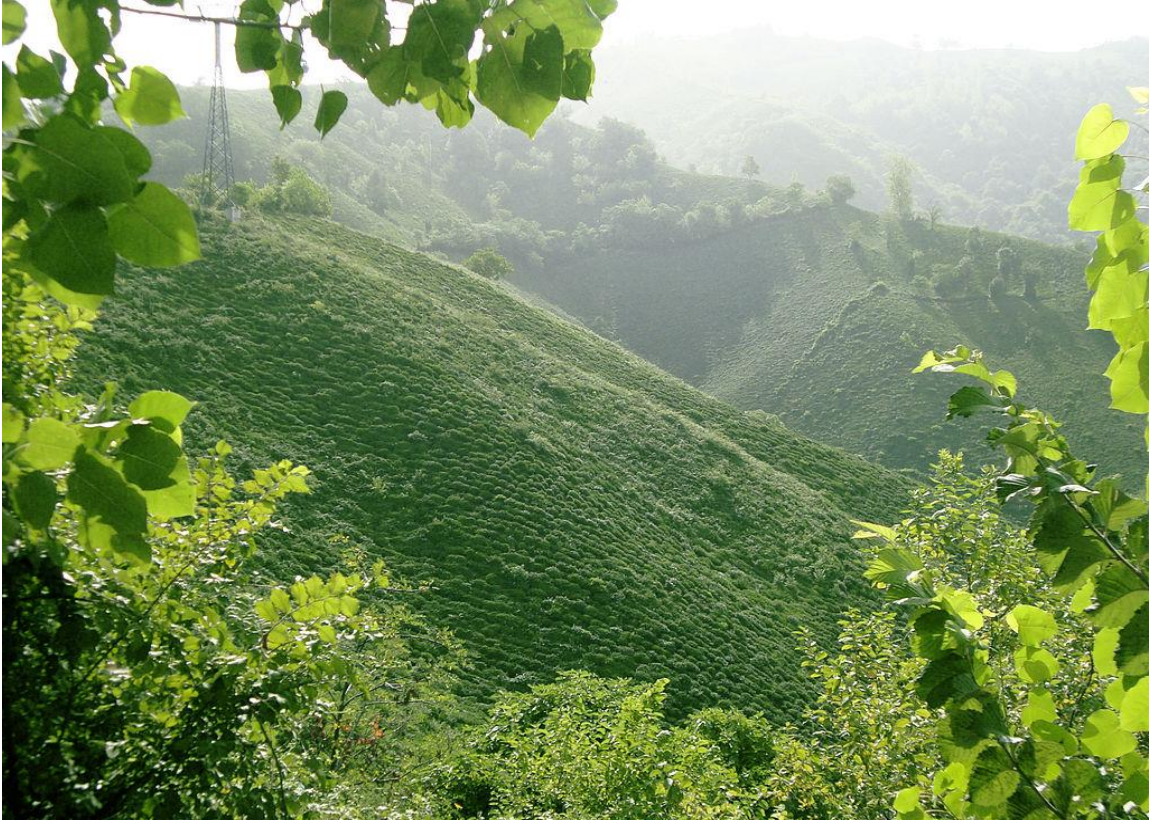
EK-4 Taberistan'ın ormanlık alanlarından bir fotoğraf.