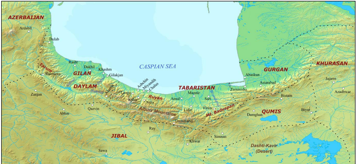
EK-2 Wikipedia'dan alınan Taberistan ve komşu bölgelerine ait harita. (Kaynak: Wikipedia, https://en.wikipedia.org/wiki/Tabaristan , Erişim Tarihi 29/09/2022)