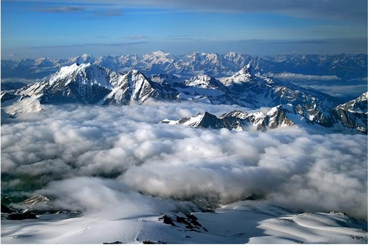
EK-3 Taberistan'ı çevreleyen çetin ve zorlu Elburz dağ silsilesinin kışın çekilen bir fotoğrafı.