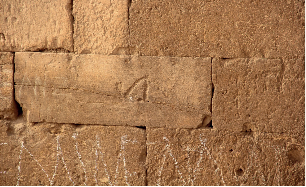
Fotoğraf 7: Harran Ulu Camii Kemerli Salur Boyu Damgası