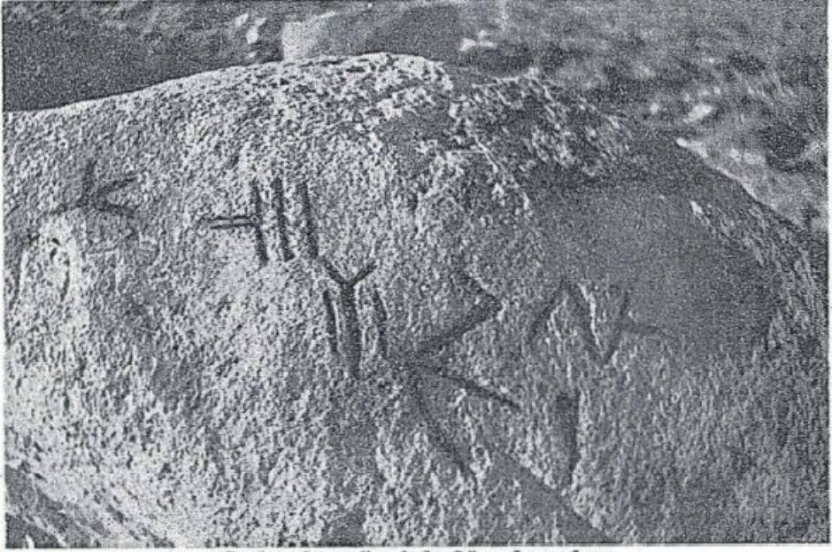
Çaytaşı kaya üzerinde Oğuz damgaları