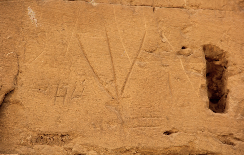
Fotoğraf 8: Harran Ulu Camii Kemerli Orhun Harfi/Kazayağı Damgası