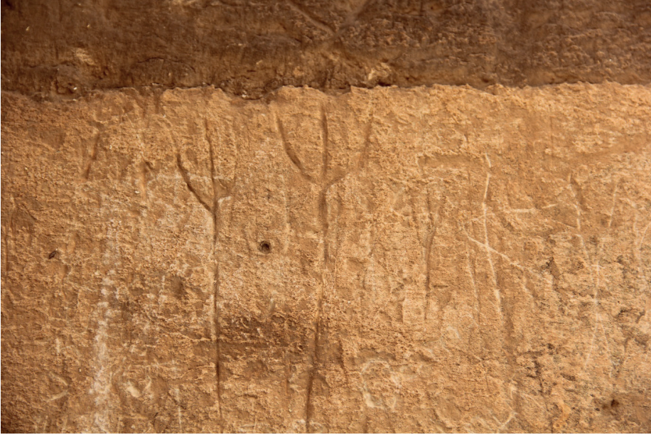
Fotoğraf 10: Harran Ulu Camii Kemerli Türk Damgaları