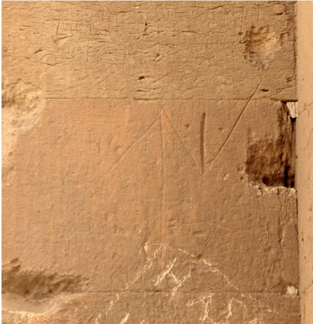
Fotoğraf 11: Harran Ulu Camii Kemerli Türk Damgası