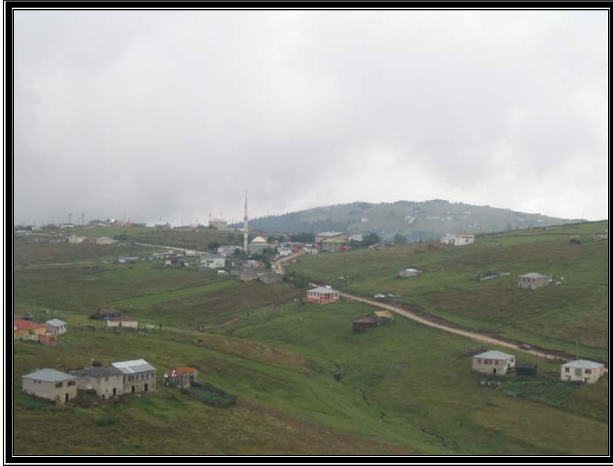
Fotoğraf 1. Yaylanın merkezi durumda olan Handobez Obasının bir bölümü.