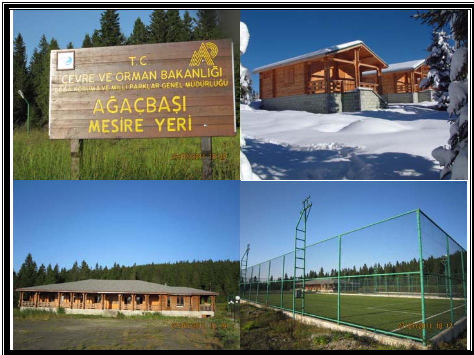
Fotoğraf 5. Tesislerde bungalov ev, spor sahaları ve restoran görünümleri.

Yaylakent 2003 yılında bitirilmiş olup, 2006 yılında Türkiye Kızılay Derneğine 5 yıllığına kiraya verilmiştir. Kızılay tarafından çevre düzenlemesi yapılarak, Yaz Kampı olarak kullanılmıştır. 2009 yılında Trabzonspor ile yapılan bir protokol ile tesis bu kulübe devredilmiştir. Bu devirden amaç, öncelikle yerel olmak üzere sporcuların burada kamp yapmaları ve sezona hazırlanmalarının sağlanması idi. Fakat Trabzonspor, çok kısa bir süre sonra yapılan anlaşmayı bozarak bu tesisi kiralamaktan vazgeçmiştir.