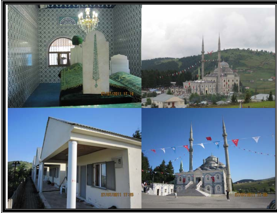
Fotoğraf 2: Haçkalı Hoca Baba Camii ve Türbesi ve Apartlara ait görünüm

yerel gazetelere verilen ilanlarla tanıtım yapılmaktadır. Anma programı camii avlusundaki açık alanda ve camii içerisinde düzenlenmekte, protokol konuşmaları ve semazen gösterileri yapılmakta; ulusal tasavvuf musikisi sanatçıları ve mehteran takımı konser vermektedir. Haçkalı Babanın manevi olarak saygı duyulan ve sevilen bir din alimi olması dolayısıyla, programlara çok yoğun katılım gerçekleşmektedir (Fotoğraf 3). Başta Trabzon ve çevre iller olmak üzere, İstanbul, Ankara, Bursa, Kocaeli gibi şehirlerinden daha çok Karadenizliler ile yurt dışında yaşayan gurbetçiler bu programa iştirak etmektedir. 2011 yılında 16.sı düzenlenen törenlere katılanların sayısı belediye yetkililerinden alınan bilgiye göre yaklaşık 10 bini bulmuştur.