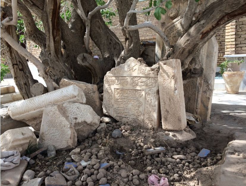
Ek 4. Kâşgarî'nin kabri olduğunu düşündüğümüz kısma yığılmış kırık mezar taşları. Lârî'nin mezar taşı da muhtemelen burada veya civardaki diğer kırık mezar taşlarının arasındadır.