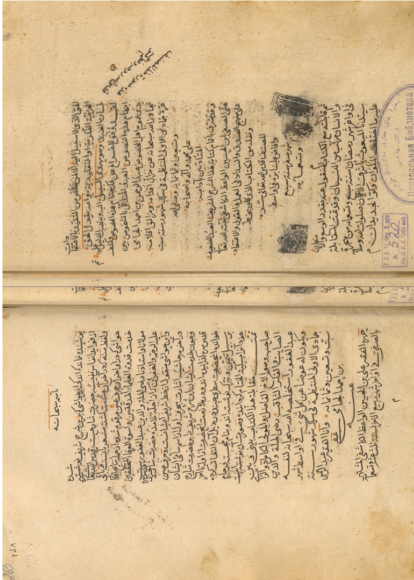
Ek 6. Ali Safi'nin nüshasının ferağ kaydı ve Abdülgafür-i Lârî'nin hâşiyeleri ile ilgili notu.