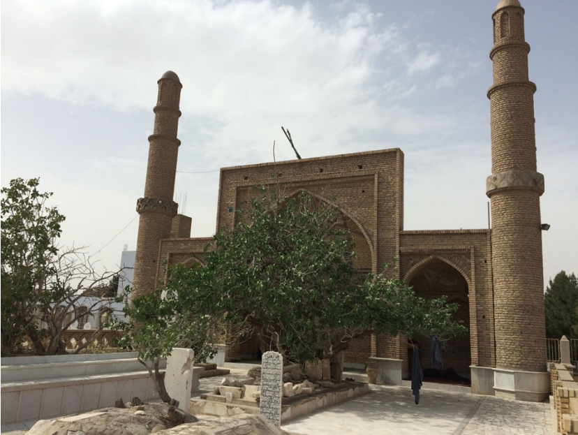
Ek 2. Kabirlerin bulunduğu iç kısım. En soldaki uzun mermerli kısım Câmi'nin kabridir. Onun sağındaki ağacın olduğu kısım da muhtemelen Câmi'nin müridi Sâdeddîn-i Kâşgarî'nin (ö. 860/1456) kabridir.