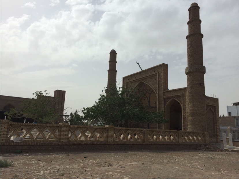
Ek 1. Câmi'nin ve Lârî'nin mezarlarının bulunduğu yapının dışarıdan görüntüsü.