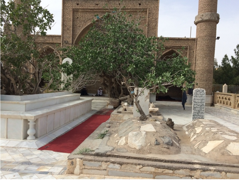
Ek 3. Lârî, Câmî'nin ayak ucuna defnedilmiştir. Burası muhtemelen mermer kısmın bittiği yerdir. Ancak bugün onun kabrinden eser bulunmamaktadır.