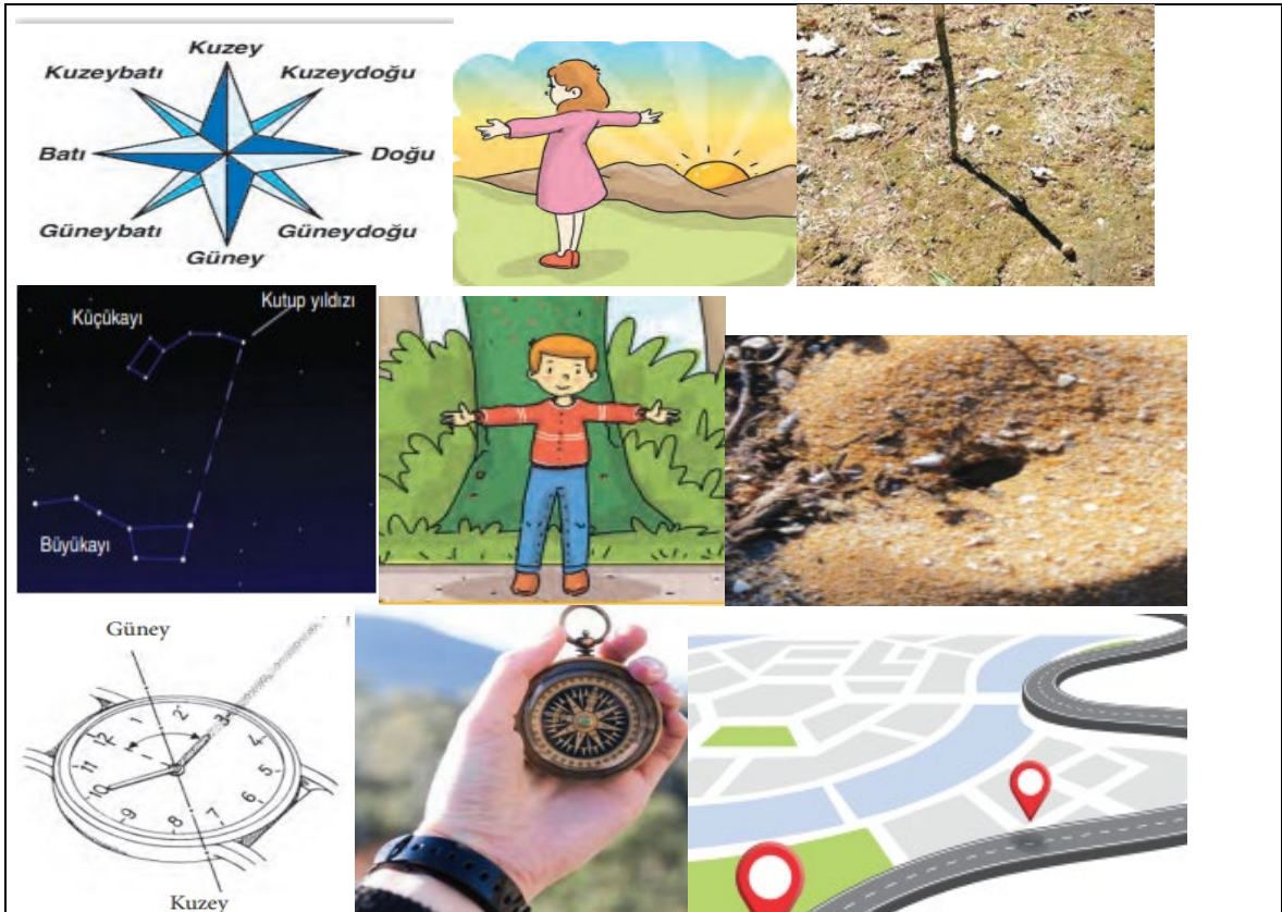
Tablo 1: Sosyal Bilgiler 4 Ders Kitabında Coğrafi Konum ile İlgili Görseller

Ders kitabının değerlendirilmesi sonrasında “Yaşadığımız Yer” ünitesinde coğrafi konum kavramı ile ilgili 11 görsele rastlanmıştır. Bu görsellerden bir kısmı Tablo 1’de belirtilmiştir.