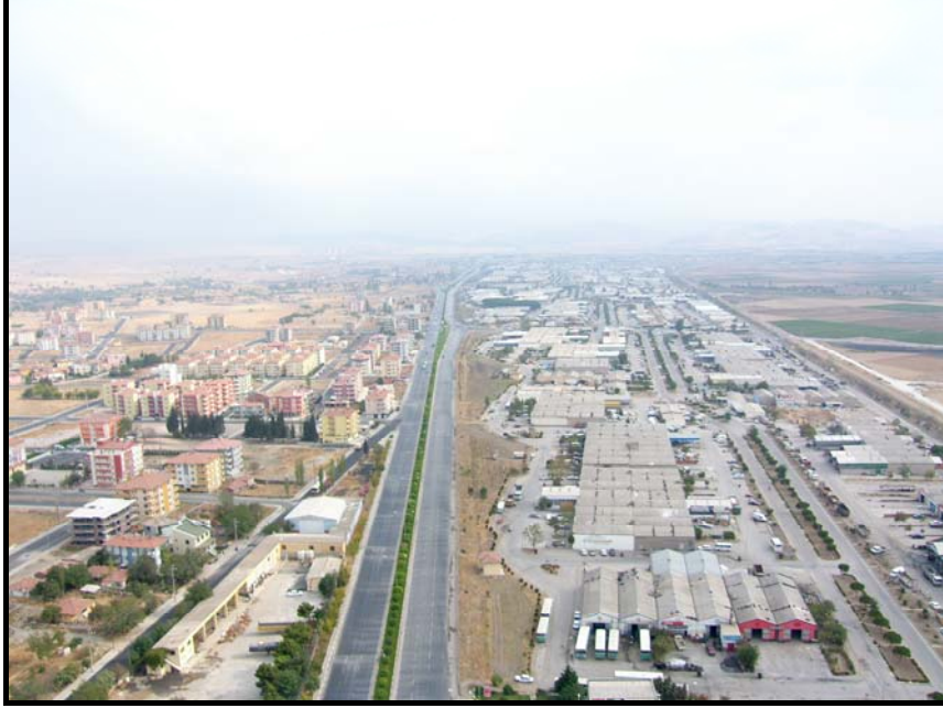
Fotoğraf 4. Balıkesir-Bursa Yolundan Bir Görünüm. Solda Paşaalı Mahallesi, Sağda Küçük Sanayi Sitesi

Matematik adlandırma cadde ve bulvar adlandırmasının bir başka şeklidir. İsimsiz caddeler olarak da nitelenen bu tür caddelere daha çok büyük şehirlerin yeni gelişen kenar alanlarında rastlanmaktadır. Büyük olmayan şehirlerde organize sanayi bölgeleri bu tür isimsiz caddelere rastlanan başka yerlerdir. Matematik veya sayısal adlandırma, Lise Caddesi I, Lise Caddesi II (Denizli) örneğinde olduğu gibi, aynı adın ikinci kez kullanıldığı durumlarda sıklık belirtmek için de kullanılmaktadır. Kuşkusuz çok sayıda sokağı adlandırmak zaman almakta veya bu tür sokaklar sayısal adlandırma ile günlük hayata kolaylık sağlamaktadır. Ancak “Kent dokusunun istikrarlı bir hale geldiğinin ve bir biçimlenme süreci yaşadığının göstergelerinden biri, isimsiz bir yoldan isim verilmiş bir yola geçiş” (Pérouse 2011: 40) olduğu düşünülürse Balıkesir’de 1980’li yıllarda kurulmuş bir mahalle olan Adnan Menderes’te sayısal adlandırmanın mevcudiyeti düşündürücüdür. Oysa mahallede bulunan caddelere daha önce isim verilmiş, sonra bundan vazgeçilmiştir. Şehirde Küçük Sanayi Sitesi’nde bile isimsiz caddelere rastlanmaz. Bu alanda mevcut üç caddeden birinin adı Cumhuriyettir. 12 Ekim ve 19 Ağustos caddeleri sanayi sitesinin inşaa ve hizmete alınış zamanlarıyla ilgilidir. Yeni Mahalle (TOKİ) de bu durumun ortaya çıkışı mahallenin kuruluş tarihinin yeni oluşu ile ilgilidir.