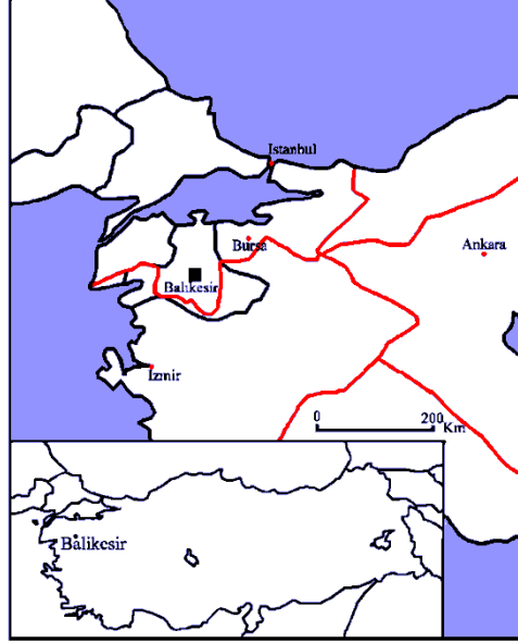
Şekil 1. Çalışma alanı lokasyon haritası

Çalışma giriş bölümü dikkate alınmazsa, üç bölümden oluşmaktadır. İlgili kaynaklar ile cadde adları konusunda yurt içinde ve yurt dışında yapılan çalışmalar verilmektedir. Yurt dışı çalışmaları, cadde adlandırmanın arka planındaki politik süreçleri anlama üzerine kurulmuştur. Türkiye'de yapılan birkaç çalışma da benzer özelliklere sahiptir. Bu çalışma konuya bütüncül bir yaklaşım getirmekle diğer çalışmalardan ayrılmaktadır. Kavramsal çerçeve ve yöntem ikinci bölümde ele alınmaktadır. Bu bölümde çalışmada kullanılan yaklaşım ve yöntemin tanımlanması yapılmakta ve veri kaynakları belirtilmektedir. Balıkesir şehrinde cadde adları başlıklı bölümde, cadde adlandırmasını etkileyen nedenler, Aliagaoglu ve Uzun tipolojine (2011) göre analiz edilmektedir. Çalışma makeden elde edilen sonuçların özetlenmesi ve bazı genellemelerle son bulmaktadır.