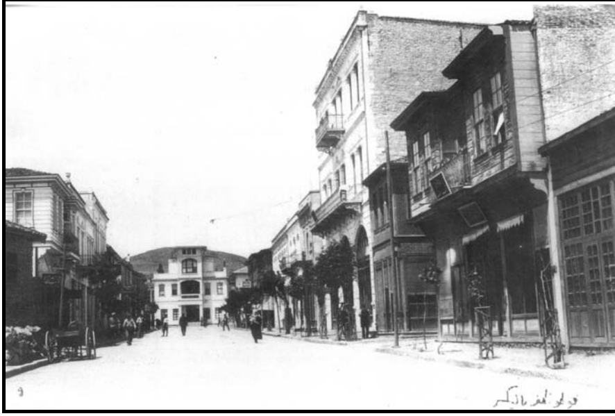
Fotoğraf 1. Cumhuriyetin İlk Yıllarında Milli Kuvvetler Caddesi

(Cumhuriyetin önemli şahısları) önemli zaferleri (Zafer Caddeleri) ve günleri (Kurtuluş günü Caddeleri) de içine almaktadır. Balıkesir şehri ulus devlet olma sürecinde önemli bir yerleşmedir. Çünkü Yunanlıların 15 Mayıs 1919'da İzmir'i işgalinden bir gün sonra Balıkesir ileri gelenleri, ilk önce "Okuma Yurdu'nda" daha sonrada "Alaca Mescit'te" toplanarak işgale karşı silahlı mücadele kararı verdiler. Böylece Balıkesir, Anadolu'yu müdafaa hususunda diğer vilayetlere ön ayak olmak şerefine layık oldu. Bu açıdan bakılınca, şehirde Cumhuriyet caddeleri olarak nitelenebilecek çok sayıda cadde olması şaşırtıcı değildir. Cumhuriyet, Milli Kuvvetler, Gazi, Kazım Karabekir, Fevzi Çakmak, Mehmet Akif Ersoy, Ali Çetinkaya, Vehbi Bolak, Mustafa Necati, Anafartalar, Sakarya ve 6 Eylül, Hürriyet ve Mehmetçik adları, şehirler bir metne benzetilirse, şehirsel metnin ana başlıkları konumunda bulunurlar. Özellikle Milli Kuvvetler ve Anafartalar caddeleri (Fotoğraf 1 ve 2) ile Gazi Bulvarı'nın (Fotoğraf 3), şehir merkezinde önemli kentsel işlevleri üstlenmesi bu düşünceyi daha da güçlü kılmaktadır.