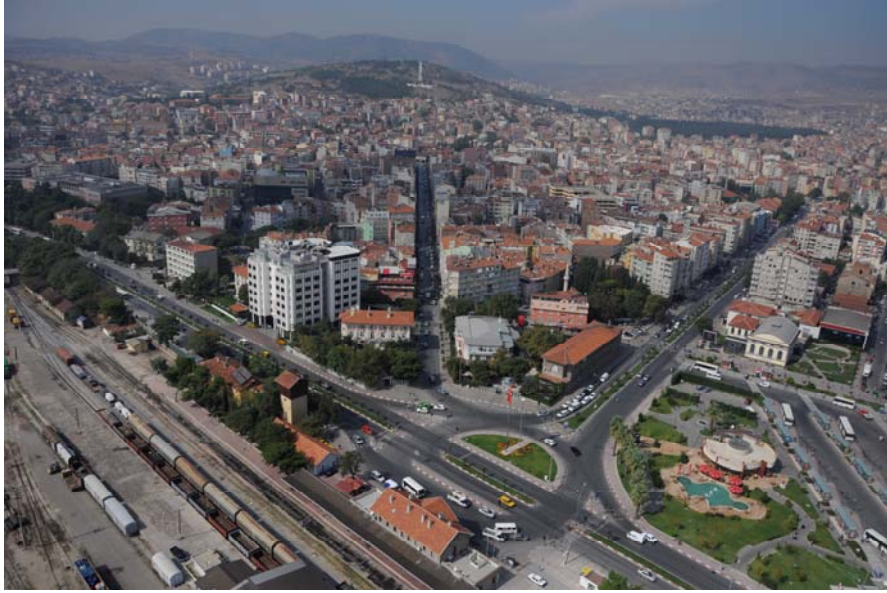
Fotoğraf 3. Gazi Bulvarı’ndan Bir Görünüm (sağda)

için olmasa bile dostluk-kardeşlik caddelerinin amacını ortaya koymaktadır. Trakya şehirlerimizde sıkça rastlanan Selanik, Filibe, Tırnova gibi Batı Trakya şehir adları Balıkesir’de yoktur. Oysa şehir, Osmanlı İmparatorluğunun çöküş döneminden başlayarak, değişik yıllarda farklı yoğunlukta olmak üzere, Balkanlardan Anadolu’ya yönelen göçlerin odak noktası konumundadır. Nitekim şehre, Lozan Antlaşmasından sonra 1453 göçmen gelmişken, 1950-1952 yılları arasında Bulgaristan’dan 2828 kişi, 1934-1968 yılları arasında çeşitli ülkelerden 1438 kişi, 1968 yılında ise 638 göçmen olarak yerleşmiştir (Durmaz 1995).