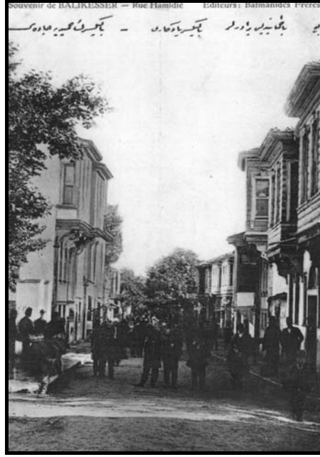
Fotoğraf 2. Cumhuriyetin İlk Yıllarında Anafartalar Caddesi

geçince bütün isimleri silmişler; akıllarına bu caminin ismini silmek gelmemiştir. Bu caminin olduğu yere de "Enver Paşa Caddesi" ismini vermişler fakat bu ismi de sonradan değiştirmişlerdir (Ayhan 2012). Cadde zaman içinde hükümet konağının bu alanda varlığına bağlı olarak önce Hükümet Caddesi olarak adlandırılmış, sonra bu ad Anafartalar Caddesi olarak değiştirilmiştir.