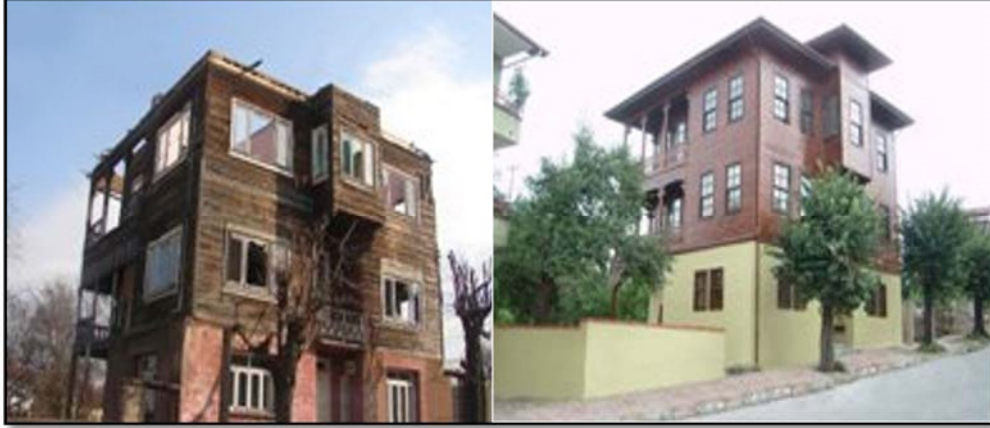
Fotoğraf 3. Bartın’da geleneksel bir evin restorasyon öncesi ve sonrası görünümü.