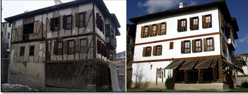
Fotoğraf 1. Bir Safranbolu evinin restorasyon öncesi ve sonrası görünümü.

problem de iki üç katlı tarihi evlerde yaşayan vatandaşların restorasyon sonunda TOKİ'nin yapmış olduğu 75, 85, 112 ve 137 m 2 'lik evlerde yaşamaya mecbur kalmalarıdır (Fotoğraf 4).