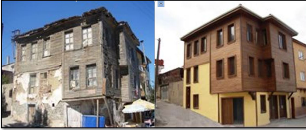
Fotoğraf 2. Bursa'nın Mudanya ilçesine bağlı Zeytinbağı beldesindeki bir geleneksel evin restorasyon öncesi ve sonrası görünümü.