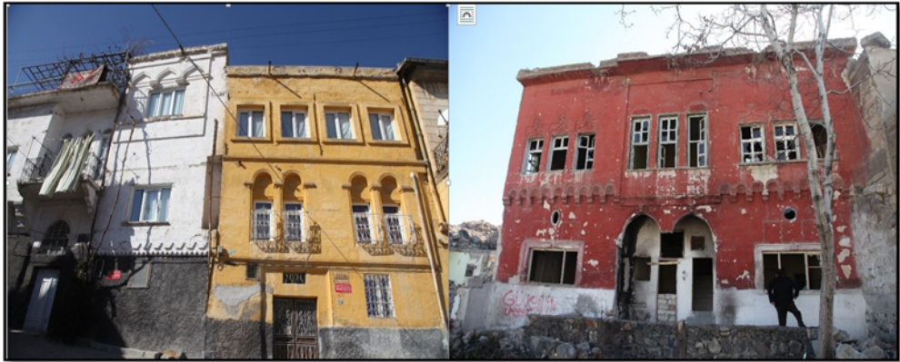
Fotoğraf 4. Nevşehir’de koruma altına alınan tarihi Rum evlerinin restorasyon öncesi görüntüleri.

Safranbolu’da kültürel miras kaynaklı turizmin başlamasında, bazı faktörler öne çıkmıştır. Bunlardan ilki, miras niteliğindeki eserlerin çeşitli ve fazla oluşudur. Yine bu eserlerin önemli ölçüde korunmuş olması, çekicilikteki bir başka unsurdur. 1976’da TRT’de yayınlanan Safranbolu’da Zaman belgeseli, tanıtım ve koruma açısından hayli etki olmuş, bunu diğerleri takip etmiştir. Batı Karadeniz’in önemli bir turizm merkezi durumundaki Amasra’nın güzergâhta oluşu Safranbolu’nun turizmine katkı sağlamıştır. 15