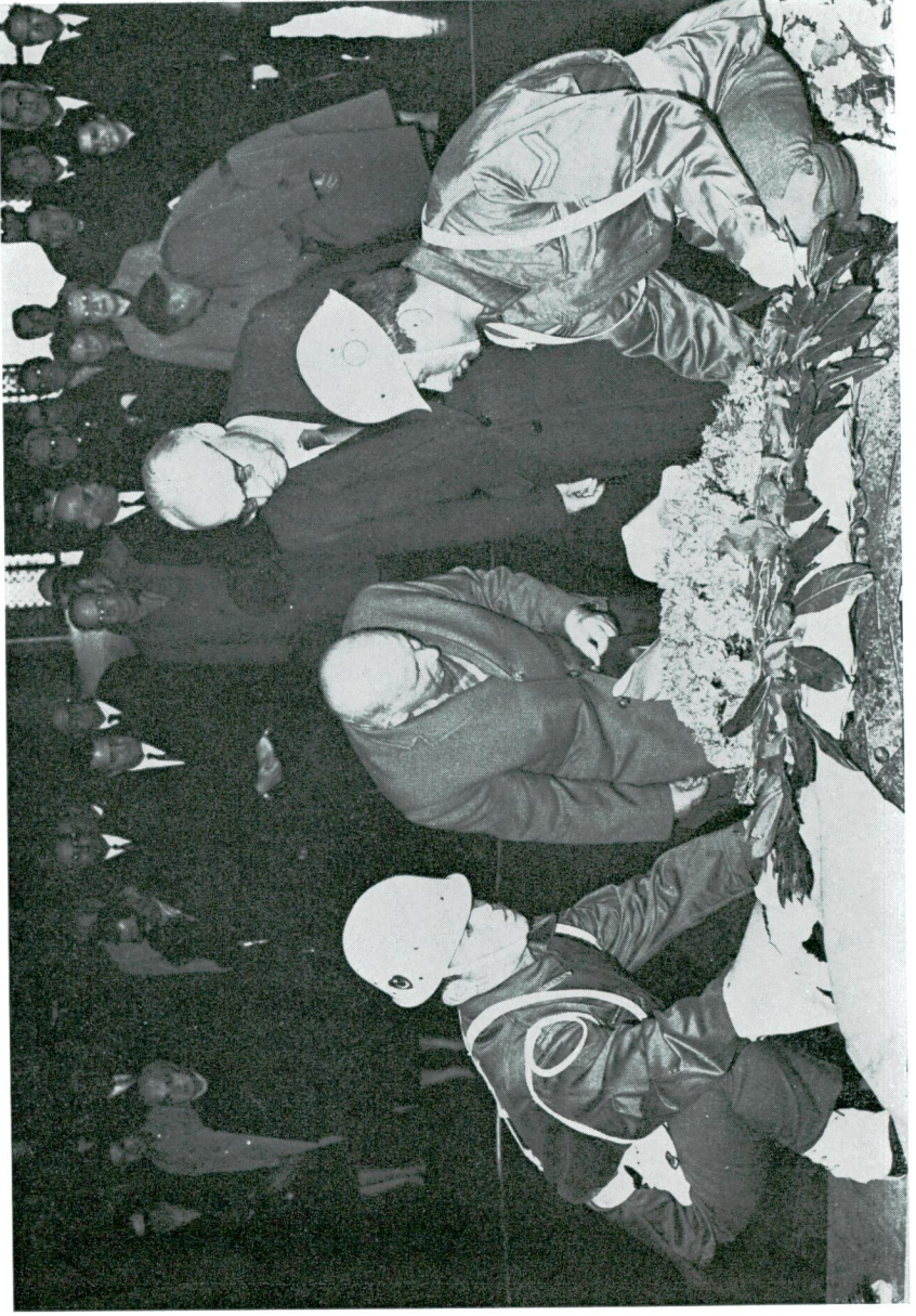
Türk Tarih Kurumu Üyeleri Anıtkabre Çelenk koyarken.