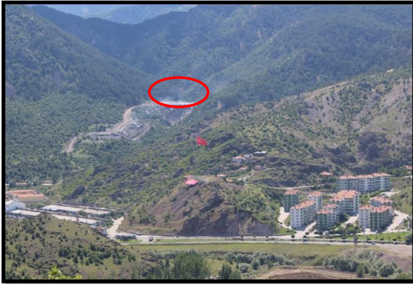
Fotoğraf 8. İlçe merkezine çok yakın bir konumda bulunan çöp depolama alanı Ankara Kızılcahamam yolunun batısında bulunmaktadır.