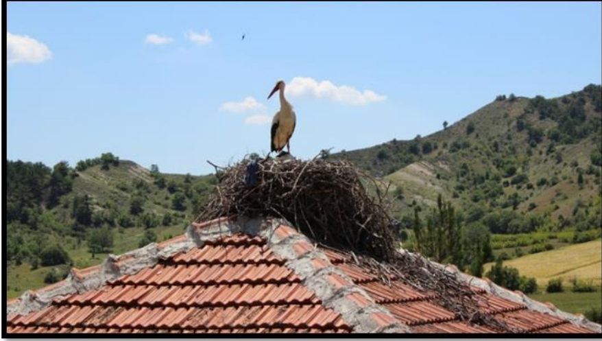
Fotoğraf 4. Mahkemeağcin Köyünde bazı köy evlerinin çatısı leylekler tarafından mesken edinilmiştir.

Diğer taraftan, Ankara ve İstanbul merkezli düzenlenen organizasyonlarla ilçeye çok fazla kamp amaçlı gezi düzenlenmektedir. Bu bağlamda da, ilçenin değişik yerlerinde kamp kuracaklar için zaruri ihtiyaçlara yönelik düzenleme çalışmaları yapılmalı, güvenlik eksiklikleri giderilmeli ve kamp yerlerinin sayısı artırılmalıdır.