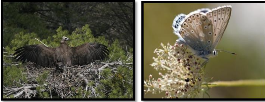
Fotoğraf 7. Kızılcahamam ilçesindeki en meşhur kuş türü Kara Akbaba, en özel kelebek türü ise çok gözlü Anadolu Çillisi ( www.kizilcahamam.bel.tr ; www.trakel.org ).

7), sakallı akbaba ( Gypaetus barbatus ), kızıl akbaba ( Gyps fulvus ), küçük akbaba ( Neophron percnopterus ), karaleylek ( Ciconia nigra ) bulunur. Sahada varlığı bilinen diğer kuş türlerini; paçalı baykuş ( Aegolius funereus ), kaya kartalı ( Aquila chrysaetos ), bayağı puhu ( bubo bubo ), yılan kartalı ( Circaetus gallicus ), kara ağaçkakan ( Dryocopus martius ), bayağı doğan ( Falco peregrinus ), küçük kartal ( Hieraetus pennatus ), kızılca sırtlı örümcek kuşu ( Lanius collurio ), alaca örümcek kuşu ( Lanius nubicus ), orman toygarı ( Lullula arborea ), küçük yeşil ağaçkakan ( Picus canus ) ve küçük sıvacı kuşu ( Sitta krueperi ) oluşturur. Alandaki en özel kelebek türü ülkemize endemik olan çok gözlü Anadolu Çillisi ( Polyommatus ossmar )'dir (Fotoğraf 7). Yalancı apollo ( Archon apollinus ), Karagöz mavisi ( Glaucopsyche alexis ), Anadolu zıpızı ( Muschampia proteides ) ve bavius ( Pseudophilotes ) ilçe ormanlarında yaşayan nesli bölgesel ölçekte tehlikedeki kelebek türlerinin başında gelir (Ankara İli Doğa Turizmi Master Planı, 2013: 35; Orman ve Su İşleri Bakanlığı envanteri).