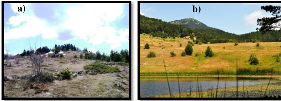
Fotoğraf 5a, b. Kızılcahamam ilçesinde Işık ve Hodulca dağları, turizm kapsamında değerlendirilebilecek kütleler arasındadır.

Ankara ili arazisindeki dağlık sahaların önemli bir bölümü Kızılcahamam ilçesi sınırları içerisinde kalmaktadır. Bu dağlarının büyük bölümü Koroğlu Dağları'nın uzantısıdır. İlçenin yükseltisi ve engebe oranı güneyden kuzeye doğru artmaktadır. Bu dağlık yapı ilçeye ulaşımın geçitlerle sağlanmasına neden olmuştur. Bu dağların pek çoğu dağ turizmi açısından değerlendirilebilecek potansiyele sahiptir. Örneğin; çam ormanlarının hâkim bitki örtüsünü oluşturduğu Işık Dağı'nda; doğa, kış sporları ve yaban hayatı gözlemlemek, kamp ve dağcılık için uygun alanlar bulunmaktadır (Fotoğraf 5a).