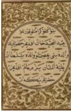
Resim 1. B2964. İlmihâl-i Vasiyyetnâme , 186a.

Bazı kitaplarda eserin mülkiyetinin Sultan’a ait olduğunu ifade eden kayıtlar düşülmüştür. Mesela, B2964 envanter numaralı İlmihâl-i Vasiyyetnâme adlı eserin 186a varağında “Şevketlü kerâmetlü kudretlü ‘Abdü’l-Mecîd Han Efendimiz Hazretleri’nin Vâlidesi ismetlü Vâlide Sultan aliyetü’ş-şân Bezm-i Âlem Efendimiz Hazretleri’nindir” yazmaktadır (Resim 1). 18 Benzeri ifadelere diğer kitapların bir kısmında da tesadüf ediyoruz.