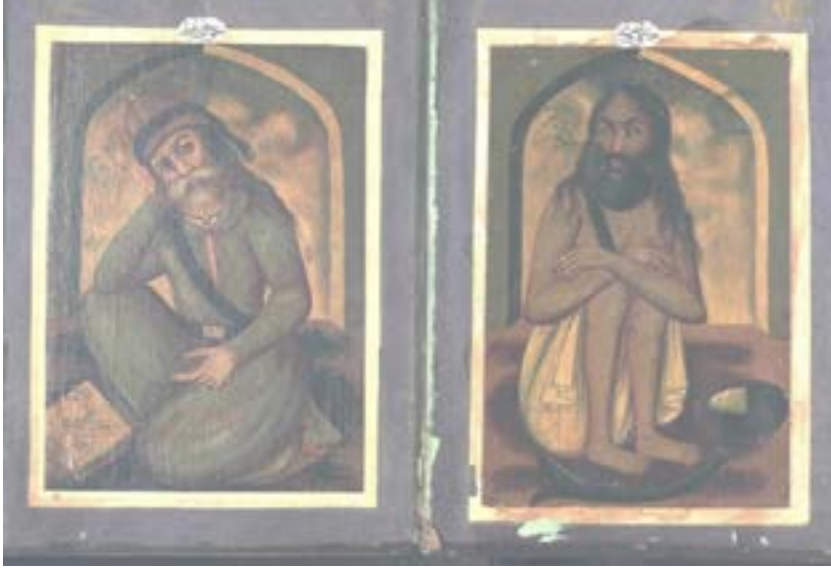
Resim 10. Hacı Bektâş-ı Velî ve Hâce Hâfız