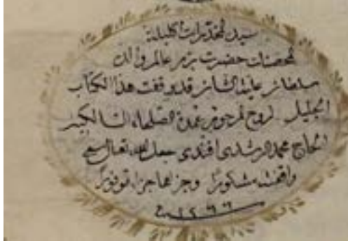
Resim 4. B2984, Muhtasaru'l-Hikmeti'n-Nebeviyye , 1a.