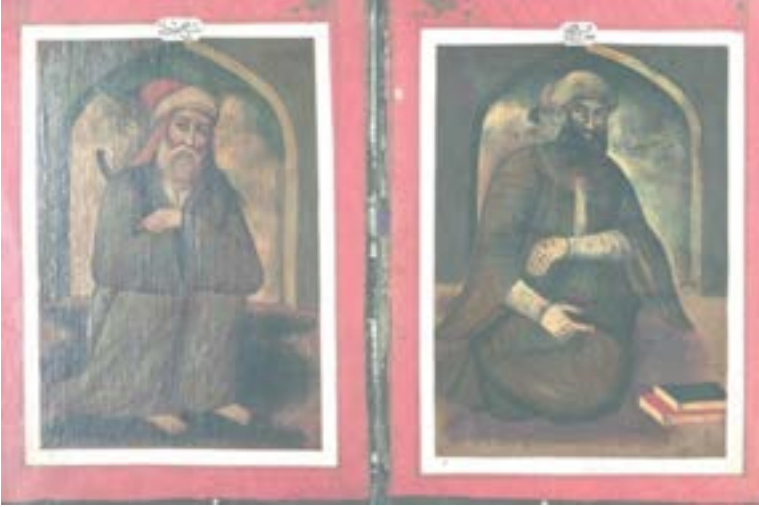
Resim 6. Şeyh Şibli ve Marûf-i Kerhî

4a varlığında Şeyh Şibli'nin (öl. 334/946) tasviri ile karşılaşmaktayız. Ebû Bekr Dülef b. Cahder (Ca'fer b. Yûnus) eş-Şibli Türk asıllı olup, Sâmerâlîdir. İyi bir öğrenim gören Şeyh Şibli, tasavvuf eğitimi almış, dinî ilimlerle de alakadar olmuştur. 31 İlk sûfilerden olan Şibli, dizlerini karnına çekmiş ve ellerini dizlerinin önünde bağlamıştır. Başında beyaz destarlı kırmızı bir taç vardır. Beyaz bir iç gömlek ile kol açıklığı geniş, koyu yeşil renginde uzun bir aba giymektedir. Yalınayaktır. Uzun saçları ve beyaz sakal ile bıyığı tel tel işlenmiştir (Resim 6).