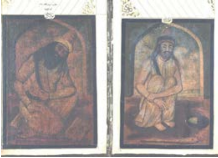
Resim 8. Şems-i Tebrîzî ve Mevlânâ Celâleddîn-i Rûmî

Mevlânâ'nın başı hafif bir şekilde sol tarafa doğru meyillidir. Bir eli karnında, bir eli bacağındadır. Başlığı, beyaz destarlı mevlevî sikkesidir. Mevlânâ, dalgalı, uzun, gür saçlı ve sakallı olarak betimlenmiştir. Figürün tam önünde kırmızı bir baston bulunmaktadır. Bastonun hemen yan tarafında sayfaları açık bir kitap vardır. Sayfaların üzerinde siyah renkli mürekkeple ta'lik olarak مثنوی ما جو قرآن مدل - هادی بعضی و بعضی را مصل yazılıdır. Yazılan beytin anlamı şudur: Mesnevimiz Kur'an gibidir. Bazısına doğru yolu gösterir, bazısını da sapıklığa götürür (Resim 8).