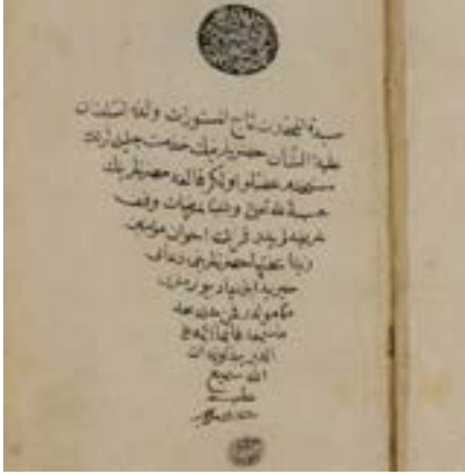
Resim 2. B958, v. 2a, vakıf kaydı.

B5259 Terceme-i me'âricü'n-Nübüvve fi medârici'l-fütüvve , B343 Riyâzu'l-Gufrân (Tefsîr-i Süre-i Yâsîn) adlı eserler Başağa Abdülganî Efendi'nin bağışladığı kitaplardır. Kitaplarda Vâlîde Sultan'ın mührü yanında kitapların vakfedildiğine yönelik kayıt düşürülmüştür. Mezkûr kayıtlarda şu yazılıdır: “Devletlü işmetlü Vâlîde Sultân 'aliyyetü'ş-şân hazretlerinin bâş ağâsı 'Abdü'l-Ġanî ağanın vaqıflarıdır. Sene 1266” (Resim 3). 21 Örneği verilen bu eserler haricinde Abdülganî Ağa'nın kütüphaneye vakfettiği başka kitapları da mevcuttur.