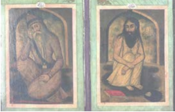
Resim 5. Veysel Karanî ve Bâyezid-i Bistâmî

menkıbelerinden elde ederiz. 29 Bistâmî burada yaşlı biri olarak resmedilmiştir. Başında kahverengi tonlarda bir külah vardır ve bu külahın çevresi siyah bir destar ile çevrilidir. O, beli kemerli, koyu tonlarında, uzun bir elbise giymektedir. Bistâmî'nin hemen önünde kırmızı bir baston bulunmaktadır (Resim 5).