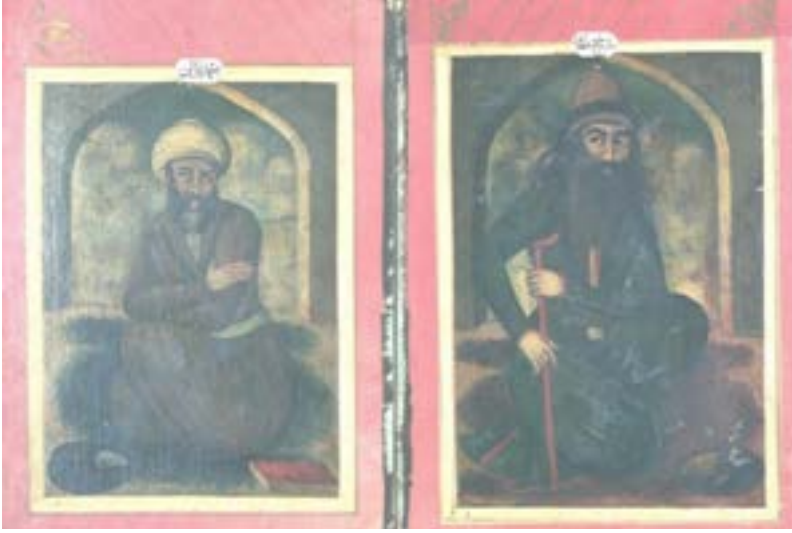
Resim 7. Şeyh Attâr ve Ahmed Gazzâli