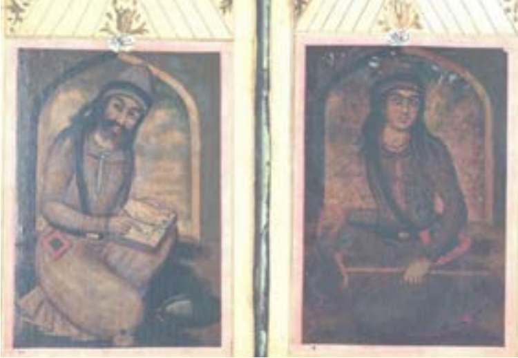
Resim 9. İbrahim Edhem ve Şeyh Sa'dî

Şeyh Sa'dî, yazı yazarken canlandırılmıştır. Baş kısmı hafif sol tarafa eğiktir. Şeyh Sa'dî'nin sağ elinde tuttuğu bir kamış kalem, sol bacağına koyduğu bir defter vardır. Figürün saçları dalgalı ve uzun olup, başlığı siyah destarlı bir külahtır. Burada figür uzun, tek parça, açık renk kıyafeti ve belinde siyah kemerle tasvir edilmiştir. Hemen önünde bir keşkül ve üzerinde natüralist üslupta bir gül tasvirinin olduğu su testisi yer almaktadır (Resim 9).