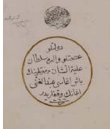
Resim 3. B343, v. 79a.

Cevahir Ağa'nın vakıf kaydına B1503 env. numaralı et-Tarîkatü'l-