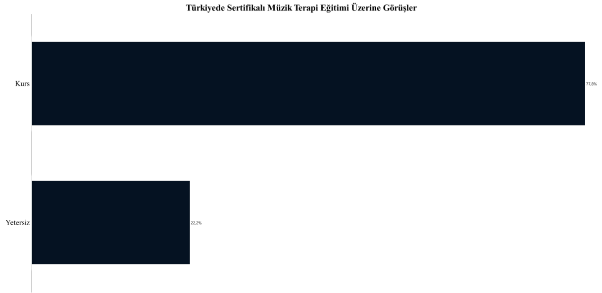
Tablo 3: Katılımcıların Türkiye’deki sertifikalı müzik terapi eğitimine ilişkin görüşleri.

Soru 3: Katılımcıların “Sizce sertifikalı müzik terapi eğitimi nasıl yürütülmelidir?” sorusuna ilişkin görüşleri; eğitime yönelik, eğitime katılacaklara yönelik, eğiticilere yönelik ve müzik terapistlere yönelik başlıkları altında gruplanarak maddeler halinde sıralanmıştır.