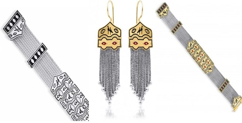
Görsel 8: Göbeklitepe Koleksiyonu, Luna Merdin, 2020.

Kaynak: https://lunamerdin.com/tr/7-gobeklitepe-koleksiyonu , (Erişim Tarihi: 06.08.2022).