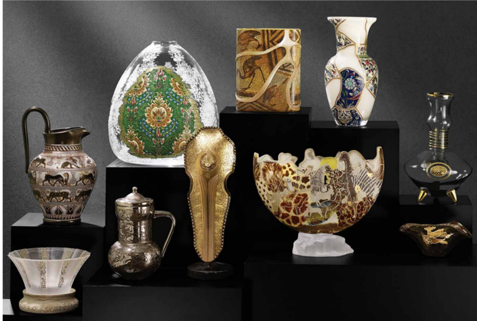
Görsel 4: Kayıp Hazineler Koleksiyonu Paşabahçe, 2021.