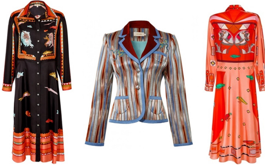
Görsel 3: Kutnia Markası Kadın Giysi Tasarımları, 2022.