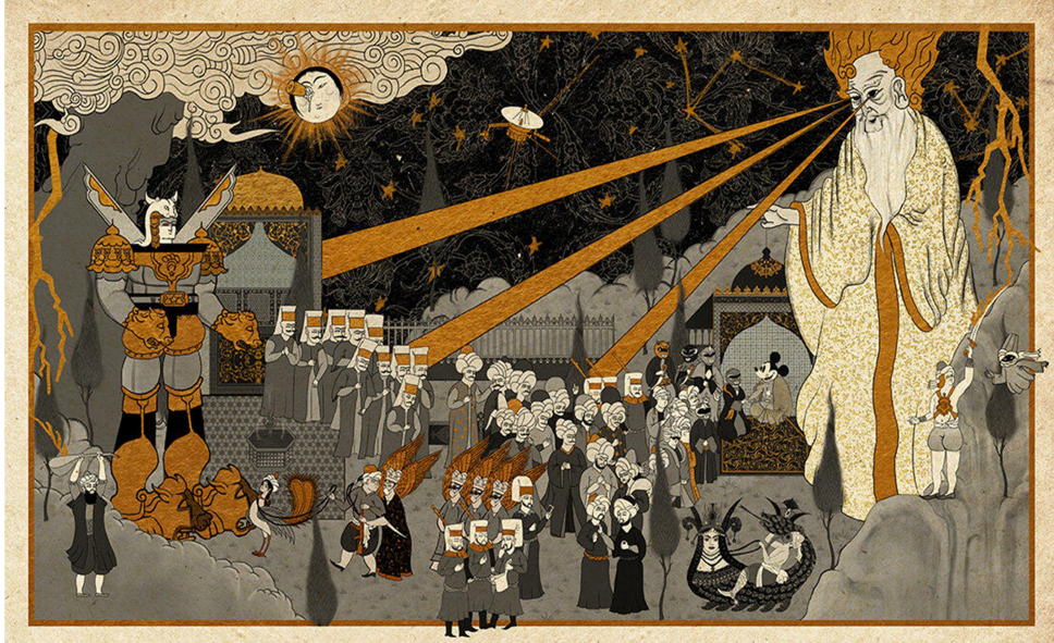
Görsel 5: Kwom 2, Murat Palta, 2021.