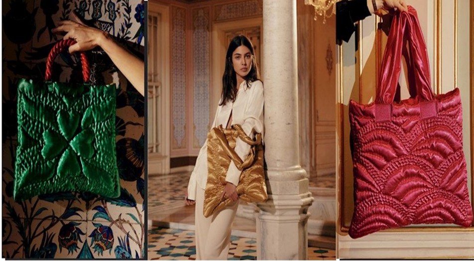
Görsel 6: Mehry Mu x Yorganlar Fora Koleksiyonu, 2020. .