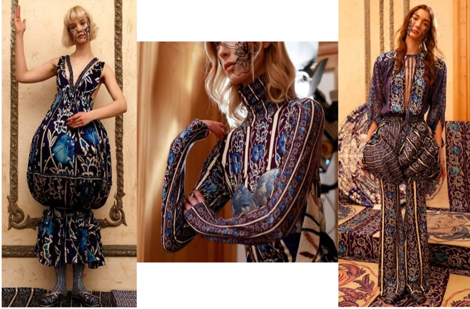
Görsel 7: Ballerina's Hidden Dream, Başak Cankeş, 2020.