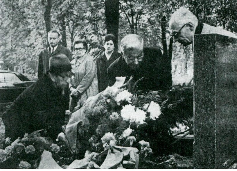
Armin Vambéry'nin mezarına Türk heyeti çelenk koyarken