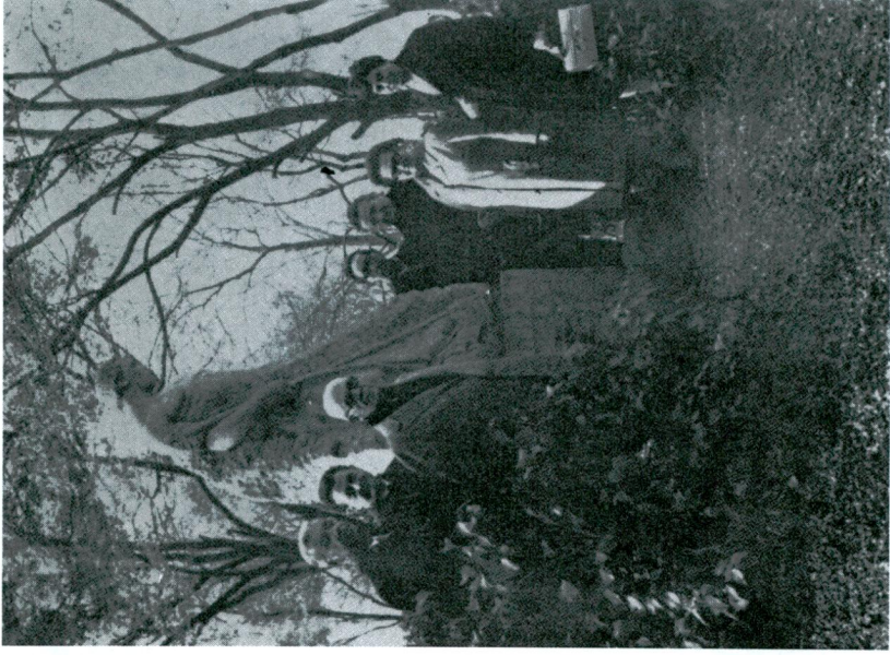
Türk ve Macar heyetinden bir grup Jaszberény kasabasındaki Canféda anıtı önünde