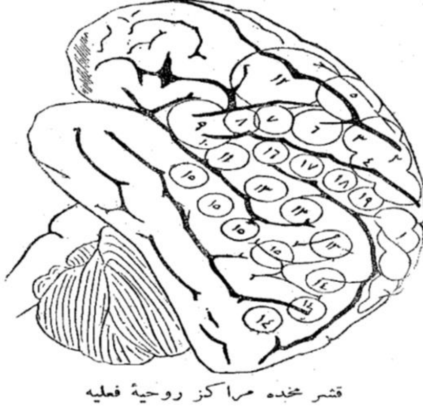
Şekil 2: Kaşr-ı Muhhda merâkiz-i rûhiyye-i fi'liye

1 ilâ 5 Merâkiz-i herekât-ı etrâf (Felc-i nısf tûlânî). 7 ve 8 Mültekâ-yı şefetânın merkez-i herekât (Felc-i vechî). 9 ve 10 Şefetân ile lisânın tekellüme mahsûs olan merkez-i herekâtı (Ma'dûmiyet-i nutk). 11 Zâviye-i fehmin merkez-i inkimâş. 12 Re's ile gözlerin herekât-ı cenbiye merkezi ile yazı yazmak herekâtı merkezi (Adem-i kâbiliyet-i tahrîr). 13 Muharrer veya matbû' kelimâtı tanıyıp anlamak kuvve-i hâfızası merkezi ('Umyu'l-keâm) ve 14 Merkez-i dûrbîn (Nîm beyin). 15 Merkez-i sem'î (Asımiyyet-i kelâmı