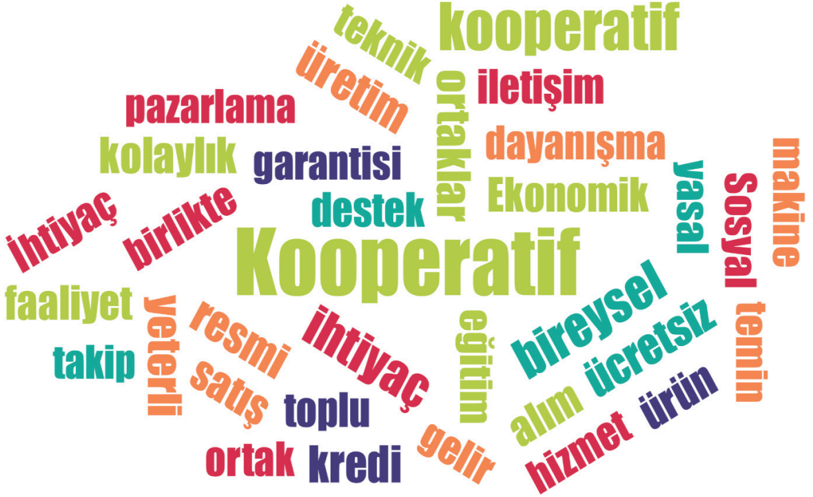
Şekil 1.4 Kelime Bulutu

MAXQDA 2022 Nitel Veri Analiz programı kullanılarak çalışma kapsamında görüşmeler kapsamında elde edilen verileri oluşturan içerik cevapları kullanılarak, “ Kelime Bulutu ” işlevi kelimelerin metin içerisinde kullanım sayıları ile orantılı olarak büyük yazı boyutu ile farklı renk atamaları sunulmuştur.