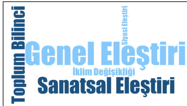
Şekil 2. Beyazperde.com Sitesi İçin Kod Bulutu

Kullanılan kod gruplarından 5 tanesi ele alınarak kod için minimum sıklık 1 ve ölçek en sık kullanılan grup daha büyük olacak şekilde düzenlenmiş bir kod bulutu elde edilmiştir (Şekil 2).