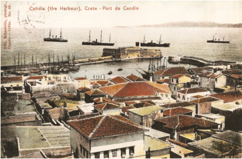
Girit (Candia) (20. yy. başı)

İpek üretiminin bölgede yaygın olduğunu yerel halkın birbirleri arasında ipek alıp satması da göstermektedir 1 .