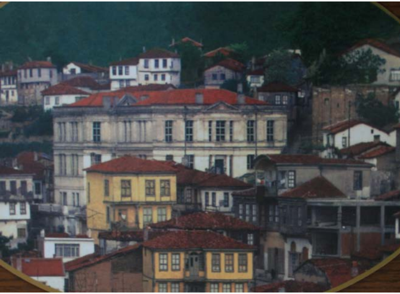
Tirilye (20. Yüzyıl Başları)

Mübadeleden önce Mudanya (Bursa) yöresinde yaşayan Rumlar da ipekçilik yapıyorlardı. 1908 yılına ait verilere göre 225 ton koza elde edilmişti. Tirilye’de oturan yerli Rumların Girit’ten gelen mübadillere verilen evleri ipek böcekçiliği yapılmasına uygun şekilde düzenlenmişti.