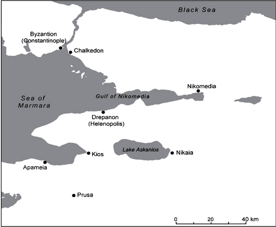
Harita 1: Roma Döneminde Bithynia 24

ömür boyu üstlenmek üzere seçildikleri ve bu kişilerin ancak belirli nedenlerden ötürü görevlerinden azledilmelerinin mümkün olduğuna işaret eden bir takım maddeler yer almıştır. 22 Boule kentin resmi yönetim organıydı. Burası kent siyasetinin şekillendiği ve vatandaşlık sorunlarının görüşüldüğü bir kurum olarak karşımıza çıkmaktadır. Boule 'nin Roma açısından en önemli işlevi civitas 'tan toplanan vergilerin eyalet valisine ulaştırılması idi. 23