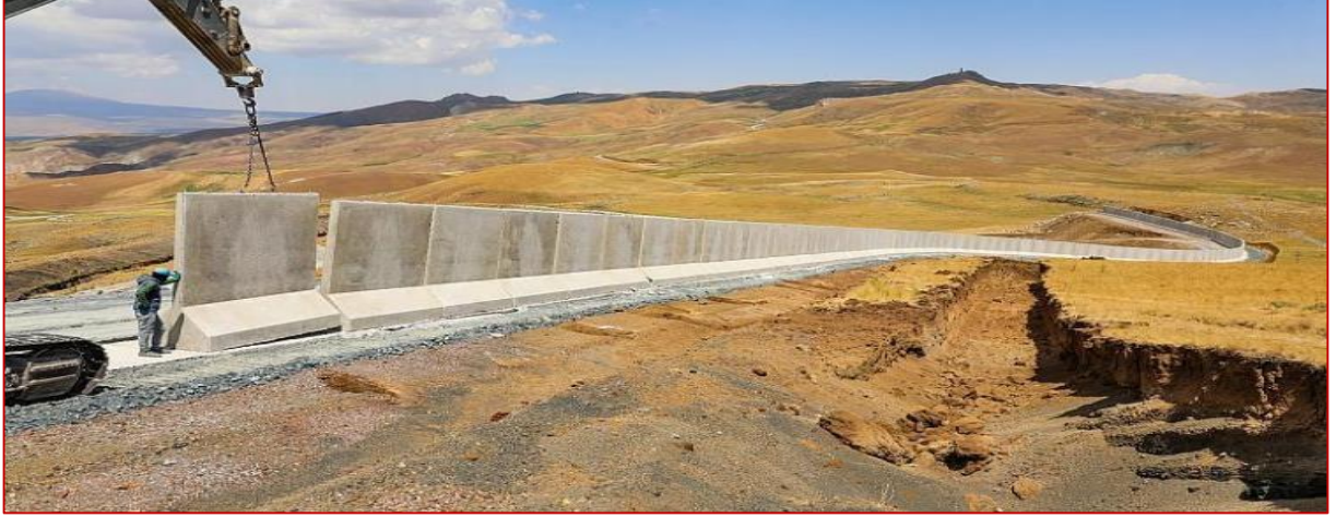
Foto 2: Van-İran Sınır Hattında İnşa Edilen Duvar.

Donan ve Wilson'a (2002) göre 'sınırlar ve kaçakçılık bir dereceye kadar birbirlerine göre tanımlanmıştır. Çünkü tanımı gereği de kaçakçılığın gerçekleşmesi için mutlaka bir devletin, sınırı ve devletin yasal olarak neyin ihracatı ile neyin ithalatının yapılabileceğini bildirmesi gerekir (Donan ve Wilson: 2002: 177). Baud ve Schendel (1997) ise kaçakçılığı 'siyaset ve ekonominin bir arada bulunduğu tipik bir sınır eylemi olarak tanımlayarak, devletlerin sınır ticaretini kanunlarla kısıtlamaya çalıştığını ifade etmektedir (Baud ve Schendel, 1997: 23). Fakat sınır bölgelerinde yaşayanlar ile illegal olarak tanımlanan ticareti; kaynakların kıtlığı, yoksulluk, malların pahalılığı ve çekicilik gibi nedenlerden dolayı gerçekleştirmektedirler. İlegal sınır ticareti ile ilgili çalışmalar yapan Sikder (2005) 'kaçakçılığın devletler için yasadışı olarak kabul edilmesine karşın bu ticaretin, sınır bölgelerinde yaşayan yoksul insanların yaşamlarını devam ettirmeleri için gerekli olduğunu ifade etmektedir (Sikder, 2005: 432). Türkiye-İran sınır bölgesinde de her ne kadar duvar ile engeller oluşturulmaya çalışılsa da tam anlamı ile geçişlerin kontrol altına alındığı söylenemez.