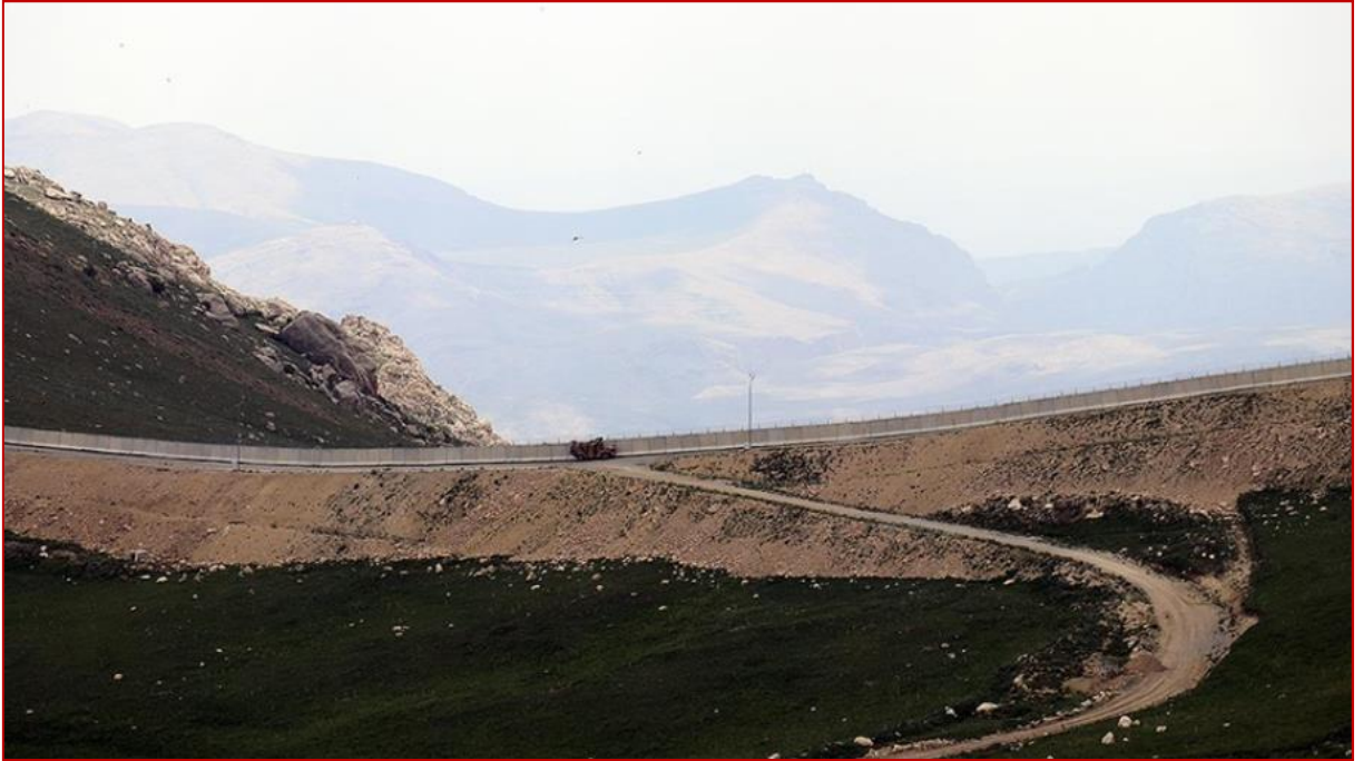
Foto 1: Türkiye-İran Sınırının Ağrı Bölümündeki Sınır Duvarı. (Söylemez, 2022.)

duvarının yanı sıra gözetleme kuleleri, gece görüşlü termal kameralar, harekete duyarlı sensörler ve optik kuleler yardımı ile sınırdan göçmenlerin, kaçakçılık yapanların ve teröristlerin geçmeleri engellenmektedir. Ancak genel olarak sınıra örülen duvar tam anlamı ile bir koruma sağlayamamaktadır. Entegre güvenlik sistemi doğrultusunda duvarların üzerine jiletli teller yerleştirilmekte böylece sınır geçilmez hale getirilmektedir. Ağrı-İran arasındaki 87 km'lik sınırın 83 km'sine sınır duvarı yapılmıştır (Söylemez, 2022: www.aa.com.tr). Zor bir topoğrafyaya sahip bu sınır hattı, güvenliğin sağlanması amacıyla yapılan sınır duvarı ile “caydırıcı” olmuştur. Çünkü sınıra örülen duvar her ne kadar yasadışı göçmenlerin geçişini engellemek amacı ile yapılmışsa da sınırdan geçişler tam olarak önlenememiştir