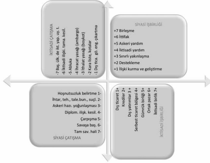
Şekil 2: Siyasi ve İktisadi İlişki Türlerinin Kartezyen Koordinat Sistemindeki Yeri

gerçekleşmişken 2022 yılı Ocak-Eylül döneminde 5,737 milyar USD'lik ihracat gerçekleşmiştir (En Fazla İhracat Yapılan 20 Ülke (Milyon Dolar), 2022). RF'den 2021 yılı Ocak-Eylül döneminde 20,173 milyar USD'lik ithalat gerçekleşmişken, 2022 yılı Ocak-Eylül döneminde 45,340 milyar USD'lik ithalat gerçekleşmiştir (En Fazla İthalat Yapılan 20 Ülke (Milyon Dolar), 2022). RF'den Türkiye'ye ziyaretçi sayısı Ağustos 2021'de 906 060 iken, 2022 Ağustos ayında 806 505'e düşse de rakam oldukça yüksektir (Ağustos 2022 Sınır İstatistikleri Aylık Bülteni, 2022). Bunlar haricinde Akkuyu Nükleer A.Ş. yatırımı sürmektedir. Bu verilere göre Türkiye-RF iktisadi ilişkileri Ekim 2022 itibarıyla +3 seviyesindedir.