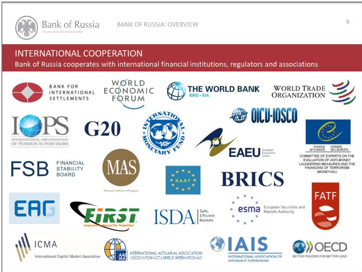
Resim 2: Rusya Federasyonu Merkez Bankası'nın 2019 Yılı İtibariyle Uluslararası İşbirliği

RF uluslararası ticareti düzenleyen, denetleyen kuruluşların yanı sıra uluslararası ödeme, kredi, bankacılık, sigortacılık kuruluşlarına da katılmıştır. Örneğin 1990'da kurulan Rusya Federasyonu Merkez Bankası (RFMB) Kasım 1996'da 3.000 hisse ile Uluslararası Ödemeler Bankası'na (The Bank for International Settlements) iştirak etmiştir. 31 Mayıs 2005'te 211 hisse daha alarak toplam hisse sayısını 3.211'e yükseltmiştir. 19 Mart 2021 itibariyle RFMB toplam nominal değeri 16.055.000 SDR olan 3.211 BIS hissesine sahip olmuştur. Bu hisseler kayıtlı sermayede %0,57'ye tekabül ederken sonradan alınan 211 hissenin oy hakkı ABD'de kaldığından oy hakkında %0,53'e tekabül etmektedir. BIS'in toplam sermayesi 3 milyar SDR eşit nominal değerde 600.000 hisse (hisse başına 5.000 SDR) şeklinde sunulmuştur. Toplamda 565.125 adet hisse ihraç edilmiştir (Банк международных расчетов БМР, 2022). BIS işbirliğiyle II. Dünya Savaşı'nın hemen ardından ve 1970'lerin başına kadar, Bretton Woods sistemini para politikası alanında uygulamaya ve savunmaya odaklanmıştır (BIS History – Overview, 2022).