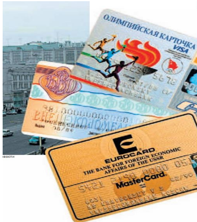
Resim 1: İlk SSCB Kredi ve Borç Kartları, 1988

SSCB'de yurtdışına erişim ve yurtdışından SSCB'ye erişim 1980'li yılların ikinci yarısında kolaylaştırılmıştır. Gorbaçov ve Yeltsin dönemlerinde dışı açılımla birlikte yabancı bankalara, ödeme sistemlerine, kredi kartına ihtiyaç artmıştır. Yeltsin dönemi sonunda 1 Ocak 2000 itibariyle, RF'de 333'ü banka kartı hazırlayan, 319'u temin ettiği banka kartını müşterilerine sunan toplamda 371 kredi kurumu bulunmaktaydı. 1999'da uluslararası kartlar da dahil olmak üzere her türlü banka kartı sayısı 5 milyonu aşmıştır. Ücret ve maaşları banka hesaplarına aktarılan işçi ve memurlara kart verildikçe bu sayı yükselmiştir (The Central Bank of the Russian Federation Annual 1999 Report, 2000: 70).