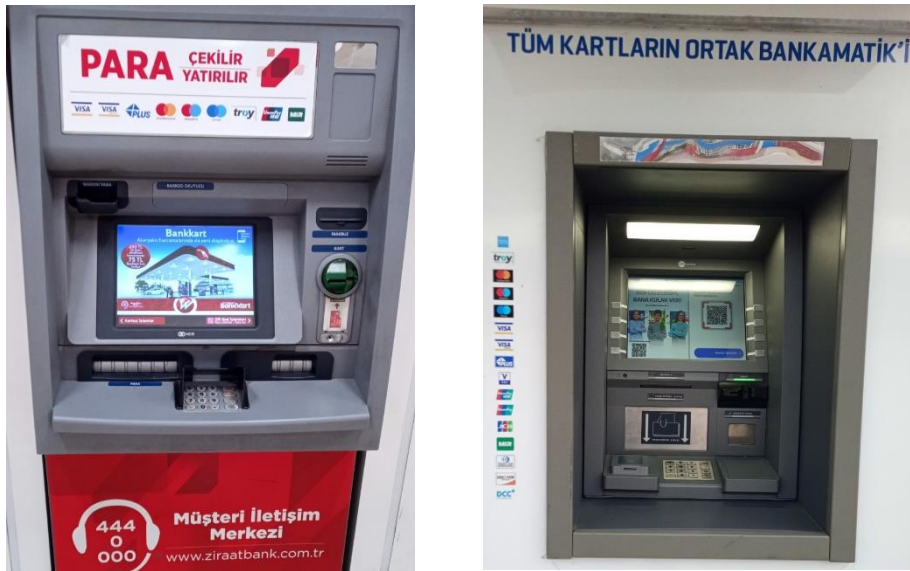
Resim 3: Karabük Üniversitesi İşletme Fakültesi'nde Ziraat Bankası ve İş Bankası ATM makinesinde MİR logosu, 18 Ekim 2022

Türkiye'nin milli Troy kartları olsa da Visa ve MasterCard yaygın kullanılmaktadır. Visa ve MasterCard'a erişimin kesilmesinin Türkiye'de olağan üstü iktisadi karmaşaya yol açacağı aşikârdır. Neticede 29 Ekim 2022'de kamu bankalarının MİR sisteminden ayrıldığı bildirilmiştir (İş Bankası ve Denizbank'ın ardından kamu bankaları da Rus ödeme sistemi Mir'i askıya alıyor, 2022). Anlaşılabileceği üzere ABD, Türkiye'nin özel kesim ve kamu kesimi bankalarını MİR sisteminden ayrılmaya zorlamıştır. Batı SSCB sonrası RF'yi dünya ekonomisine, ticaretine, ödeme sistemine katmak için uzun süre çabalamışken RF'nin Kırım'ı işgal ve ilhaki sonrası seçici müeyyideler uygulanmıştır. Bilhassa RF'nin Ukrayna'yı işgali sonrası Batı RF'nin dünya ekonomisi, ticareti ve ödeme sistemiyle bağlantısını tamamen koparmak için çabalamaktadır. Batı müeyyidelerinin tesirini arttırmak için Türkiye gibi RF'ye müeyyide uygulamayan ülkeleri RF ile iktisadi ilişkilerini kesmeye zorlamaktadır. İş Bankası ve Ziraat Bankası MİR sisteminden çıksa da Karabük Üniversitesi ATM'lerinden 18 Ekim 2022 itibarıyla MİR logosunun halen durduğu tespit edilmiştir.