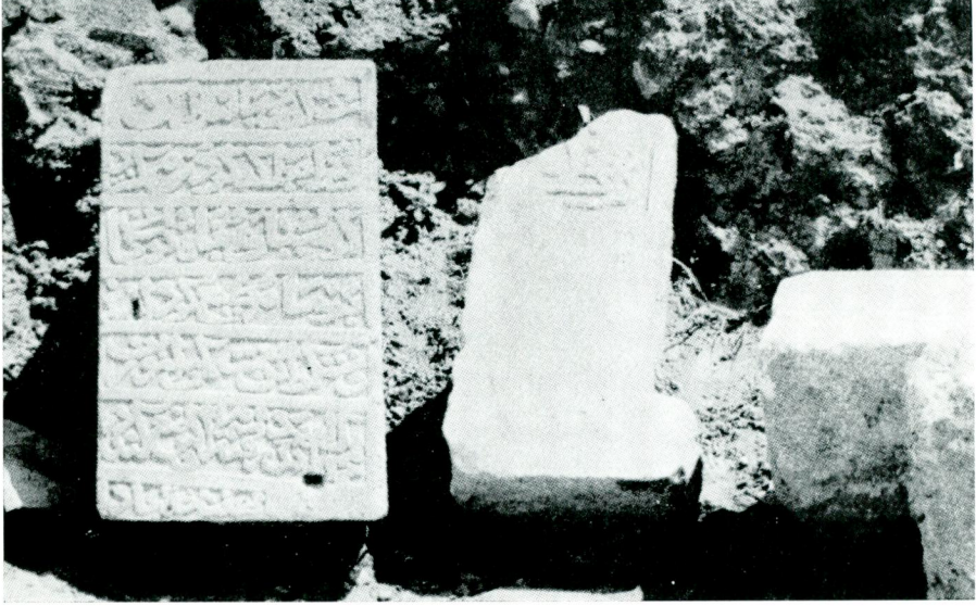
II. Kitabe, motifl: kapı kenarı (?)