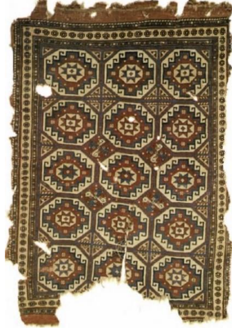
Şekil 11: Çanakkale yöresine ait halı dokuma