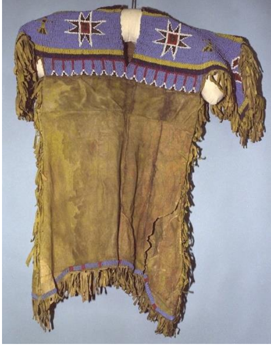
Şekil 10: Sioux kız elbisesi