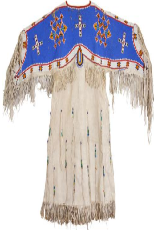
Şekil 6: Sioux boncuklu elbise