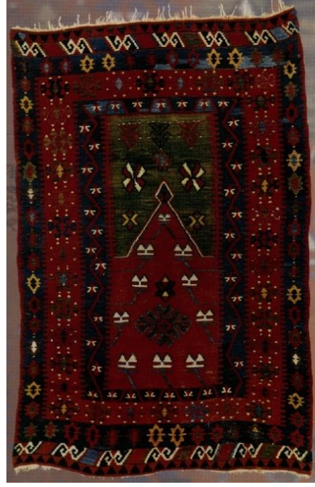
Şekil 13: Konya/Ladik yöresine ait kilim