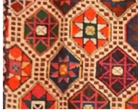
Şekil 7a: Uşak/Eşme zili dokuma detayı