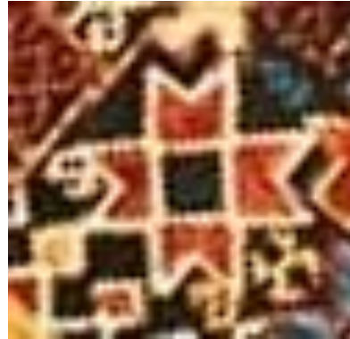
Şekil 9a: Kars yöresi at örtüsü zili dokuma detay