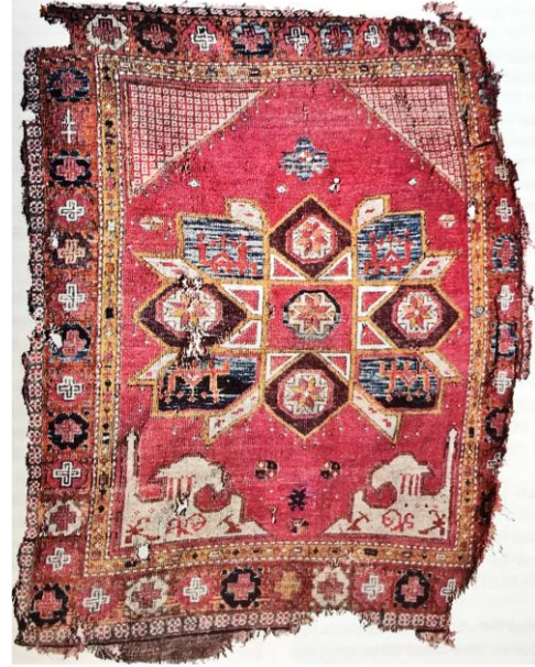
Kaynak: (Bayraktaroğlu, 1997: 87)