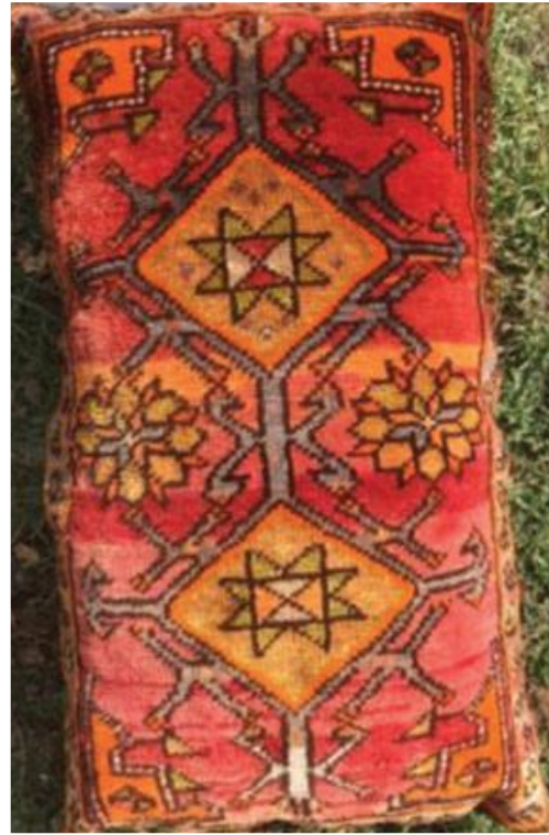
Şekil 19: Kars yöresi halı yastık