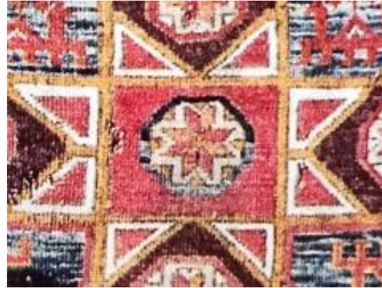
Kaynak: (Bayraktaroğlu, 1997: 87)

Şekil 14: Kuzey Amerika Kızılderili kabilelerinden Sioux'lara ait bir çocuk yeleğidir. Tembel/şerit dikiş tekniği kullanılmıştır. 19. yy sonu olarak tarihlendirilen bu yelek örneğinin malzeme ve süslemelerinde deri, boncuk ve sinüs iplik kullanılarak üretimi yapılmıştır (anthro.amnh.org, t.y.). Motiflerde farklı isimler kullanılsa da Anadolu'da kullanılan yıldız motifine şematik olarak benzemektedir.