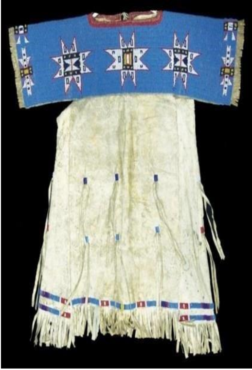
Şekil 18: Sioux kız elbisesi