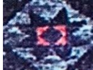
Şekil 5a: Beyşehir Selçuklu halısı detay