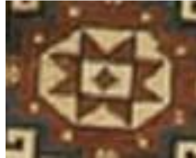
Şekil 11a: Çanakkale yöresine ait halı dokuma detay