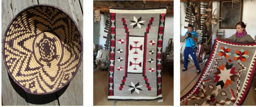
Şekil 2: Yıldız Desenli Sepet Örücülüğü ve Kilim Dokuma Örneği

Kızılderililer; yıldız, güneş ve gökyüzü sembolleri, doğaüstü varlıklara duyulan saygı gereği yıldız sembolünü sanatlarında ayrı bir yerde tutmuşlardır. Sanatlarını yansıtan ürünler olarak; şef battaniyelerinde, boncuk işleme, deri işleme, sepet örücülüğü, dokumacılık gibi birçok üründe yıldız motifini kullanmışlardır (Bkz. Şekil 2).