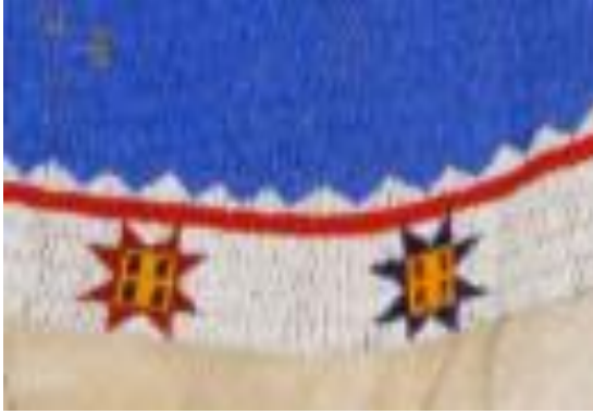
Şekil 6a: Sioux boncuklu elbise detayı