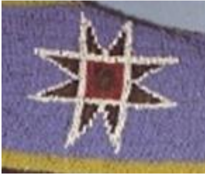
Şekil 10a: Sioux kız elbisesi detay