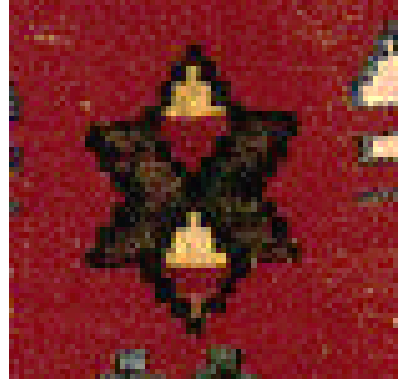
Şekil 13a: Konya/Ladik yöresine ait kilim detayı