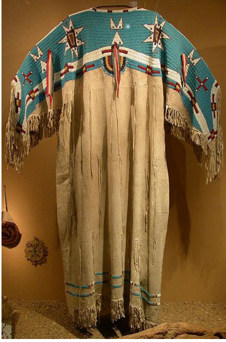
Şekil 16: Lakota Kızılderililerine ait elbise