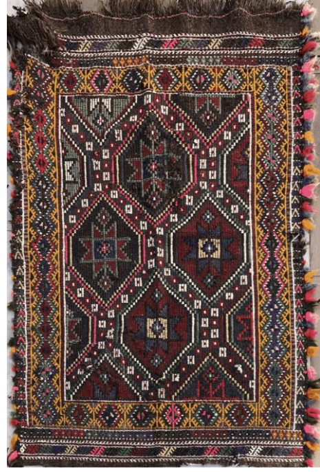
Şekil 17: Kütahya yöresi cicim ve zili dokuma