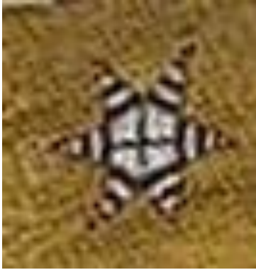
Şekil 12a: Cheyenne Kızılderililerine ait kız elbisesi detayı