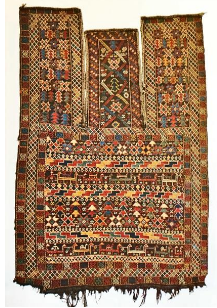
Şekil 9: Kars yöresi at örtüsü zili dokuma