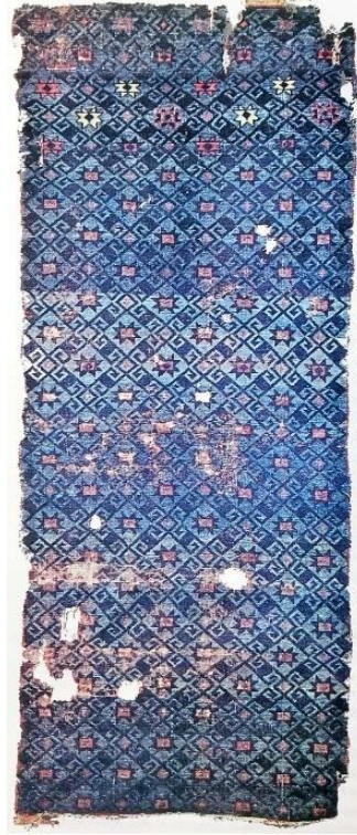
Şekil 5: Beyşehir Selçuklu halısı