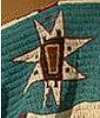
Şekil 16a: Lakota kızıl derililerine ait elbise detayı