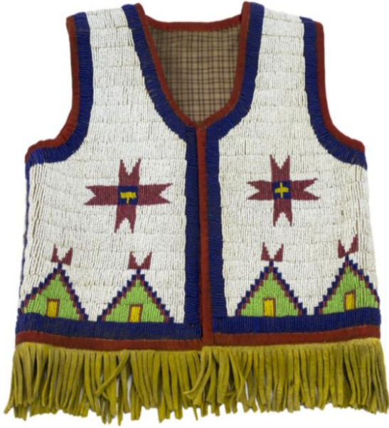
Şekil 8: Siyu çocuk yeleği