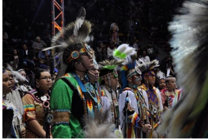
Şekil 1: Arizona Powwow festivalinden bir görüntü