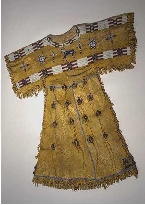
Şekil 12: Cheyenne Kızılderililerine ait kız elbisesi