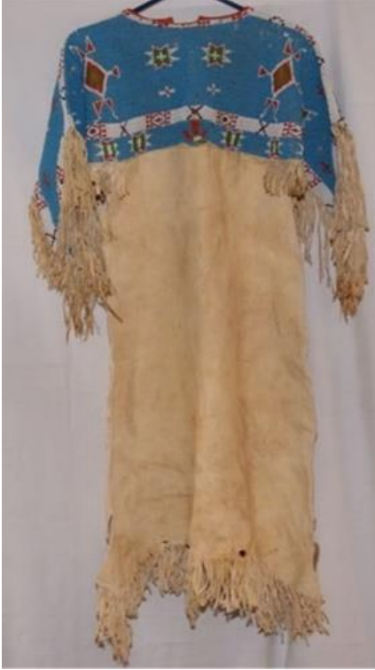
Şekil 4: Kızılderili Sioux boncuklu elbise