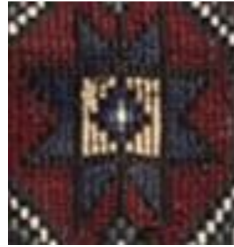
Şekil 17a: Kütahya yöresi cicim ve zili dokuma detayı