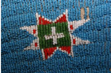
Şekil 4a: Kızılderili Sioux boncuklu elbise detay