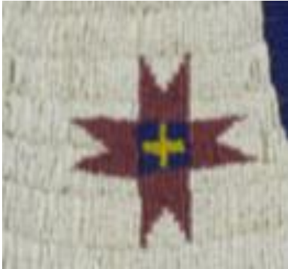
Şekil 8a: Siyu çocuk yeleği detay