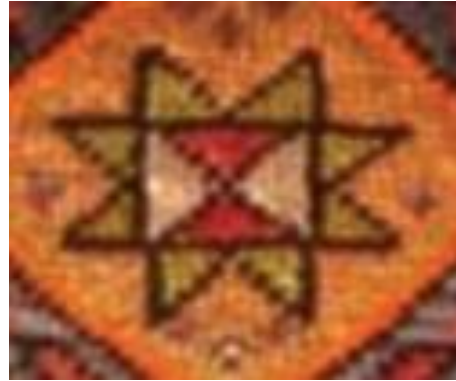
Şekil 19a: Kars yöresi halı yastık detayı