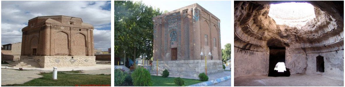
a. Kırmızı Kule (Selçuklar)

Sosyo-kültürel yapı turizm potansiyelini etkileyen önemli faktörlerdendir. Sosyo-kültürel yapıya ilişkin özelliklerden tarihi miras, demografik yapı, ekonomik durum, eğitim durumu ile eğitim ve sağlık kuruluşları incelenmiştir. Merağa ilinde kültürel yapıya ilişkin; 260 tarihi ve arkeolojik öneme sahip alan saptanmıştır (Anonim, 2010d). Merağa ilinin tarihi alanları, özellikle il merkezi Merağa kentinde yer almaktadır. Urartu, Aşkaniler, Selçuklular, İlhaniler, Safeviler ve Kacarlar dönemlerinin izlerini taşıyan kale, ibadethane, türbe, cami, hamamlar, kilise, köprü ve tarihi evler bulunmaktadır (Şekil 3.3).