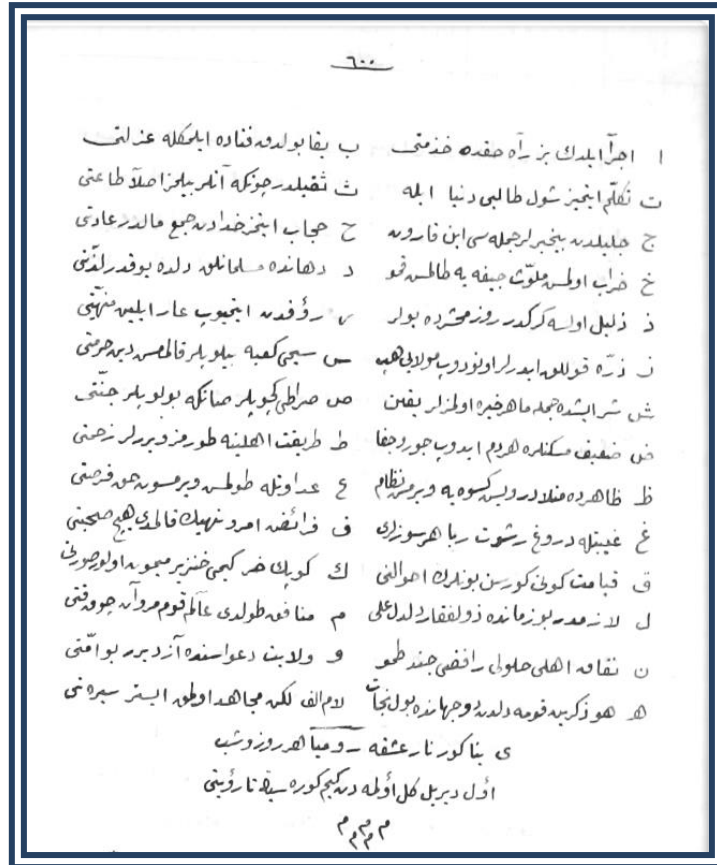
Ali Rûmî, Dürrü'l-Fu'ûd ve Şeyhu'l-İrşâd , s. 600

Şiirin son beytinde Ali Rûmî, kendisinin de Kadîrîlik yolu ve Abdülkâdir Geylânî muhabbetiyle gönüllerden mâsivâyı (Allah'ın aşkı dışında kalan her şey) ve varlığı terk etmesinin gerektiğini söyler Çünkü ilâhî sırlara vakıf olan kişilerden birisi de Hazret-i Gaylânî'dir.