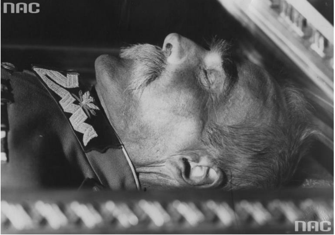
EK-6: Józef Piłsudski, Kraków'daki Wawel Katedrali'nin St. Leonard'ın mahzenindeki tabutunda.