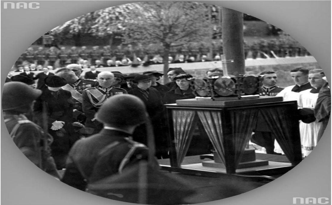
EK- 7: Mareşal Józef Piłsudski'nin kalbi için Vilnius'ta düzenlenen cenaze töreni.