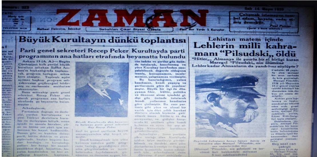
EK-2: Zaman gazetesinde Mareşal Pilsudski'nin vefat haberi.