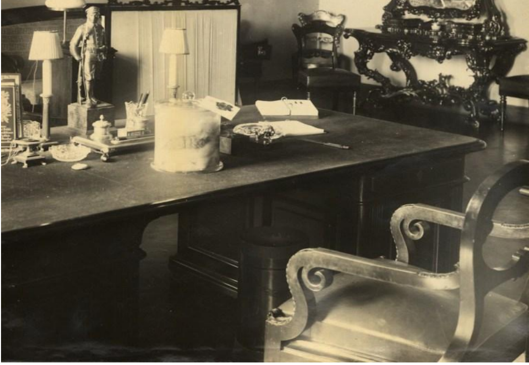
EK-4: Józef Piłsudski'nin beyni, Varşova Belweder'deki kabinesinin masasındaki bir kavanozda.