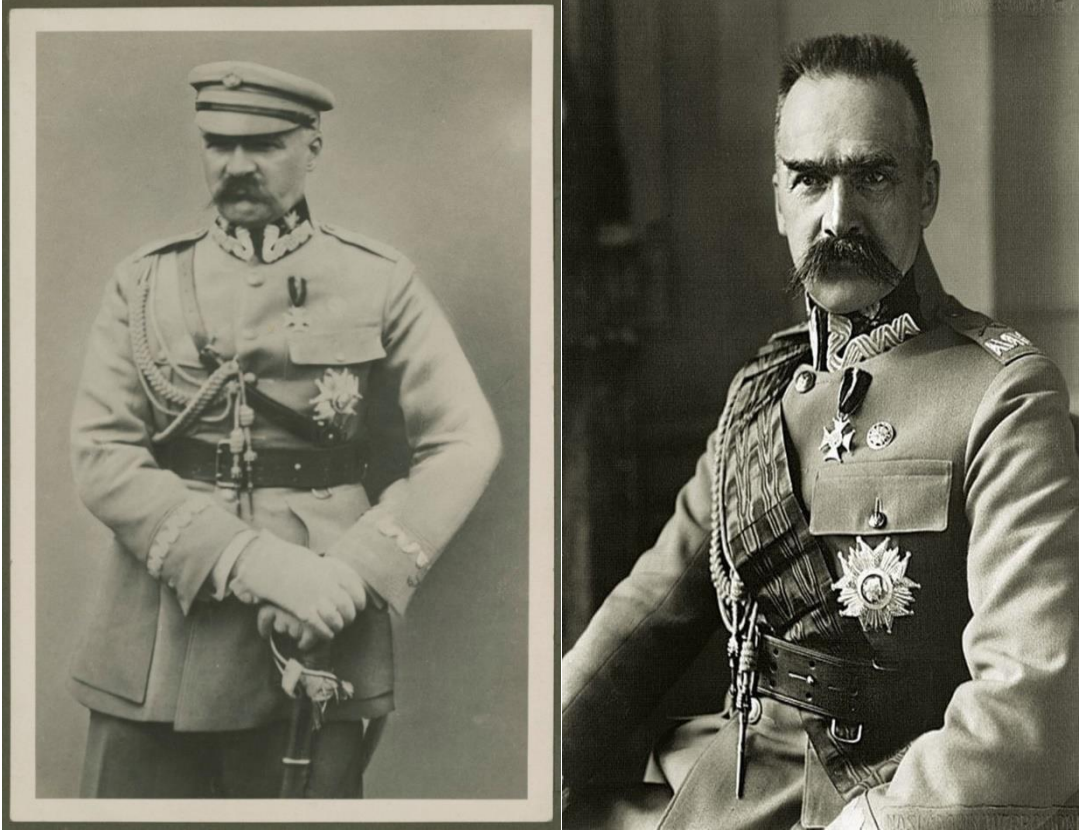
Ek-3: Mareşal Pilsudski'nin askeri üniformalı fotoğrafları.