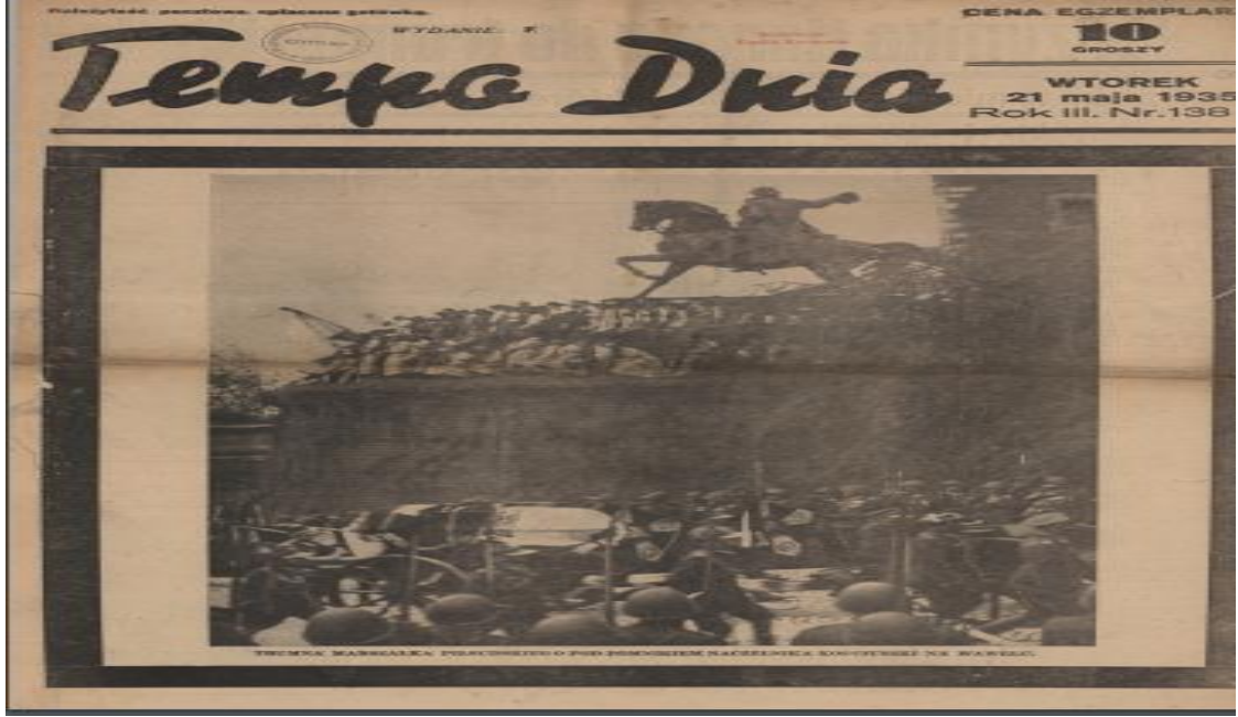
EK-1: Tempo Dnia gazetesinde Mareşal Pilsudski'nin vefat haberi.