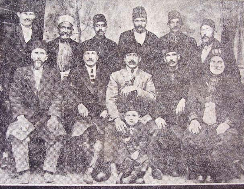
Resim 1: Abdal Murad mesiresinde peştamal kuşanma törenine katılan berberler. (1926)

بیر برلکی بللرندہ پشمال اولانلر اوستہ ، یقوللرندہ دستمال اولانلردہ قالفہ در .