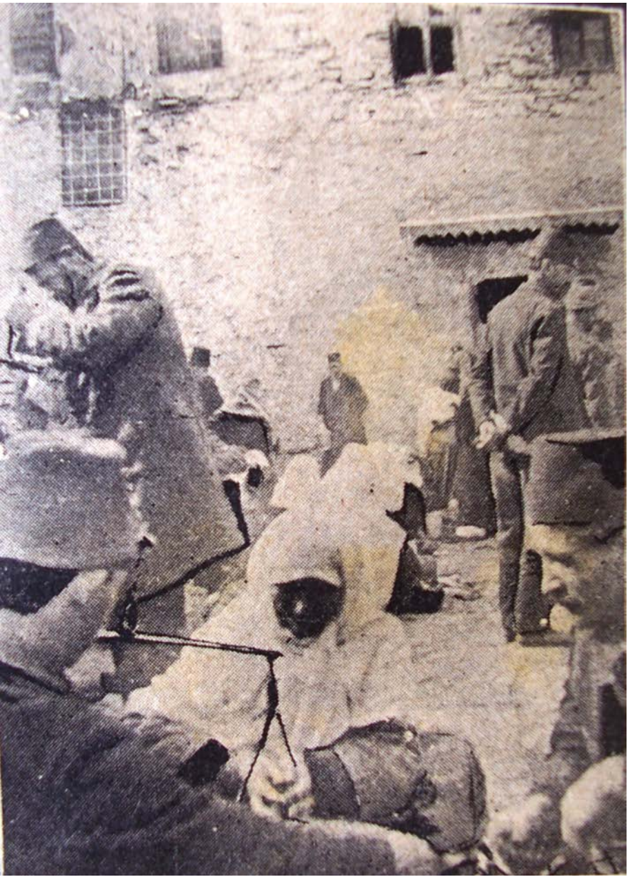
Resim 3: Bursa Pazarı'nda ürünlerini satan köylü kadınlar. (1926)