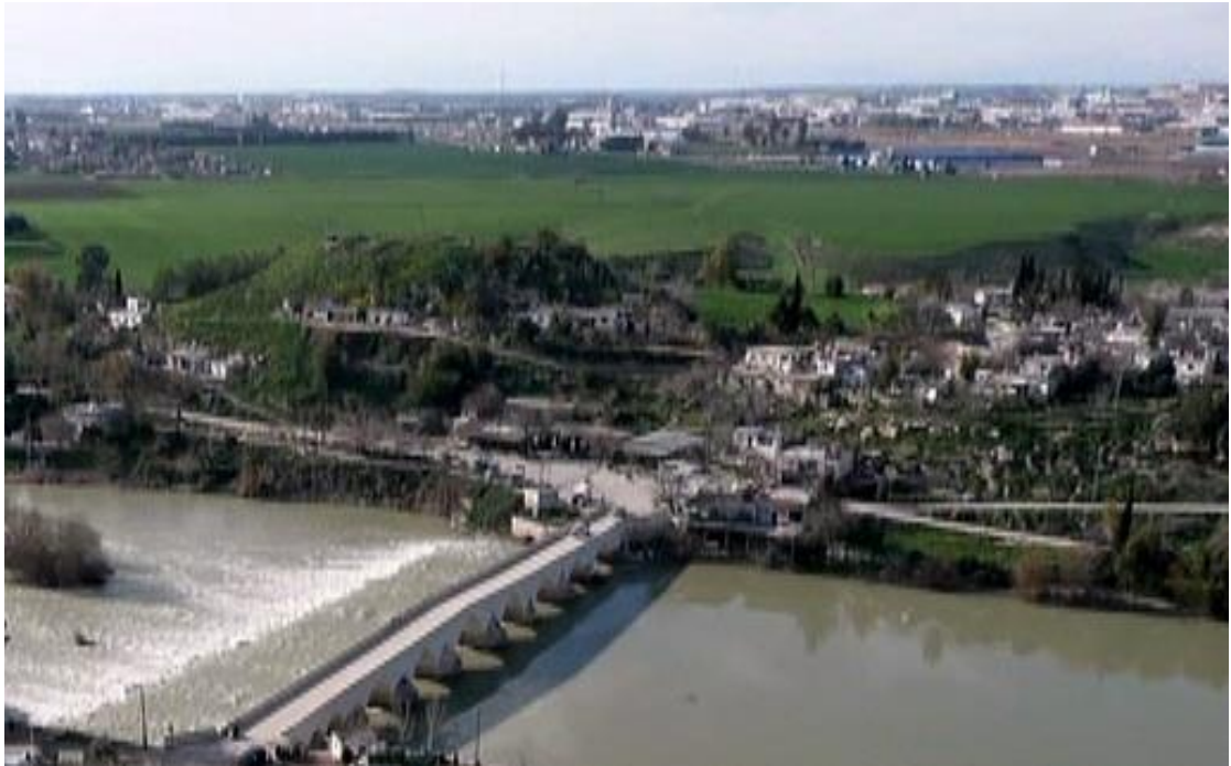
Şekil 2: Misis; Köprü ve Höyük, Havadan Görünüm (THK).