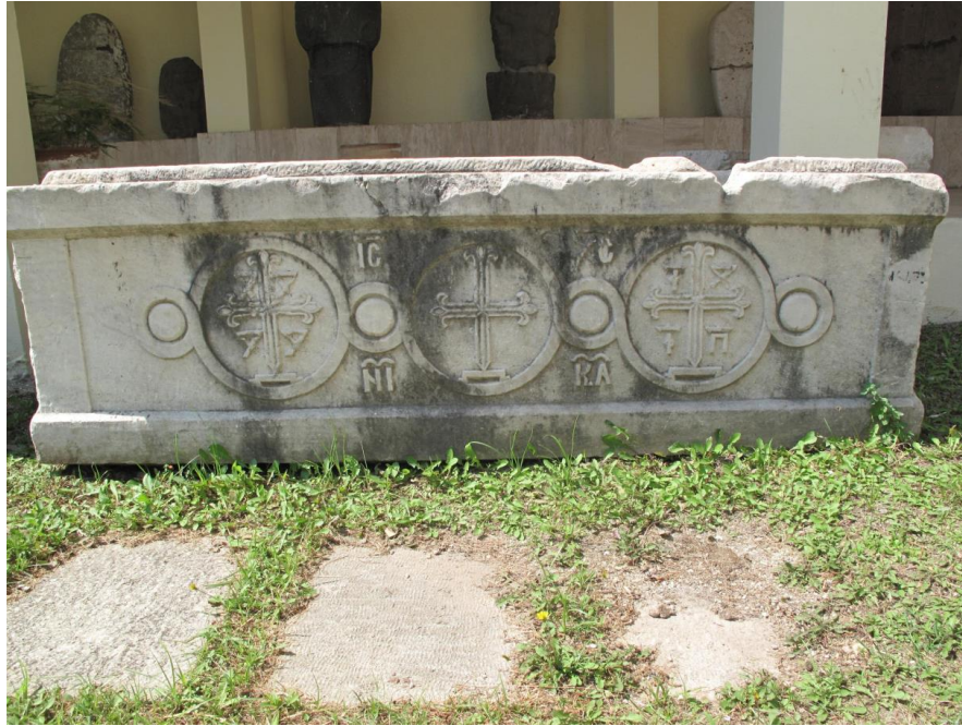
Şekil 4: Misis Lahti