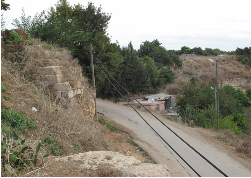
Şekil 3: Misis'i Çeviren Surlardan Geriye Kalanlar.