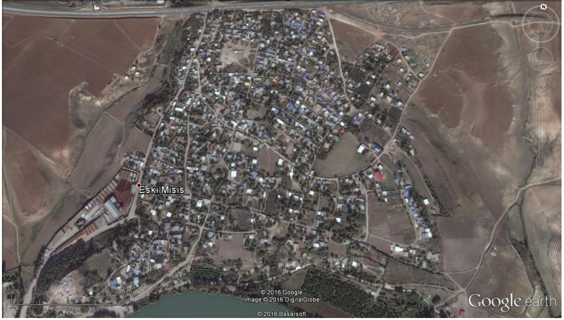
Şekil 1: Misis Antik Kenti

Tarihi Kervan Yolları Kavşağında Bir Kent; Misis (s.236-244)