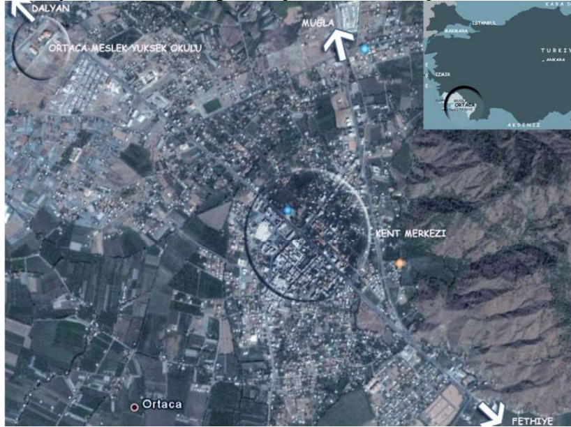
Şekil 1. Araştırma alanı ( http://googleonearth.com , 2007)

Araştırma alanı Muđla İli Ortaca İlçesi rekreasyon alanlarıdır. Ortaca Kenti, Muđla – Fethiye – Antalya karayolu üzerinde, Muđla İl merkezine 80 kilometre uzaklıktadır. Batısında Marmaris, güney doğusunda Fethiye ilçesi yer almaktadır. Dalaman Ovasının kuzey uzantısı üzerinde sahilden 15 km içeride yer alan kent, geniş bir tarım alanının merkezi konumundadır. Ortaca'nın ilgi çeken kesimleri sahil şeridi Sarıgerme ve Antik Kaunos Kenti, kaya mezarları, İztuzu Plajı ve Dalyan Beldesi'dir (Anonim, 2003). 2007 yılı son nüfus sayımına göre ilçe merkezinde 21634 kişi yaşamakta olup; 15 köy ve 1 beldesiyle birlikte 39648 genel toplam nüfusa sahiptir (Anonim, 2008)(Şekil 1).