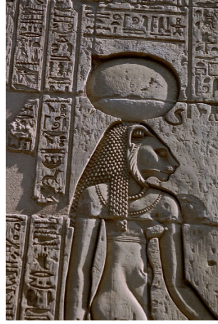
Görsel 16. Tanrıça Sekhmet, Hathor .

Ateşin “yeniden doğuş ve arınma” inancı Hindistan mitlerinde de karşımıza çıkmaktadır. Ateş ve kurban tanrısı Agni, her ateşte yeniden doğar. Kir ve günahlarını yakarak dünyayı arındırır. Kuzey Amerika mitlerinde ise benzer bir hikâyeye rastlanmaktadır. Ateşin çalınması ve insanlara hediye edilmesi efsanesi karşımıza çıkmaktadır. Plato yerlilerinden Nimipular doğanın kendisini kutsallaştırmıştır. Hayvanlar ve ağaçların hareket edip konuştuğu hikayelerde çam ağaçlarının ateşin etrafında toplandığı ve onu insanlarla paylaşmadığı anlatılmıştır. Burada ateşi çalan bir Titan değil Kunduz olmuştur.