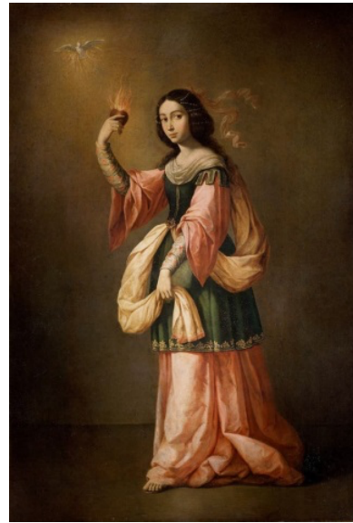
Görsele 3. Francisco Zurbarán, Alegoría de la Caridad , 1655 civarı.