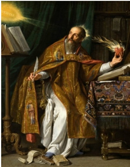
Görsele 2. Philippe de Champaigne, Saint Augustine , 1643 (Sol).

Philippe de Champaigne'nin Saint Augustine adlı eserinde (Görsele 2) tasvir edilen Aziz Augustine, bir Hristiyan piskopos ve ilahiyatçıydı. Resimde Aziz Augustinus bir elinde kitap ışıktan gelenleri yazacakmış gibi bir tüy kalem, diğer elinde yanan bir yürekle tasvir edilmiştir. Üzerinde "gerçek" anlamına gelen "veritas" (Charlton & Charles, 1879) yazan ışığın geldiği yere doğru bakmaktadır. Kalbi Tanrı ve hakikat aşkı ile yanmaktadır ve kalbindeki Tanrı sevgisi ile sadece doğruyu yazmaktadır. Francisco de Zurbarán'ın "Hayırseverlik Alegorisi" (Görsele 3) başlıklı eserinde de yanan bir kalp tasvir edilmiştir. Her iki eserde ateşle yanan kalpler hayırseverlik, ilahi aşk ve insanların kalplerinde yaşayan Tanrı'nın ilahi enerjisini sembolize etmektedir.