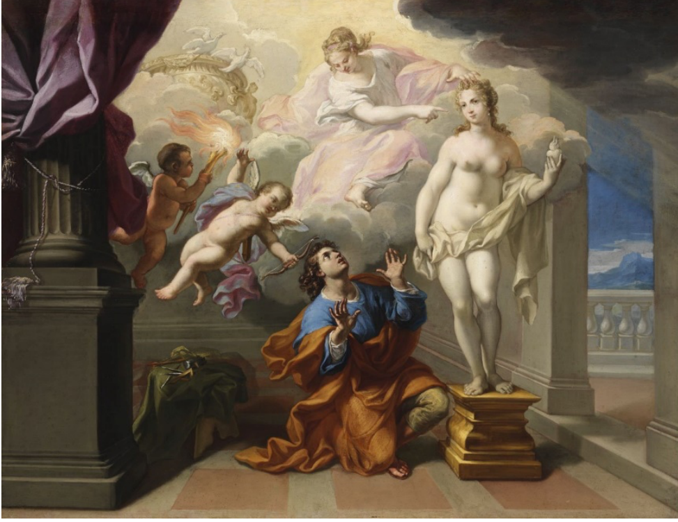
Görsel 12. Giuseppe Ghezzi, Pygmalion , 1695.

Yunan mitolojilerini konu alan farklı eserlerde de ateşin sembolleri farklı anlamlar taşımaktadır. Rubens'in "Savaşın Sonuçları" isimli resminde (Görsel 13) ateş öfkenin sembolü olmuştur. Savaş (Mars) tanrısı ve Aşk (Venüs) tanrıçasına saldıran Alekto, yüksekte tutulan bir meşale ile Mars'ı yıkıcı amacına sürüklemektedir. Alekto, Latince'den "öfke" olarak çevrilmektedir (Charlton & Charles, 1879).