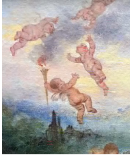
Görsel 15. Görsel 14 detay.

Antik Mısır mitlerini incelediğimizde, Ra tarafından dünyaya dışı bir aslan olarak gönderilen, Sekhmet olarak adlandırılan tanrıça Hathor neredeyse insanlığı yok etmiştir. Philip'e göre, "Ra, öfkelenen Hathor'u bir kobraya çevirerek alnına yerleştirmiştir" (Philip, 2022, s. 185). Yıkım, savaş ve intikam tanrıçasının hem şifacı olduğu hem de salgınları başlattığı rivayet edilmektedir. Elinde ateş üfleyen bir kobra şeklinde bir asa tutarken gösterilmektedir (Görsel 16). "Firavunların alınlarına taktıkları kobra Hathor'un "yok edici ateşin" sembolüdür. Çoğunlukla aslan başlı kadın biçiminde, elinde ateş saçan bir kobra tutarken resmedilmiş bu kana susamış Mısır savaş tanrıçası düşmanlarını oklarıyla öldürür, bedeni öğle Güneşi gibi ışıldardı" (Wilkinson, 2011, s. 30).