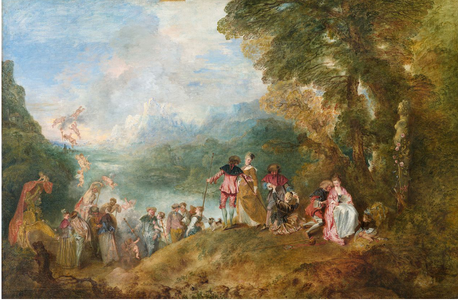
Görsel 14. Antonie Watteau, The Embarkation for Cythera , 1718-1719.

Antonie Watteau'nun "Çuha Adasına Yolculuk" isimli resminde (Görsel 14) Venüs'ün adasına yolculuğa çıkmaya hazırlanan aşıkların resmedildiğini görmekteyiz. Resmin sol üst köşesindeki meleklerin elinde yanan meşale betimlenmiştir. Bu ateş, aşkı sembolize etmektedir.