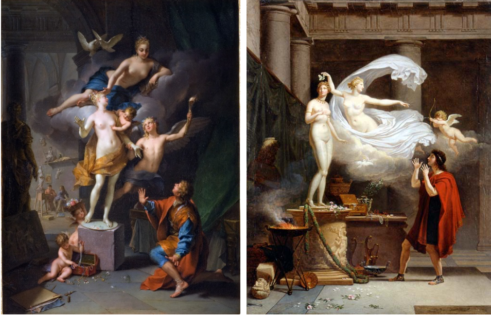
Görsel 9. Jean Raoux, Pygmalion Adoring His Statue , 1717 (Sol). Görsel 10. Louis Gauffier, Pygmalion and Galatea , 1797.