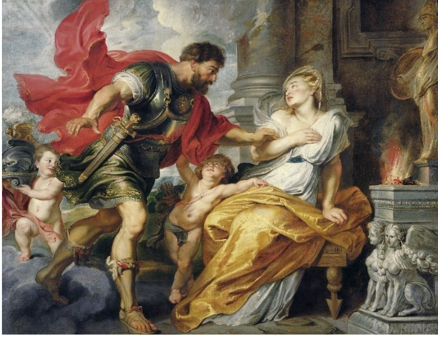
Görsel 5. Peter Paul Rubens, Mars ve Rhea Silvia , (1617-1620).