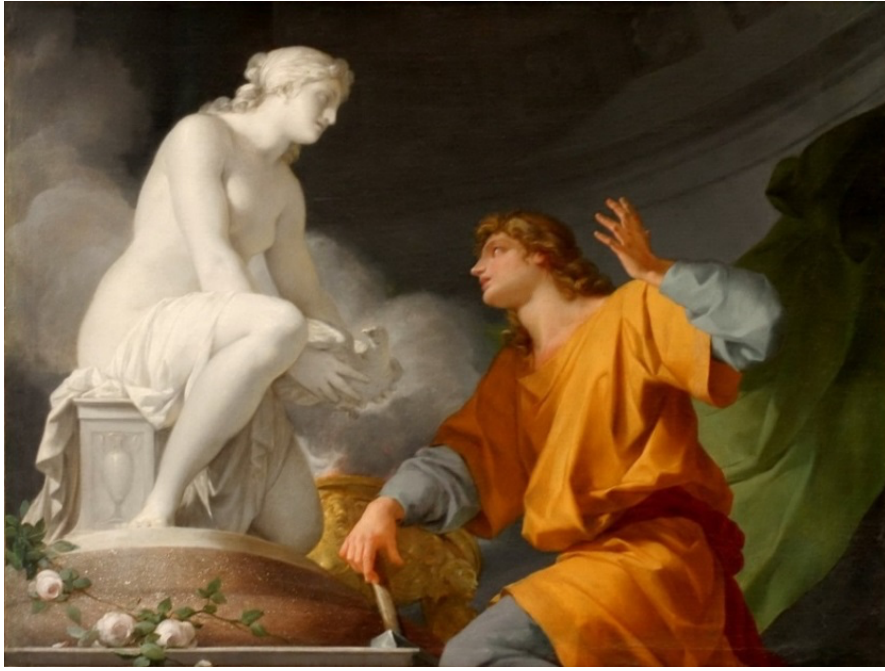
Görsel 11. Jean-Baptiste Regnault, The Origin of Sculpture (Heykelin Kökeni) , 1786. Alternatif başlık: Pygmalion Heykelini Canlandırmak için Venüs'e Dua Ediyor.