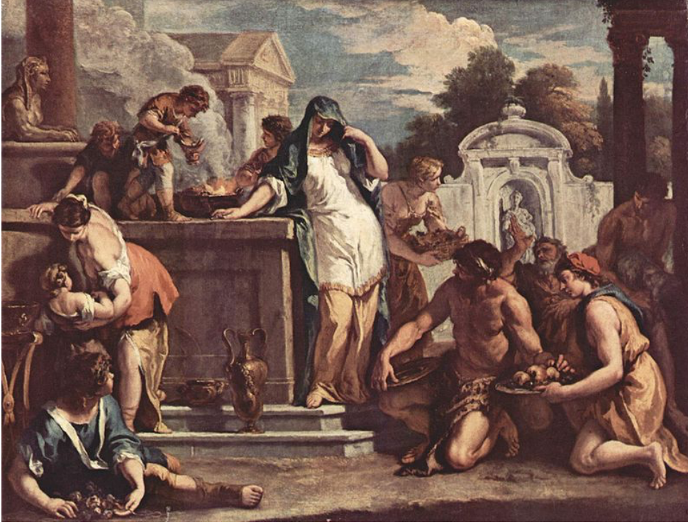
Görsel 4. Sebastiano Ricci, Hestia , 1723.

Yunan Mitolojisinde Titan Kronos ve Rhea'nın en büyük çocuğu Hestia, Antik Roma Mitlerinde Vesta aile ve ocak ateşi tanrıçası karşımıza çıkmaktadır. Hestia genellikle resim ve heykellerde olgun bir kadın olarak tasvir edilmektedir. Önceliği ev ve ocakta pişen nimetleri korumaktır fakat toplumu korumak da görevleri arasındadır. Türk mitolojisindeki Umay iyesi gibi toplumun düzenini ve devletin devamlılığını koruduğuna inanılmıştır. Roma'nın merkezindeki Forum'da Vesta Tapınağı mevcuttur. "Roma'nın tek kadın ruhban sınıfı olan Vesta Bakireleri'nin tapınağı olarak da bilinmektedir. Aeneas'ın Truva'dan getirdiği söylenen Vesta ateşine göz kulak olmak en önemli görevleriydi" (Philip, 2022, s. 152).