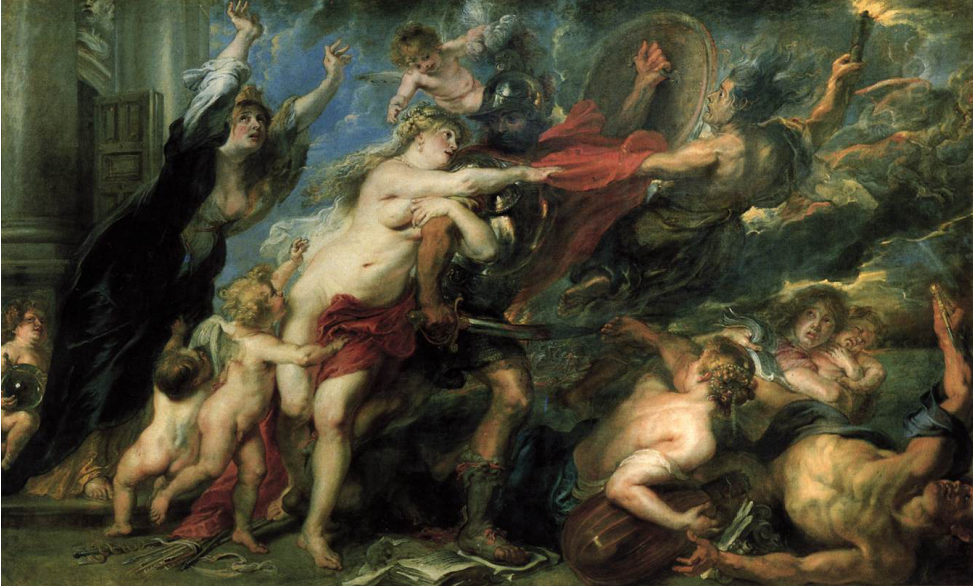
Görsel 13. Peter Paul Rubens, Consequences of War , 1637-38.

Yunan mitolojilerini konu alan farklı eserlerde de ateşin sembolleri farklı anlamlar taşımaktadır. Rubens'in "Savaşın Sonuçları" isimli resminde (Görsel 13) ateş öfkenin sembolü olmuştur. Savaş (Mars) tanrısı ve Aşk (Venüs) tanrıçasına saldıran Alekto, yüksekte tutulan bir meşale ile Mars'ı yıkıcı amacına sürüklemektedir. Alekto, Latince'den "öfke" olarak çevrilmektedir (Charlton & Charles, 1879).