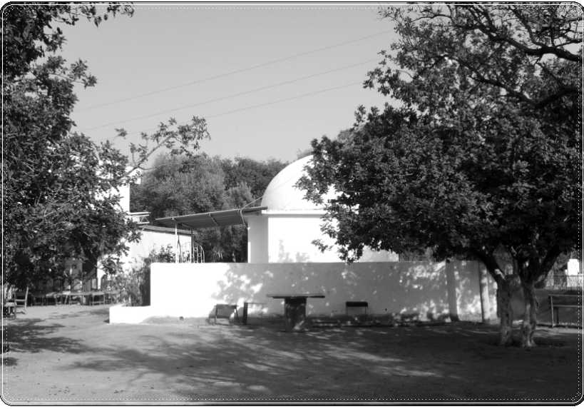
1- Üçgüllük Şeyh Muhammed el-Garîb Türbesi