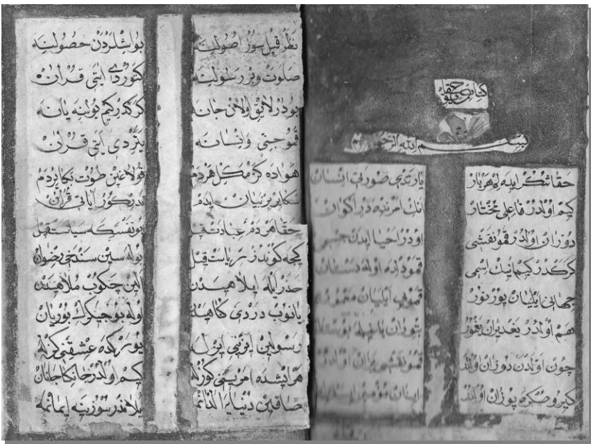
3- Şeyh Muhammed el-Garîb, Kitâb-ı Hakâyik 1-2.