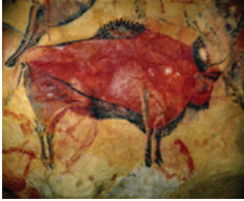
Görsel 6: Altamira Mağarası, M.Ö.15000-20000, Kuzey İspanya

Resim sanatında kırmızı renk kullanımının ilk örneklerine tarih öncesi çağlarda rastlanmaktadır. M.Ö. 15000-20000 zaman aralığına denk gelen, İspanya'nın ünlü Altamira mağarasının duvarlarında çizili olan hayvan figürlerinde kırmızı rengin hakimiyeti görülmektedir (Görsel 6). Av sahnelerinin betimlendiği bu resimlerde kırmızı renk vurucu ve dikkat çekici bir yoğunluktadır. Yine 40000 yıl öncesine tarihlenen Fransa'daki Lascaux mağarasında yer alan resimlerde de hayvan figürleri ve av sahneleri bulunmaktadır (Görsel 7). Hayret verici bir desen anlayışının ve renk ustalığının olduğu eserlerde ortaya konan renklerin yapımı da oldukça dikkat çekmektedir. Uzmanlar bu dönem insanların boya yapmak için doğal ve yerel kaynakları bir araya getirerek özel karışımlar elde ettiklerini belirtmektedir. Kullanılan bu tekniğin ileri bir teknik olduğu bildirilerek, özenli bir çalışma sonucu ortaya konduğu ifade edilmektedir.