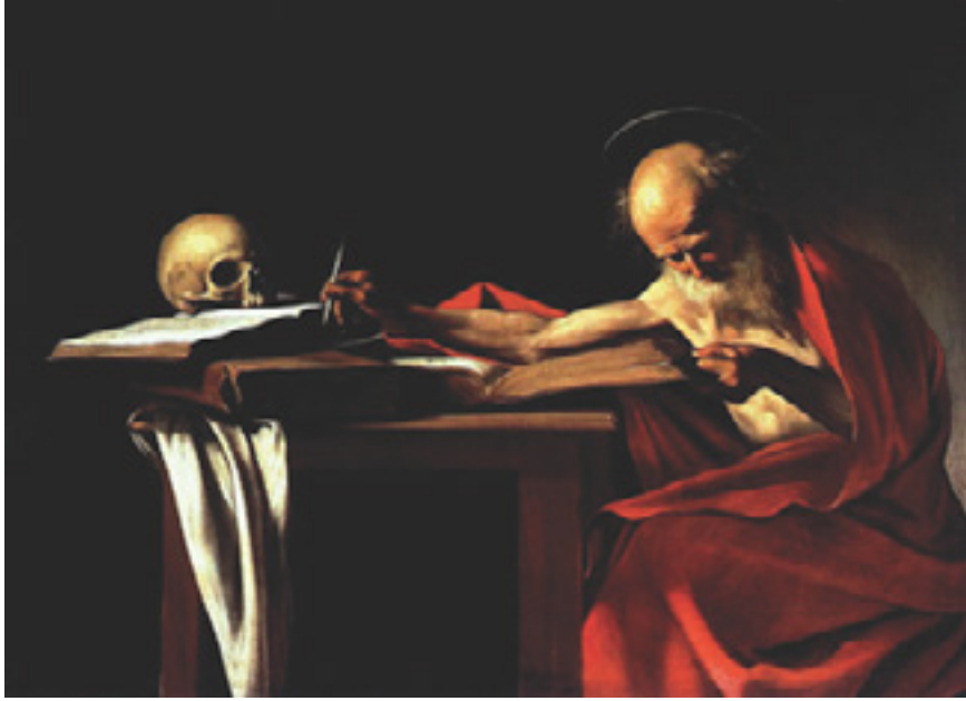
Görsel 13: Caravaggio, Aziz Jerome, 1605-1606, Galeria Borghese, Roma, İtalya