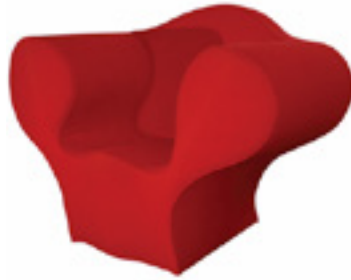
Görsel 27: Ron Arad, Yumuşak Büyük Kolay Sandalye , 1991, Musee des Arts Decoratifs, Paris, Fransa

Kırmızınının 19 Mart 2008 ve 1 Kasım 2009 tarihleri arasında Paris Dekoratif Sanatlar Müzesi'nde açılan "Olabilirdiğince Kırmızı" adlı sergide başat rol üstlendiği görülmektedir. Sergide kırmızıya yüklenen anlamlardan türeyen kırmızı nesnelere bir araya getirilmiştir. Fransız toplumu üzerine odaklanılan sergide Al, Şarap Kırmızısı, Karmen Kırmızısı, Kiraz Kırmızısı, Koyu Kırmızı, Parlak Kırmızı, Magenta, Kızıl, Pas Kırmızısı, Terra Cotta Kırmızısı, Zincifre Kırmızısı ve daha sayısız kırmızı bulunmaktadır. Renkler sözlüğü yazarı Michel Pastoureau "Kırmızı renginden söz etmek, lafı gereksiz yere dolaştırmaktan başka bir şey değildir. Çünkü renk demek kırmızı demektir. Kırmızı üstün bir renktir, tüm renklerin önünde öncesindedir" demiştir. (Sanat Dünyamız, 2008-2009: 18). Ron Arad'a ait "Yumuşak Büyük Kolay Sandalye" isimli çalışma, günümüzün modern tasarımlarını yansıtmaktadır (Görsel 27). Sadece kırmızı renkten oluştuğu görülen sandalye yumuşak formlara sahiptir.