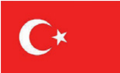
Görsel 4: Türk Bayrağı