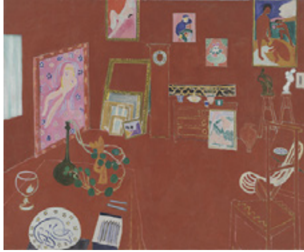
Görsel 16: Henry Matisse, Kırmızı Stüdyo, 1911, tuval üzeri yağlıboya, 181 x 219.1 cm, Modern Sanat Müzesi, New York

Fovist akımın öncülerinden olan Henri Matisse'e (1869-1954) ait "Kırmızı Oda", "Kırmızı Uyum" gibi adlarla da bilinen "Akşam Sofrası" nda, yoğun, saf ve canlı renkler göze çarpmaktadır. Kırmızı ana renk olup, renk başlı başına ifade aracı olarak kullanılmıştır. Geleneksel çizim ve perspektif kurallarının bilinçli olarak bir kenara bırakıldığı çalışmada, iki boyuta indirgenen formların varlığı dikkat çekmektedir (Görsel 15). Yüzeydeki tüm formların kompozisyonun bütünüyle özdeşleştiği ve hepsinin bir bütün olduğu görülmektedir. Matisse'in kullandığı Fovist üslup, 1905-08 arası sürerek, uzun sanat yaşamı boyunca gelişme göstermiştir.