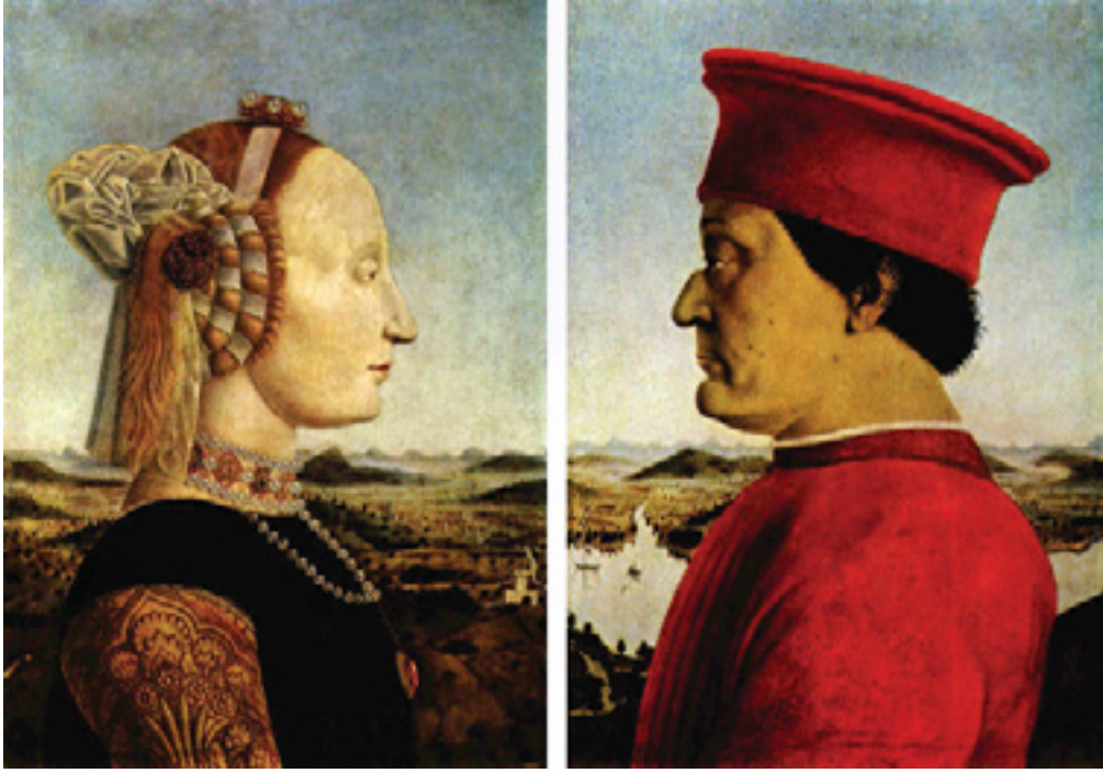
Görsel 12: Pier Della Francesca, Federico da Montefeltro ve Battista Sforza Portresi, 1465-66, Panel, 47 x 33 cm (her biri), tahta üzerine yağlı boya ve tempera, Galleria degli Uffizi, Floransa

Pier Della Francesca'ya ait yine Rönesans dönemi eserlerinden biri olan "Federico da Montefeltro ve Battista Sforza Portresi" adlı eserde de kırmızı rengin kullanımı dikkat çekmektedir (Görsel 12). Rönesans Avrupasında kırmızının zengin kesime, prestij ve güce ait olduğu görülmektedir. Rönesans dönemine ait kırmızı hakkındaki inançların Klasik kültüre dayandığı bildirilmektedir (Greenfield, 2008: 79). Yunan ve Romalıların inancına göre kırmızı ilahi bir renk olup, klasik düğünlerde, cenazelerde ve kutsal pek çok ritüelde kırmızının varlığı göze çarpmaktadır. Kırmızı renk içerisinde özellikle kızıl ve koyu kırmızı hükümdarlar için en seçkin renk olarak belirtilmektedir. Rönesans döneminde kırmızıya duyulan özlemin oldukça yüksek olduğu bilinmektedir. Çünkü bu dönem Avrupası'nda kırmızı kumaş az bulunmaktaydı.