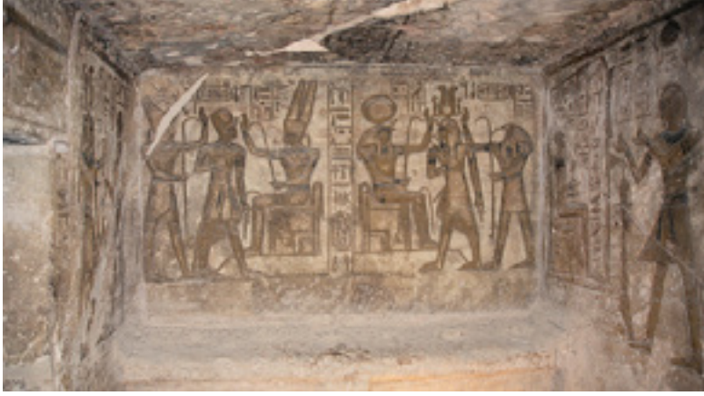
Görsel 8: Ebu Simbel Tapınağında bulunan duvar resmi

Kayaların üzerindeki girinti ve çıkıntıların da göz önünde bulundurularak yapıldığı görülen resimlerde gerçekçi bir görünüm dikkat çekmektedir (Çömen, 2010: 22). Gözleme kabiliyetlerinin güçlü olduğu ve figürlerin görüntülerinin anlık olarak birbirini takip ettiği görülmektedir.