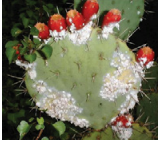
Görsel 2: Koşnil ( Dactylopius coccus )

Mineral kaynaklı bir madde olan aşı boyası, killi kumlar, kızıllaşmış topraklar gibi doğal toprak boyalarını kapsamaktadır. Aşı boyası kiremit kırmızısı bir renkte olup, prehistorik dönemlerde kayaların üzerine yapılan pek çok resimde kullanılmıştır. Ayrıca çömleklerin üzerine çizilen resimlerde de kullanıldığı belirtilmektedir. “Kiremit kırmızısı renginde bir toprak boyadır. Aşı demir oksitli boyadır. Eskiden ahşap evlerin kirliliğini kapatmak için cephelerine sürülürdü.” (Turani, 2011: 17)