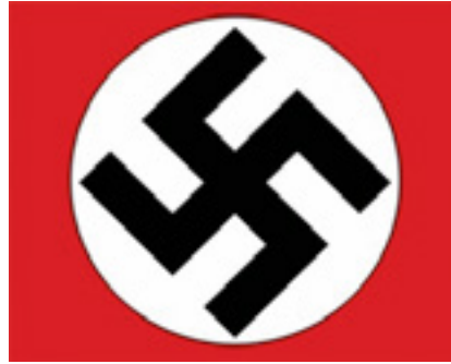
Görsel 3: Gamalı Haç

Kırmızı başkaldırı ve devrimin rengi olarak eleştirel ve politik bir anlama da sahiptir. Yaşanan pek çok devrimin adeta ruhu olan bu renk, gücün, cesaretin ve direnişin simgesi haline gelmiştir. Kırmızı renk üzerine beyaz daire ve içinde siyah gamalı haç (Swastika) bulunan bu simge Naziler için yaratılışın sembolüdür (www.tersninja.com) (Görsel 3). Pek çok ülke bayrağında da kırmızı rengin hakimiyeti dikkat çekmektedir. Her ülkenin kırmızı rengi seçmesinin farklı farklı nedenleri vardır. Türk ve Bulgaristan bayraklarının da aralarında bulunduğu bazı bayraklar şehitlerinin kanını taşımaktadır (Görsel 4). Aynı zamanda bu kan cesaretin de bir göstergesidir. Genel olarak diğer ülke bayraklarında da kırmızı renk bulunmakta ve doğan güneş, özgürlük, eşitlik ve birlik gibi anlamlar taşımaktadır (Görsel 5). “Kırmızı Nijerya ve Almanyada şanssız anlamında, Çin, Danimarka ve Arjantin’de şans anlamına gelmektedir. Çin, Kore ve Japonya’da aşk, Hindistan’da arzu ve hırsı yansıtmaktadır.” (Özer, 2012: 275)