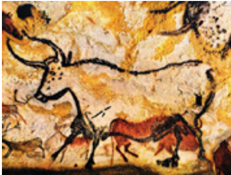
Görsel 7: Lascaux Mağarası, M.Ö. 17.000, Güneybatı Fransa