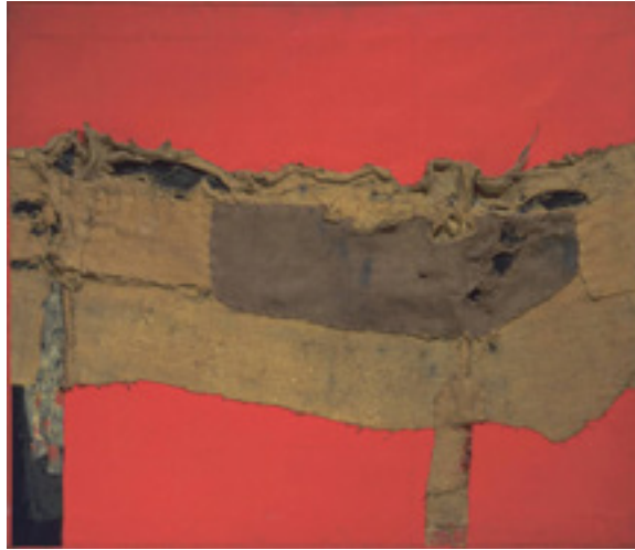
Görsel 22: Alberto Burri, Çıval bezi ve kırmızı, 1954, tuval üzerine çıval bezi, zambak ve vinil boya, 80 x 100 cm, Tate Gallery, Londra