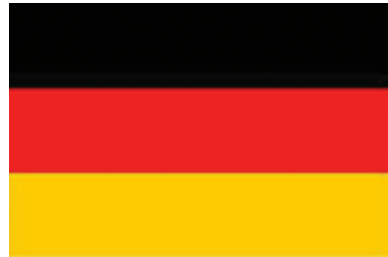
Görsel 5: Almanya Bayrağı