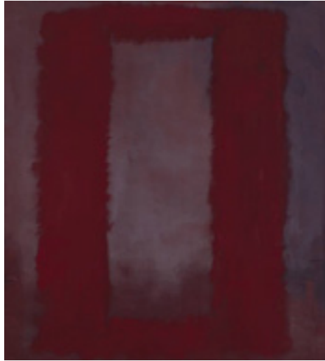
Görsel 23: Mark Rothko, Vişneçürüğü üzerine kırmızı, 1959, tuval üzeri yağlıboya, 266.5 x 239 cm, Tate Gallery, Londra

Soyut Dışavurumcu bir anlayışa sahip olan Mark Rothko'nun eserlerinde de kırmızının yaygın kullanımına rastlanmaktadır. Kırmızının pek çok çeşidini çalışmalarında kullanan sanatçı, neredeyse sadece, renk ve şekilleri kullanarak kendini ifade etmekte gibidir. Büyük boyutlu olan “Vişneçürüğü üzerine kırmızı” adlı eserde ise ışıldayan koyu bir kırmızı kullanımı vardır. Arka plan vişneçürüğü renginden oluşmakta, üzerinde de kırmızının koyu bir tonundan oluşan çerçeve benzeri bir dikdörtgen form yer almaktadır (Görsel 23). “ Rothko resimlerindeki şekilleri çoğunlukla dikdörtgen-şeyler’ hatta portreler olarak görüyordu. ” (Sanat Dünyamız, 2008: 129) Renk alanı ressamlarına yakın bir tavır sergilediği görülen Rothko, tuval üzerinde hareketin kullanımını yerine renk kullanımına ağırlık vermektedir.