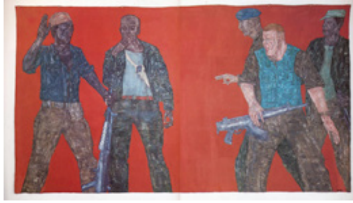
Görsel 26: Leon Golub, Paralı Askerler IV , 1980, tuval üzerine akrilik, 305 x 584 cm, Londra Saatchi Koleksiyonu

'Paralı Askerler IV' isimli Leon Golub'a ait çalışma oldukça büyük boyutludur. Arka planın kırmızıdan oluştuğu eserde, yine şiddetli bir gerilim ve alay edici bir ifade söz konusudur (Görsel 26). Vurucu gerçekçiliğin yansıtıldığı eserde, paralı askerlerin saldırgan yapısı, terör ve vahşete yönelik bir dünya resmedilmektedir. Grafik unsurların yer aldığı çalışmada medya görüntülerinin kullanımı görülmektedir. Bu çalışma ile sanatçının vahşeti evrensel bir sosyal olay olarak eleştirdiği belirtilmektedir (Sanat Dünyamız, 2008: 149).