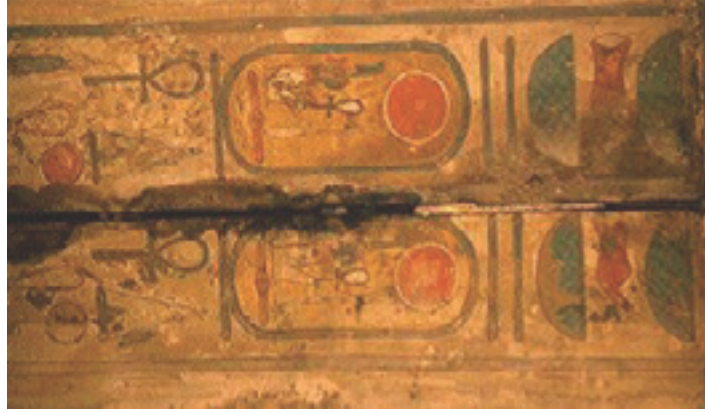
Görsel 9: Eski Mısır dönemine ait bir tapınak duvarı

“Mısırlı ressamların başlangıçta fırça yerine saz ve kamış saplarını kullandıkları anlaşılıyor. Bunlar ucu yontulmuş bitki parçalarıydı. Daha sonraları palmiye liflerinden yapılmış fırçalar kullanmaya başlamışlardır. Küçük kasecikleri ve çukur deniz kabuklarını da boyalarını koymak için kullanıyorlardı. Doğal nesnelere elde edilen renkler; sözgeşi kökboyalı, mısır resim sanatçılarının belli başlı malzemeleri arasındadır. Okr (Aşıboyası), mavi ve yeşil renkler elde etmek için dövülmüş emaye, is birikintileri, yarım kalmış resimlerin yakınındaki kaplarda bulunmuştur. Boya malzemesi suyla karıştırılarak inceltilmiş ve çam sakızı eriyiği ile de yapışkanlığı sağlanmıştır. Okr renklerinin insan ve hayvan bedenlerinde kullanıldığını görüyoruz. Bu renkten kırmızı, kahverengi, sarı gölgeler elde edilmiştir. Kadın figürlerinde beden ve yüzün rengi, erkek figürlerinden daha açıktır. Ancak kadın ve erkek guruplarında açık ve koyu renk çeşitliliklerine de rastlanabilir. Beyaz, elbiselerde ve bazı durumlarda da zemin rengi olarak kullanılmıştır. Okr ve beyaz karışımından, çok kullanılan bir çeşit pembe elde edilmiştir.” (Tansuğ, 2006: 29-30)