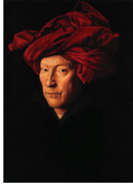
Görsel 11: Jan Van Eyck, Türbanlı Adam Portresi, 1433, Ahşap üzerine yağlıboya. 33.3 x 25.8 cm. National Gallery, London

Rönesans dönemi eserlerinden biri olan ve Jan Van Eyck'a ait “Türbanlı Adam Portresi” adlı çalışma, resimde değişen konulara örnek teşkil ediyor olması ve toplumsal kültürün içinde kırmızının konumlanmasını belirtmesi adına öne çıkan bir yapıt olarak değerlendirilmektedir (Görsel 11). Çalışmada dönemin burjuva sınıfının yansıtlığı görülmektedir. O dönemde sınıf atlamak isteyen Rönesans erkekleri tarafından kepler ve şapkalar tercih edilen birincil aksesuarlardandı. Kızıl ve koyu kırmızı elbiseler Venedik ve Floransa'da üst mevkideki pek çok devlet memurunun önemli bir parçasıydı (Greenfield, 2008: 86).