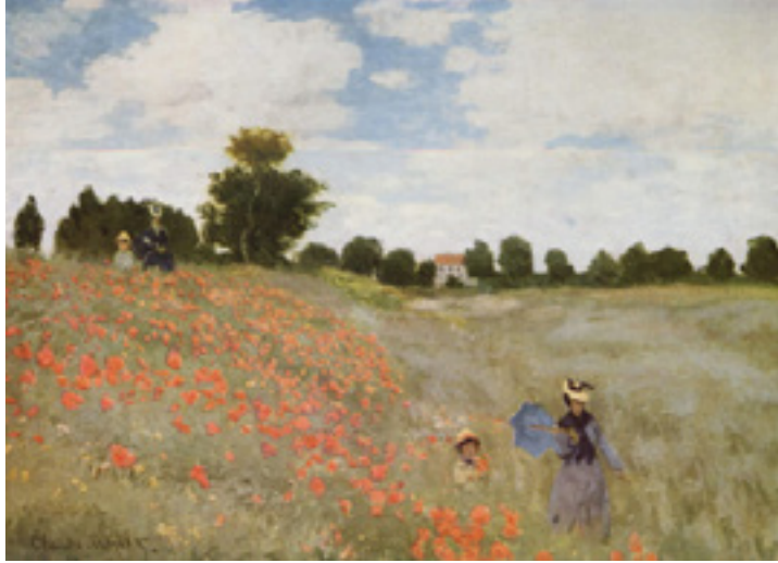
Görsel 14: Claude Monet, Red Poppies at Argenteuil, 1873, Musee d'Orsay, Paris, Fransa

yerek, algıladıkları izlenimleri tuvallerine aktarmak istemişlerdir. Boudin “Doğrudan doğruya doğa karşısında boyanan tuvaler, canlı fırça sürüşlerine yol açar ki; bunlar atölyede elde edilemez” demiştir (Turani, 1992: 33). Aşağıdaki eserde Claude Monet’e ait olup, bir kır manzarasını yansıtmaktadır (Görsel 14). Açık havanın resmedildiği eserin ön planında bir kadın ve kız çocuğu figürü, arka planda ise yine bir kadın ve çocuk figürü ile beraber ağaçlar ve ağaçların arkasında bir ev bulunmaktadır. Açık kırmızı tonlardan oluşan gelincikler ise resmin sol tarafında bulunmaktadır.