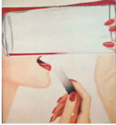
Görsel 24: James Rosenquist, Marylin için çalışma, 1962, tuval üzerine yağlıboya, 91.5 x 95.2 cm, Özel Koleksiyon

1962 tarihli James Rosenquist'e ait "Marylin için Çalışma" isimli esere bakıldığında kırmızının egemenliği göze çarpmaktadır (Görsel 24). Çekici imgeler ve erotik imalarla yüklü eser kışkırtıcı olup, sanat alımlayıcısına cinsel çağrışımlarda bulunmaktadır. Yüzünün yarısı bir bardakla kapatılan kadın figürü, izleyiciye, neden yüzün yarısı bir bardakla kapatılmıştır şeklinde bir soru sordurmaktadır. Örtülü bir anlam taşıyan eserin çok bilinen imgeleri kullanması, onu Amerikan Pop Sanatı ile bağdaştırmaktadır (Sanat Dünyamız, 2008: 151).