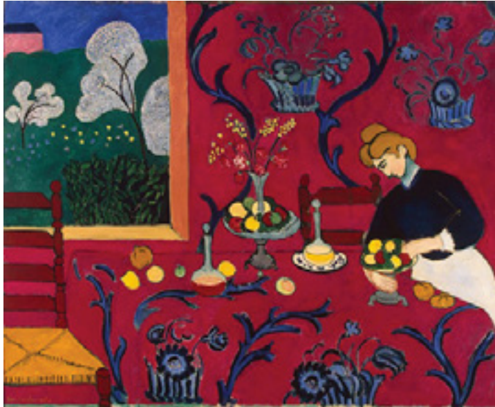
Görsel 15: Henry Matisse, Akşam Sofrası (Kırmızı Uyum), 1908, tuval üzeri yağlıboya, 246x180 cm, St. Petersburg Hermitaj Müzesi