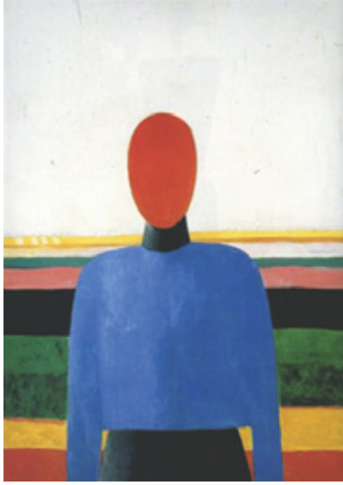
Görsel 18: Kazimir Maleviç, Kadın Büstü, 1928-32, Kontrplak üzerine yağlıboya, 73 x 52.5 cm, Rusya Devlet Müzesi, St. Petersburg, Rusya