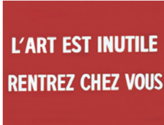
Görsel 25: Ben Vautier, Sanat Faydasızdır, Evinize Gidin, 1971, tuval üzeri akrilik, 97 x 130 cm, Galerie Bruno Bischofberger, Zürich

Ben Vautier'in imzasını taşıyan, türkçesi "Sanat Faydasızdır, Evinize Gidin" olan eserde de kırmızı ile karşılaşmaktadır (Görsel 25). Saldırgan bir bildirim olduğu çalışmada sanatın geçerliliği sorgulanmaktadır. Bu tutumuyla Fluxus akımına yakın bir tavır sergilediği görülen çalışmanın arka planındaki kırmızı renk dikkat çekicidir. Kırmızının şiddetli geriliminin hissedildiği çalışmada, beyaz renklerle yapılan yazı güçlü bir etki oluşturmaktadır. Tek cümlelik sözlerle sanatını yaratan Vautier, sanat çevresinin hiyerarşik yapısıyla adeta dalga geçmektedir (Sanat Dünyamız, 2008: 141).