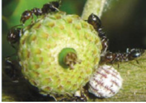
Görsel 1: Kermes

“Romalılar kermes ile boyanmış kırmızı rengi ‘scarlatum’ olarak adlandırmıştır. Bu dönemde farklı elyaf (ipek, yün vb. gibi) türlerini boyanmasında kermes böceğini kullanmışlardır. Ayrıca bu böcekten elde ettikleri pigmentleri duvar resimlerinde ve ikonaların da kullanmışlardır. Kermes Ortaçağda Venedik ve Marsilya’da toplanarak, diğer Avrupa ülkelerine ihraç ediliyordu. Venedikliler kermesten elde edilen kırmızı rengi süper renk olarak kabul etmişlerdir. Kermesin hem üretim tekniklerini kontrol etmiş hem de kalitesini korumuşlardır. Böylece kermes boya-maları “Venedik kırmızısı” olarak tüm dünyada ün kazanmıştır.” ( http://www.turkelhalilari.gov.tr/ , Erişim tarihi: 30.12.2014).