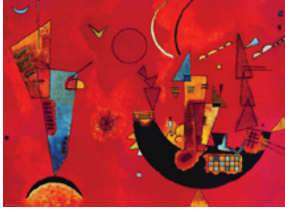
Görsel 21: Wassily Kandinsky, MIT UND GEGEN, 1929

Almanya'daki Bauhaus okulunda öğretmenlik yaptığı dönemde Kandinsky, hevesli bir şekilde bilimsel kitap ve ansiklopedilerden embriyolojik, zoolojik ve botanik görüntülerin röprodüksiyonlarını toplamış ve onları derslerinde kullanmıştır. Ernst Haeckel ve Karl Blossfeld'in biyoloji ve sitoloji alanlarında yazdıkları kitapların etkisinde kaldığı bilinen sanatçının atölyesinde fizik, botanik, zooloji, astronomi dergilerinden alınan resimler bulundurduğu düşünülmektedir (Bayramın, 2011: 32). Kendisinin büyük bir merak ile böceklerin şekillerini incelediği ve mikroorganizmaların, tek hücreli canlıların gizemli dünyasından oldukça etkilendiği bilinmektedir.