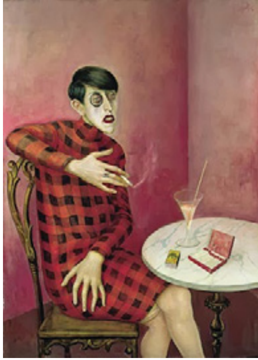
Görsel 17: Otto Dix, Gazeteci Sylvia von Harden'in Portresi, 1926, Pano üzerine yağlıboya, 88 x 120 cm, Paris, Musee National d'Art Moderne

Kırmızının Rus Avangard sanatında önemli bir rol oynadığı görülmektedir. Rus dilinde 'krazniy' 'kırmızı' renge karşılık gelip, 'güzel', 'önemli' ve 'başlıca' gibi anlamlar taşımaktadır. Rusya'da kırmızının pek çok anlamı bünyesinde barındırdığı, dinsel ikonlardan giysilere, modern sanat yapıtlarından sosyalizm simgelerine kadar, her alanda başat renk olarak öne çıktığı görülmektedir. Rus Avangardının temsilcisi Maleviç'in Rus köylüsünü resmettiği eserde, özgün halk kültürünün yeniden keşfi yapılmıştır. Rus köylülüğünün ruhsal durumunu yaratmayı amaçlayan sanatçı, kırmızı lekelerle kapladığı yüz­süz başlarla şehitlik metaforlarını yansıtmaktadır (Petrova, 2008: 60).