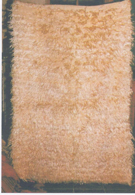
Foto. 3- Yamçı tülü