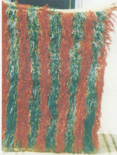
Foto.2- Yamçı tülü