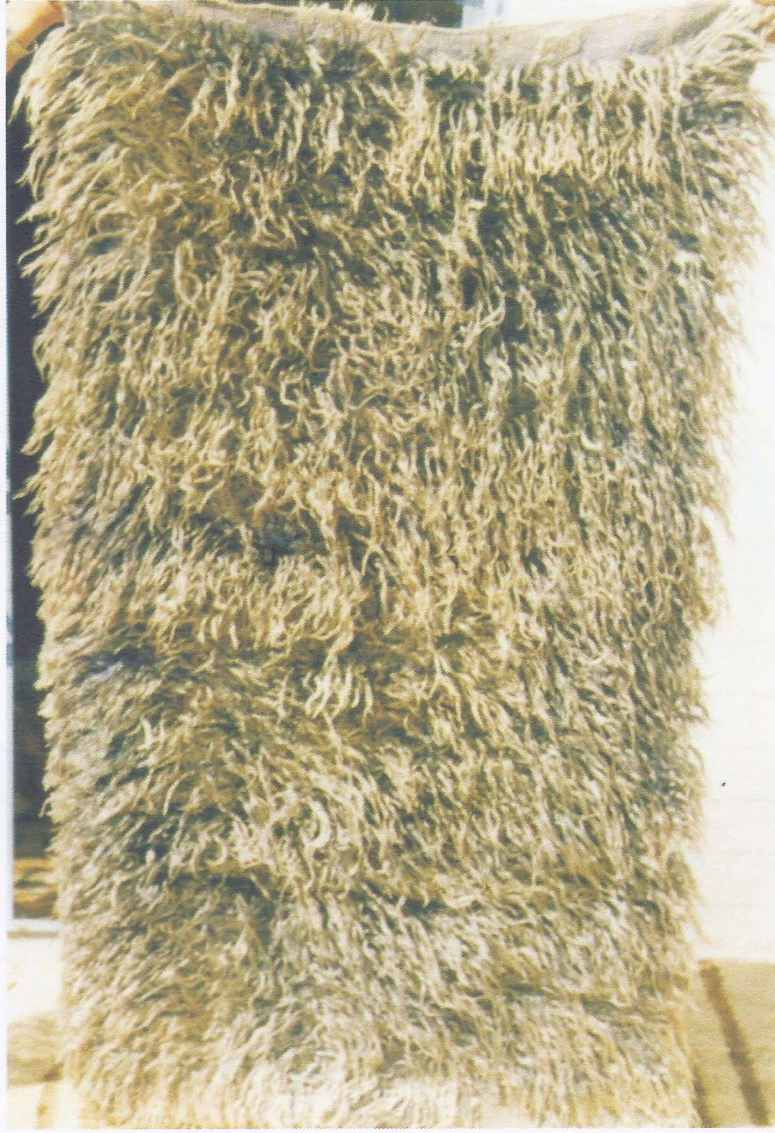
Foto. 5- Yamçı tülü.