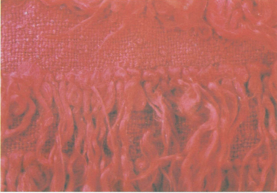
Şek. 1- Yamçı tülü dokuma tekniği