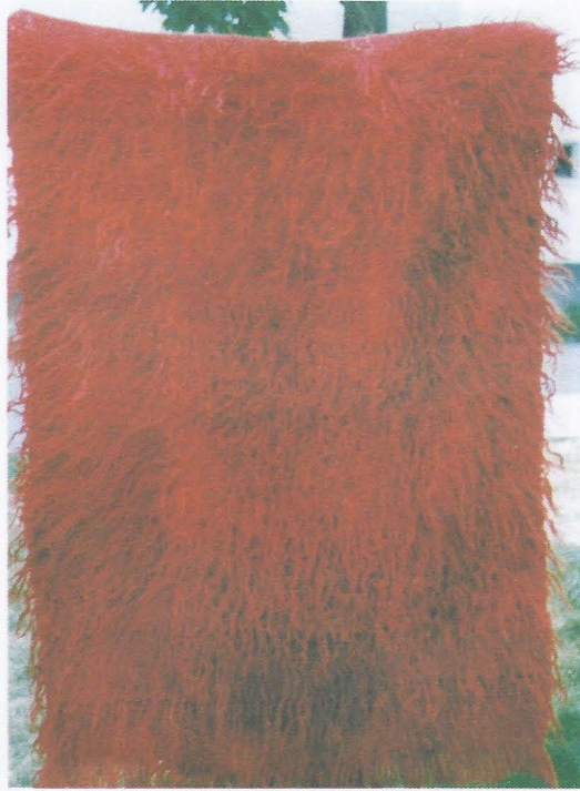
Foto. 4- Yamçı tülü.