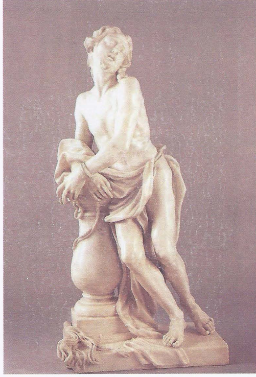
Foto. 3- Filippo Parodi, İsa, 1679, Galleria di Palazzo Reale, Cenova.