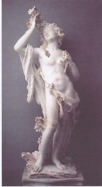
Foto. 6- Filippo Parodi, Hyaknthos (Sümbül), 1680, Galleria di Palazzo Reale, Cenova.