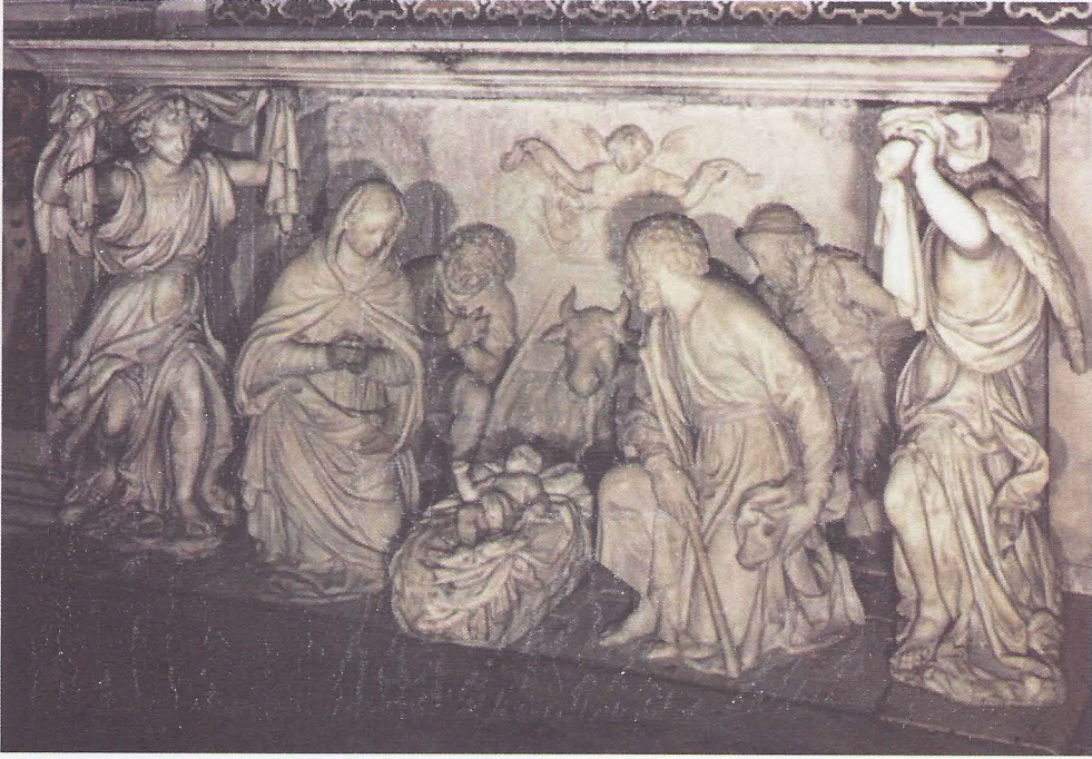
Foto. 1- Tommaso Orsolino, İsa'nın doğuşu, Chiesa del Gesù, Cenova.