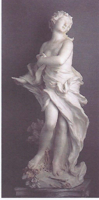
Foto. 5- Filippo Parodi, Venüs, 1680, Galleria di Palazzo Reale, Cenova.