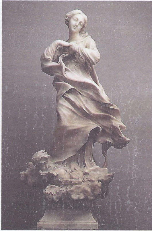
Foto. 2- Filippo Parodi, Saf Meryem, 1660, Santa Maria della Cella, Cenova.