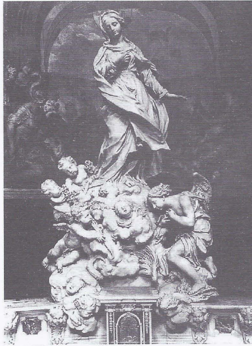
Foto. 4- Filippo Parodi, Saf Meryem, 1700, San Luca, Cenova.