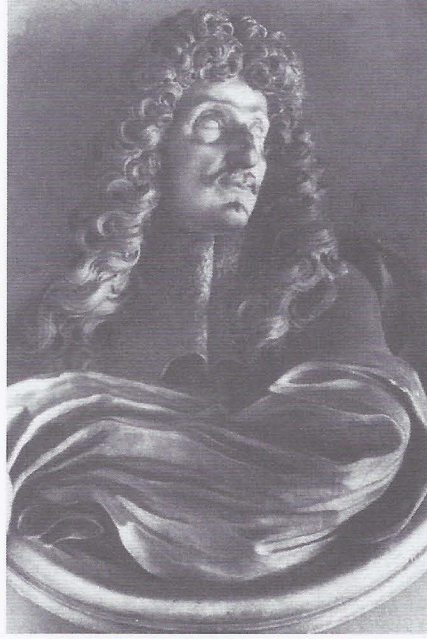
Foto. 9- Giacomo Antonio Ponsonelli, Don Marcantonio Grillo, 1683 Albergo dei Poveri, Genova.