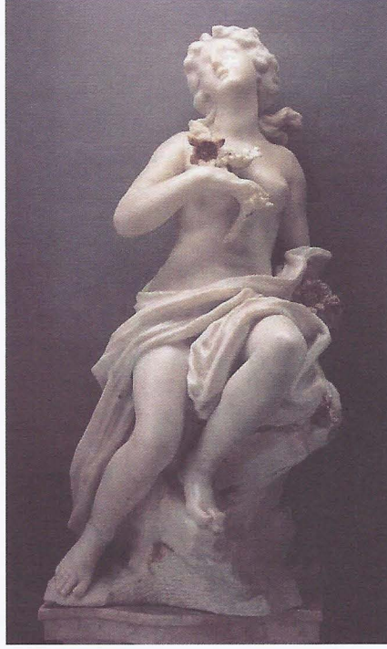
Foto. 7- Filippo Parodi, Clytre (Ayçiçeği),1680, Galleria di Palazzo Reale, Genova.