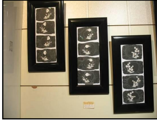
Resim 9: Ebru çalışması

olanlarına” penç berk nokta” altı köşelilerine ise “şeşhane nokta” adı verilmektedir. El yazımı kitapların sayfalarındaki yazılan, yazıların etrafını çevreleyen yuvarlak içleri boş süslemelere gül denmektedir. Bu motifler de buldukları yerlere göre de secde gülü, vakfe gülü, hizip gülü, sure gülü, ve cüz gülü gibi isimler almaktadır.