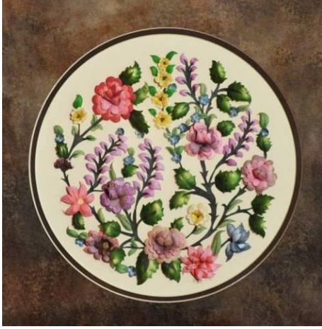
Resim 6: Kaat'ı Çalışması