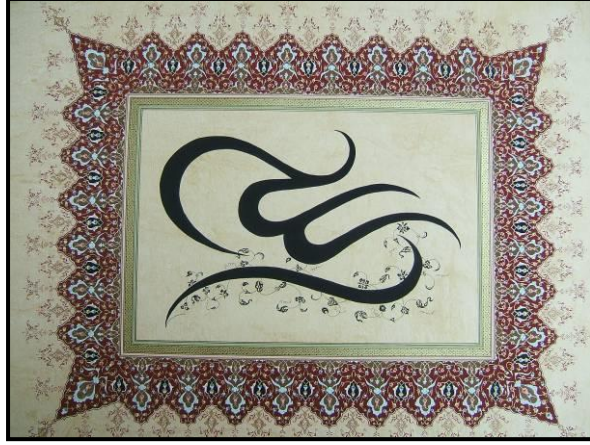
Resim 8: Tezhip çalışması

değerlendirilebilir. Esas desene “erkek oyma”, oyulmuş iç kısımlara ise “dişi oyma” denir. Bu sanat filigre, silüet sanatı, dekopaj, kâğıt fligre, kâğıt kesme, silüet kesme, efşan diye adlandırılmaktadır (Özcan, 2007: 194). Katı’, zaman içerisinde “kaatı”, “katıg”, “katıa”, “kağıt”, “katıacı”, isimlerini alarak kullanılmıştır (Özönder, 2003: 105).