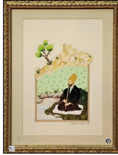
Resim 5: Neyzen

Minyatür çalışmasının alt maddesi kağıttır, aherlenmiş ve mührelenmiş kağıt üzerine yapıldığı gibi bazı çalışmalarda da zemin zamlı üstübeçle sıvanır veya altın varak yapıştırılır. Suya batırılan ince samur fırça ile desen çizilir, çizilen yerler mat kalır, böylece boyanacak yerler belirlenir. Renkler düz ve gözü yormayacak bir ahenk ve uyum içindedir. Minyatür bir belge niteliği taşıdığı için konu detayı ile aynen belirtilmektedir. Böylece minyatürlere bakarak tarihi bilgi elde etmek mümkündür. Minyatürde perspektif yoktur, figürler birbirini kapatmaz, geride olanlar yukarı doğru çizilerek ön ve arka desenler oluşturulur. Kişilerin önemine göre orantı kurmak, manzara ve mimari yapılarda boy farkı yaratmamak, detayları bütünüyle göstermek, altın ve gümüş kullanmak başlıca özellikleridir (Atabek, 1996: ders notları).