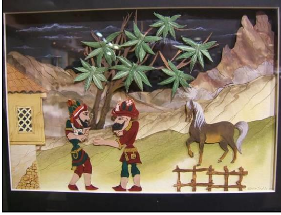
Resim 4: Hacivat ile Karagöz