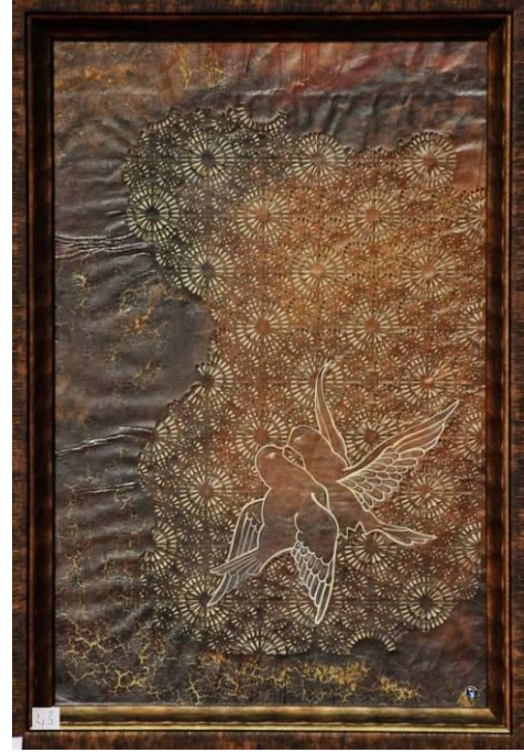
Resim 7: Vuslat (kaat'ı çalışması)