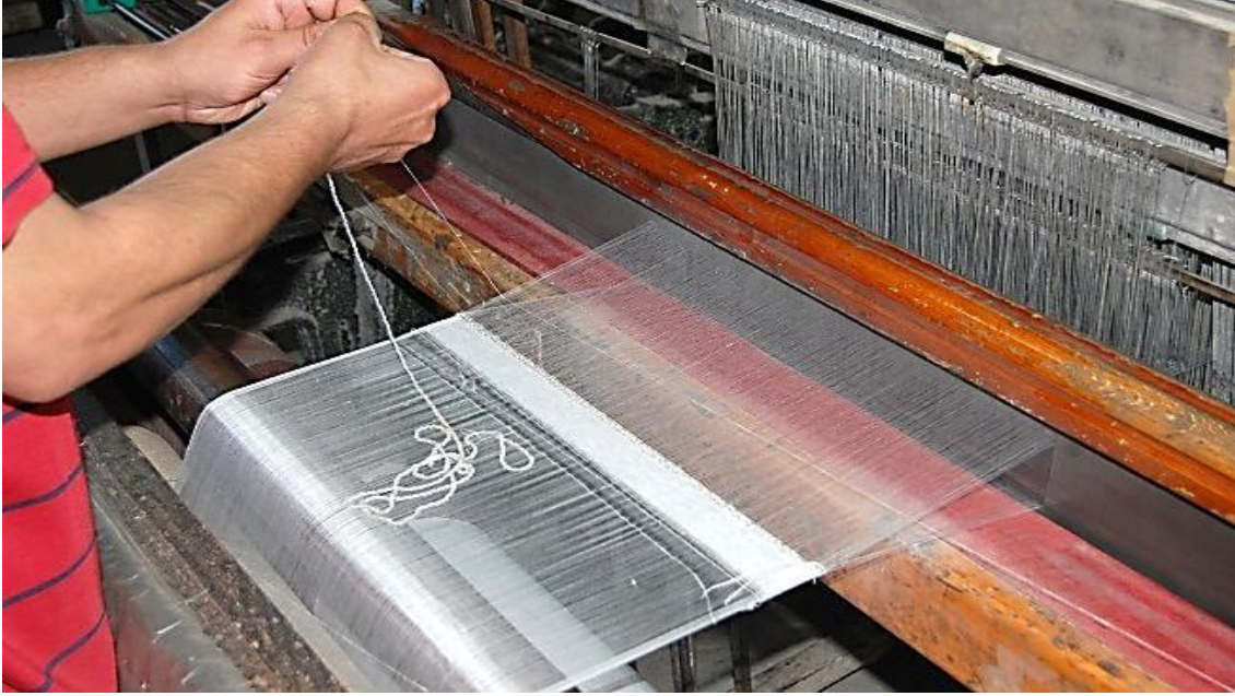
Şekil 0-1 Boncuklu Ödemiş İpeği'nin kara tezgahta dokunması